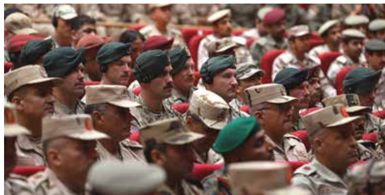
Военнослужащие из разных стран принимают участие в церемонии открытия учений «Яркая звезда 2025».

С 28 августа по 10 сентября 2025 г. эти учения были сосредоточены на современных гибридных угрозах, требующих взаимодействия сухопутных, морских и воздушных сил стран-партнеров для поддержания региональной безопасности. Многие из этих угроз представляют собой скрытые операции, направленные на то, чтобы избежать прямой конфронтации с