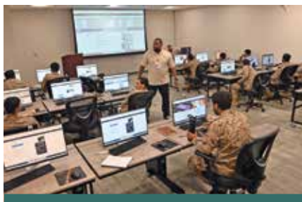
Офицеры из Саудовской Аравии на занятиях в Техасе по эксплуатации системы THAAD.

Девяносто семь саудовских офицеров прошли индивидуальную подготовку на Форт-Блиссе в ноябре 2024 г., но цель состоит в том, чтобы обучить более 760 саудовских военнослужащих управлению