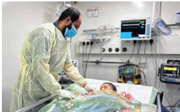
В 2025 г. Объединенные Арабские Эмираты оказывают гуманитарную помощь в секторе Газа в рамках операции «Благородный рыцарь 3».

переброшено 395 метрических тонн продовольствия и предметов первой необходимости.