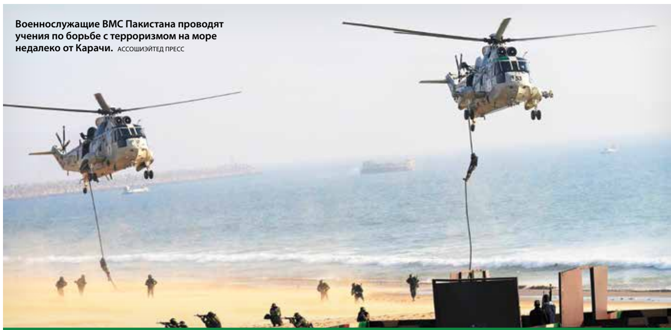
Военнослужащие ВМС Пакистана проводят учения по борьбе с терроризмом на море недалеко от Карачи.

Из-за слухов о том, что в Лиму высадились американские спецназовцы из отряда «Дельта» и готовятся ворваться в резиденцию, террористы освободили американских заложников. Остальных спасли перуанские