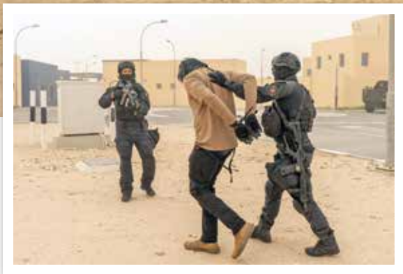
Объединенные силы специального назначения Катара, слева, присоединяются к военнослужащим США из 5-й группы специального назначения для штурма условной лаборатории террористов в ходе учений «Несокрушимый страж».