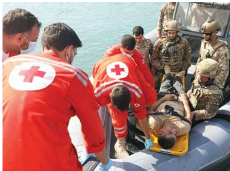
Ливанские военные отрабатывают медицинскую эвакуацию на учениях «Решительный союз 26».

Предыдущие учения серии «Решительный союз» состоялись в июле 2023 г. Их проведение каждые два года укрепляет сотрудничество и налаживает взаимопонимание между вооруженными силами США и Ливана. ♦