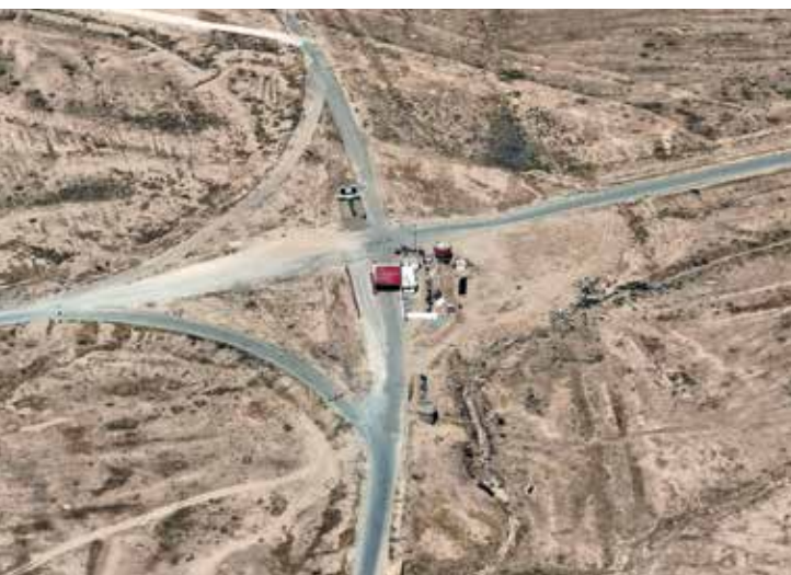
Пост охраны на границе Ирака с Сирией отвечает за противодействие незаконному обороту оружия, наркотиков и другой контрабанды.

Комиссии по пограничным портам, которое длится уже пятый год, мы приняли множество решений и достигли многих целей, в том числе изъяли оружие, наркотики и поддельные лекарства, которые контрабандисты пытались провезти в страну. Еще одним заметным достижением, напрямую связанным с деятельностью Комиссии по пограничным портам, стала борьба с фиктивными финансовыми переводами, что позволило предотвратить незаконный отток долларов из Ирака. Были выявлены банки, компании и частные лица, причастные к коррупции, и в тесном сотрудничестве с судами и судьями была разработана соответствующая программа. Комиссия пользуется поддержкой правительства, а также значительной поддержкой со стороны Верховного судебного совета и судей во всех провинциях. За это время комиссия смогла утвердиться и прочно встать на ноги в борьбе с коррупцией. В настоящее время мы наращиваем темпы работы в сотрудничестве с Управлением по борьбе с отмыванием денег и финансированием терроризма, выявляя коррумпированные компании, отслеживая подозрительные финансовые переводы и контролируя деятельность этих компаний. Не проходит и дня, чтобы комиссия не нанесла сокрушительный удар по контрабандистам и тем, кто манипулирует государственными средствами.