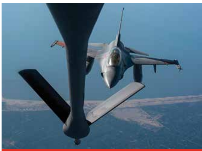
Египетский истребитель F-16 Fighting Falcon приближается к самолету ВВС США KC-135 Stratotanker для дозаправки над северным Египтом.

участие в учениях «Яркая звезда», и они имели значительный и долговременный эффект, который я продолжаю использовать по сей день».