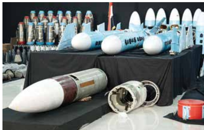
Йеменские военные демонстрируют часть из 750 тонн боеприпасов, конфискованных на захваченных судах, которые, вероятно, были отправлены Ираном для вооружения террористов-хуситов.

совет и правительство Йемена наметили четкий путь повышения безопасности на море, включая восстановление и развитие Службы береговой охраны, чтобы она могла противостоять этим угрозам, укрепление сотрудничества с международными партнерами для обеспечения лучшей координации и поддержку национальной экономики путем защиты жизненно важных морских путей.