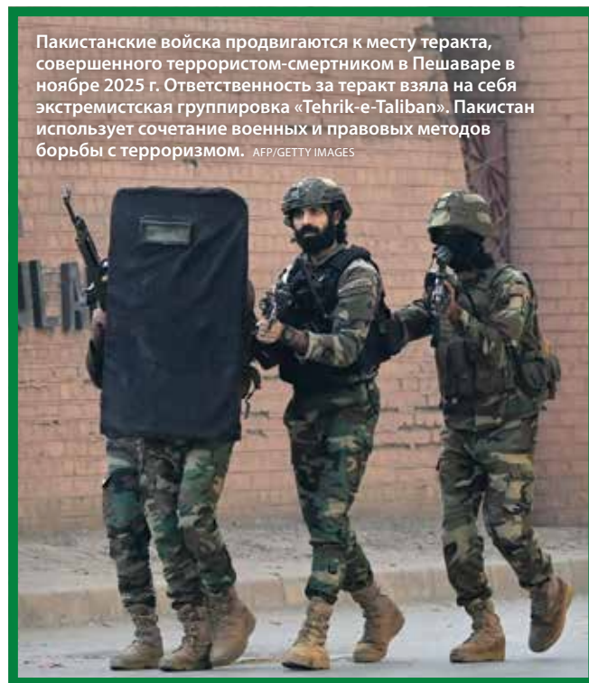
Пакистанские войска продвигаются к месту теракта, совершенного террористом-смертником в Пешаваре в ноябре 2025 г. Ответственность за теракт взяла на себя экстремистская группировка «Tehrik-e-Taliban». Пакистан использует сочетание военных и правовых методов борьбы с терроризмом.

Мы также видим, что простое военное противостояние — с неорганизованными силами, слабыми спецслужбами и отсутствием поддержки со стороны общества — обычно не приводит к уничтожению террористических группировок.