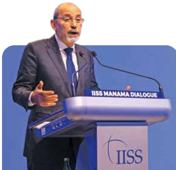
Министр иностранных дел Иордании Айман Сафади делится взглядами своей страны на мир и примирение на Ближнем Востоке.

Хотелось бы надеяться, что, пока делами в Газе будет управлять палестинская комиссия, международные