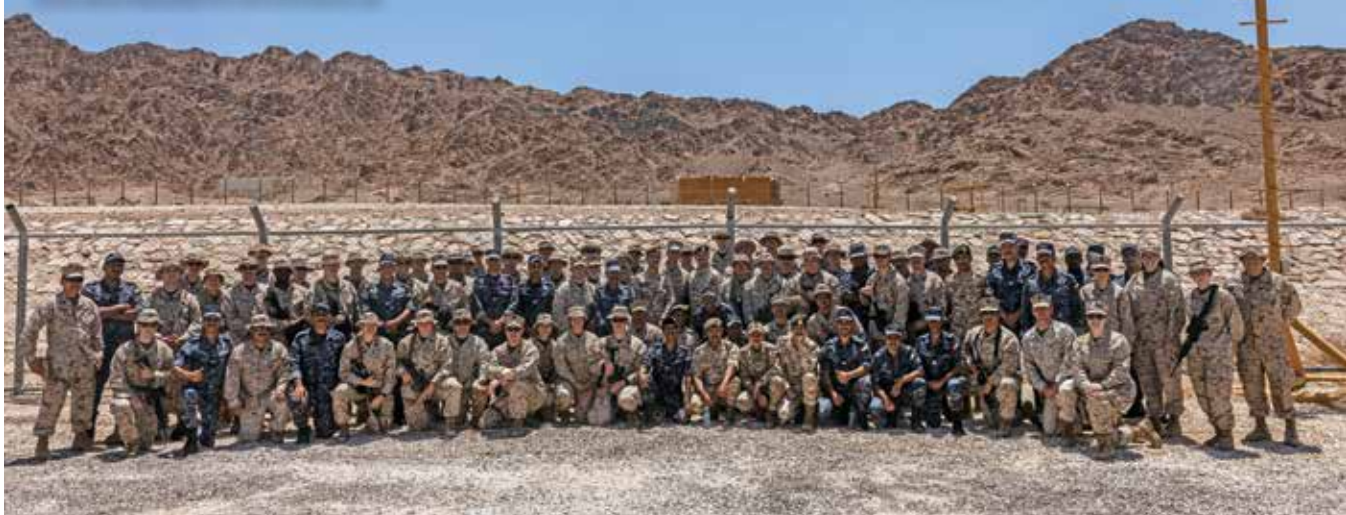
Иорданские морские пехотинцы из 77-го батальона морской пехоты позируют с морскими пехотинцами и моряками США.

В 2024 г. в Саудовской Аравии и Объединенных Арабских Эмиратах прошли учения «Native Fury», в ходе которых военная колонна пересекла Аравийский полуостров по шоссе от порта Янбу на Красном море до Арабского залива. В учениях «Native Fury 25» Акаба служила пунктом въезда. ♦