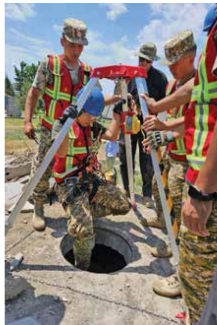
Кыргызские военнослужащие проходят обучение с летчиками и пехотинцами ВВС Центрального командования США, авиа и сухопутных войск Национальной гвардии Монтаны в ходе учений «Ак-Шумкар».