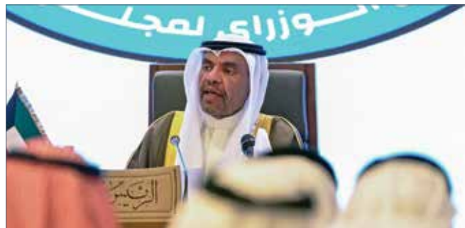
Министр иностранных дел Кувейта Абдулла Али аль-Яхья выступает на встрече министров иностранных дел стран Совета сотрудничества арабских государств Арабского залива в Эль-Кувейте в июне 2025 г.

На встрече в апреле 2025 г. министр иностранных дел Кувейта Аль-Яхья подчеркнул важность консультаций и координации в решении общих проблем, особенно в борьбе с терроризмом, киберугрозами и финансированием экстремистских группировок. Он также высоко оценил усилия Секретариата Совета сотрудничества арабских государств Арабского залива по разработке механизмов совместных действий, отметив, что безопасность и стабильность остаются главными условиями сотрудничества между регионами.