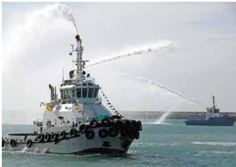
Иракские суда принимают участие в церемонии открытия порта Гранд-Фау в ноябре 2024 г. Этот порт один из крупнейших на Ближнем Востоке.

Генерал-полковник Аль-Ваэли: Многие наши сотрудники были направлены на курсы в Ираке и за его пределами для повышения квалификации и уровня готовности. Мы проходим курсы в США, на Кипре и в других арабских странах. Мы считаем, что добиться прогресса можно только путем развития профессиональных навыков.