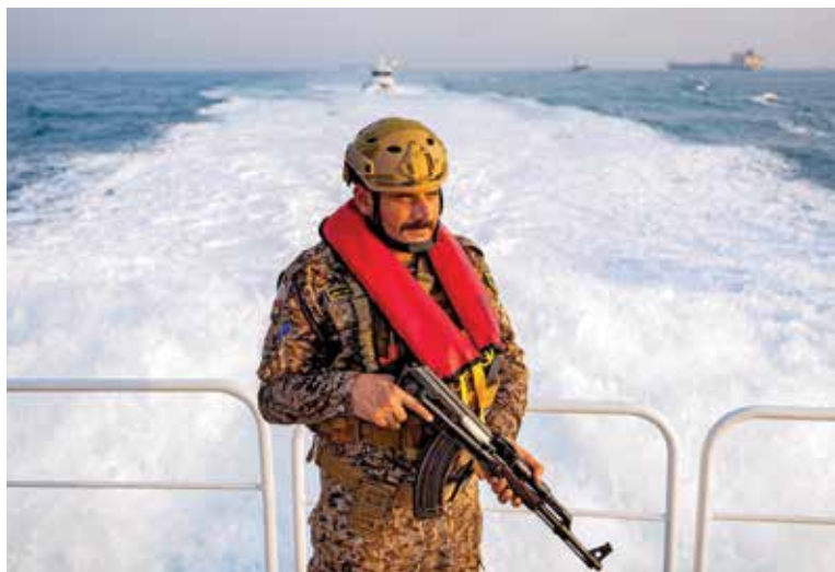
Военнослужащий военно-морских сил Ирака несет дежурство на патрульном катере в Арабском заливе.