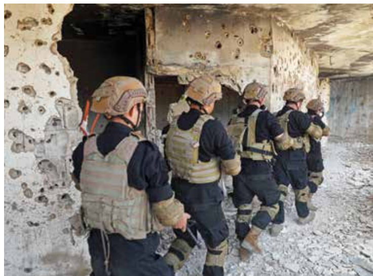
Ливанские спецназовцы атакуют смоделированное убежище террористов на побережье.