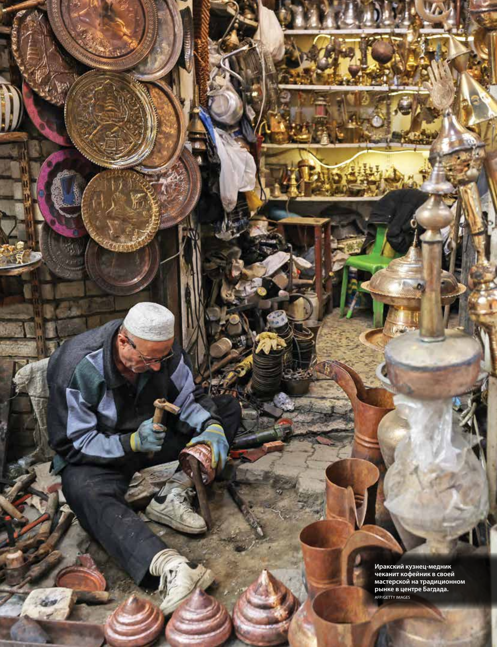
Иракский кузнец-медник чеканит кофейник в своей мастерской на традиционном рынке в центре Багдада.