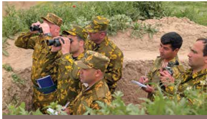
Офицеры Пограничных войск Таджикистана повышают квалификацию во время полевых тактических курсов по наращиванию потенциала в Пяндже, Хатлонская область, Таджикистан. Март 2025 г. ОБСЕ

В дополнение к передовым технологиям, финансируемый ЕС проект также предусматривает специализированную подготовку сотрудников пограничной службы. В 2009 г. ОБСЕ основала Колледж персонала пограничного управления (BMSC) в Душанбе «для повышения уровня знаний старших должностных лиц по охране границ и управлению ими, способствуя при этом расширению сотрудничества и обмена информацией».