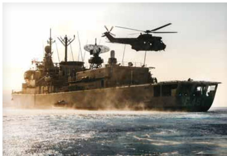
Боец спускается с вертолета во время учений в Средиземном море, отрабатывая посещение, поднятие на борт, обыск и конфискацию судов.