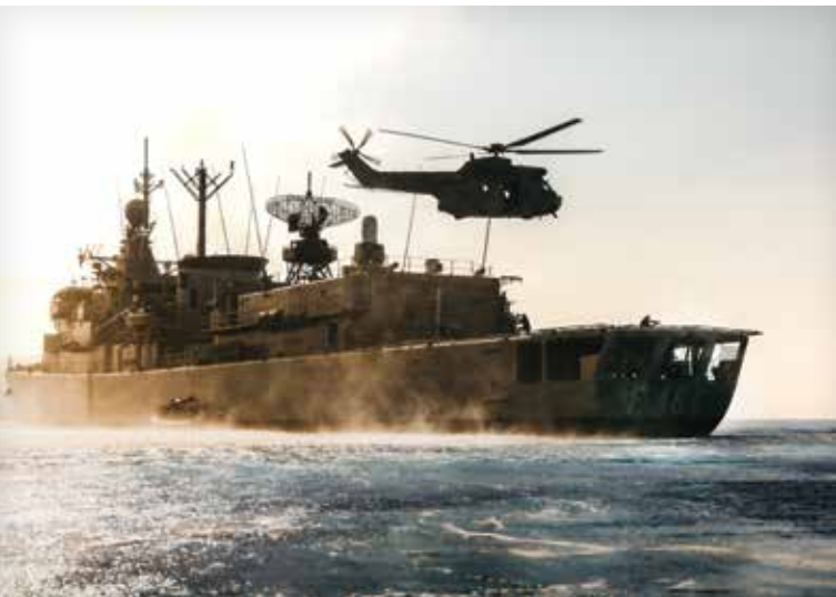
سه‌ربازنک له میانی مانۆپک‌ی په‌لاماردان، سواریوون، گه‌ران و ده‌ستبه‌سه‌رداگرندا له ده‌ریای ناوه‌راست له هیلکۆپتەرک دادبه‌زێته خواره‌وه.