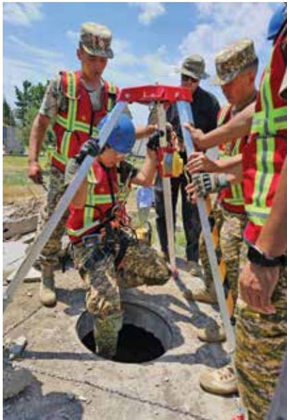
سه رازانی قرغستان له گه ل فرۆکه وان و سه رازانی نوه نډی هیژه ئاسمانیه کانی ئەمریکا و سوپای مۆنتانا و پاسه وانی نیشتمانی ئاسمانی مۆنتانا له میان ئاک شومکاردا مهشقی دهکات. فرماندهی هیژه ئاسمانیه کانی ئەمریکا

پاڤردوودا له چوارچێوه په کی کاری فرهنه ته وهی له گه ل هیژه سه رازانیه کانی دیکه ئاسیای ناوه راسه و باشووری ئاسیا، وهک به شیک له زنجیره مهشقیه کانی هه ماهه نگیی ناوچه یی فه رمانده یی ناوه نډی ئەمریکا، پیکه وه مهشقیان ئەنجامداوه.