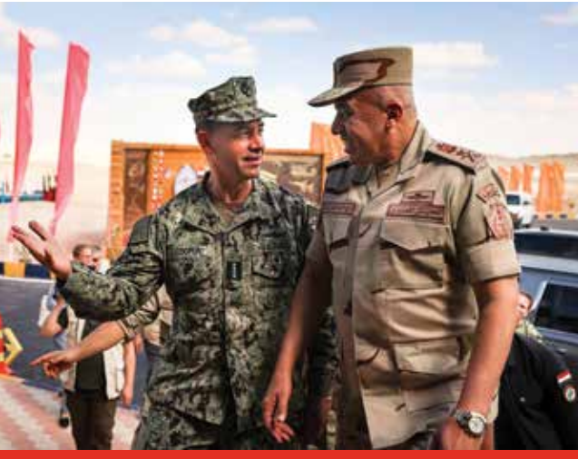
فهریقی یه که می هیژی دریاپی ئه مریکا براد کوپهر، چهپ، فرماندهی فرماندهی ناوهندی ئه مریکا و فهریق ئه حمهد فنهخی خه لیفه، سه روک ئه رکانی گشتی هیزه چه کاره کانی میسر، له چالاکیه کی به کراوی ته قه کردنی راسته و خووی چهک له ئه ستیره ی گهش ناماده ده بن.

هیزه کانی ئۆپه راسیۆنی تایهت له ئه ستیره ی گهش له پرگارکردنی بارمه کان له هیرشی ده ستورده وه تا ده گاته خسته خواره وه ی فرۆکه ی بی فرۆکه وانی بی تهل (UAV) به مووشهک، مه شقی پیشکه و توویان وه رگرت. به هه مان شیوه هیزه کانی ئۆپه راسیۆنی تایهت باز داتیکی نمایشیان به سه ر هه رمه کانی جیزه دا پیکه خست. ئه وان به شیک بوون له نزیکه ی ئه و 90 سه ربازه ی که دابه زینه که یان ئه نجامدا. به شیکی زوریان له کاتی دابه زینیان به په ره شوت بۆ شوینه واره به ناوبانگه کان ئالای نیشتمانی خۆیان هه ئدا. موقه ده م وه لید ئه بو ئه لغه نام، ئه فسه ری به رپرسی 50 سه ربازی هیزی ئۆپه راسیۆنی تایهتی ئه رده ن له ئه ستیره ی گهش، تیشکی خسته سه ر ده رفه تی مه شقکردن له گه ل هاوبه شه کانی وه ک ئه مریکا.