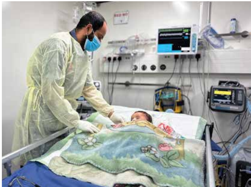
ئىمارات لە ساڵى 2025 لە ميانى ئۆپەراسیۆنى 'سوارچاکی جوامیتری 3' لە غەزە، ھاوکارپى مەرۆپى پىشکەش دەدات.

جوامیتری 2 ی ئەنجامدا، کە پشتیوانی بۆ رزگاربووانى بوومەلەرزە دەبێنکرد، ھاوکارى ھەولەکانى پراھینانەوھى کرد و چارەسەرى 13,500 بریندارى کرد. بە ھەمان شێوە ئىمارات لە رێگەى پرڤىكى ئاسمانى کە لە 260 گەشتى ئاسمانى پىکھاتبوو، 15,200 تەن ھاوکارى مەرۆپى گەياندا، کە 6,912 تەن ھاوکارى فریاگوزارى بەپەلەى ھەلگرتبوو، لە نۆیاناندا خىمە، پىداویستى بنەرەتەى خۆراک و دەرمان. جگە لەوھش، بە بەکارھێنانى چوار کەشتى بارھەلگر بۆ گواستەنەوى کەرھستەى فریاگوزارى و ئاوەدانکردنەوھ بۆ ناوچە زيانلێکەوتووەکان، 8,252 تەن ھاوکارى مەرۆپى گەیانرا.