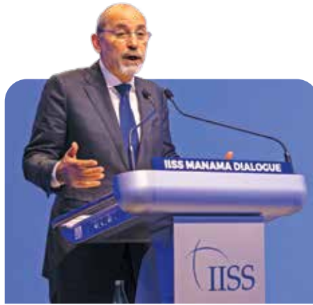
ئەيمەن سەفادىي وزيرى دەرهوى ئەردەن بۆجۈنەكانى ولتەكەسى سەبارەت بە ئاشقى و ئاشتەواپى لە پۆژھەلاتى ناوەراستدا دەخاتەپوو.

دامەزراوى ئىئودەولەتى بۇ ئۆزىنەنە ستراتېژىيەكان