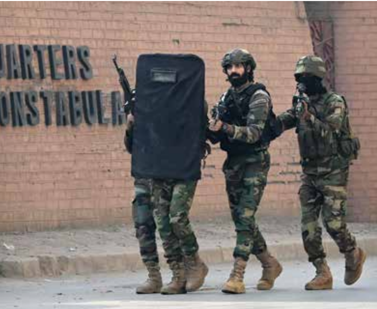
لە مانگی تشریف دووهمی 2025، سەربازانی پاکستان بەرەو شوێنی تەقینەووەپەکی خۆکوژی تیرۆریستی لە پێشاور پێشپەڕی دەکەن. گروپی توندپەروە تەحریریکی تالیبان بەرپرسیارێتی رووداوەکە لە ئەستۆ گرت. پاکستان بۆ رووبەرووبوونەووەی تیرۆر، پیکهاتەپەیک لە ستراتیژی سەربازیی و یاسایی بەکاردهێنێت.