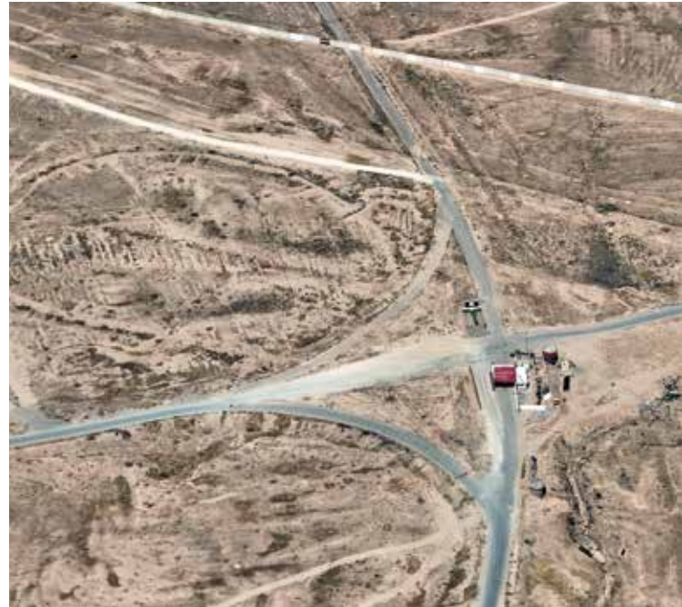
بە‌نکە‌بە‌کی ئاسایش بە‌درێ‌ژای سنووری عێ‌راق لە‌گە‌ڵ سوریا بە‌رپرسیارە‌ لە‌ بە‌رە‌نگاروونە‌وێ‌ی بازرگانیکردن بە‌ چە‌ک، ماددە‌ی ھۆ‌شبەر و کە‌لوپە‌لی نایاسایی تر.

فە‌ریق ئە‌ل وائلی: ئە‌و 2,649 کارمە‌ندە‌ی کە‌ ئاماژە‌م پێ‌دا، کۆ‌ی ژمارە‌ی ئە‌و کە‌سە‌ مە‌دە‌نی و سە‌ربازیانە‌ن کە‌ بە‌ کۆ‌مپ‌سیۆ‌نی بە‌ندەرە‌ سنوورییە‌کانە‌ووە‌ پە‌یو‌ه‌ستە‌ن. سە‌بەرە‌ت بە‌و کارمە‌ندانە‌ی کە‌ سەر بە‌ دە‌زگاکانی ترن، لە‌ رۆ‌وی کارگێ‌ری، تە‌کنیکی و ئۆ‌پە‌راسیۆ‌نییە‌و بە‌ کۆ‌مپ‌سیۆ‌نە‌کە‌ووە‌ پە‌یو‌ه‌ستە‌ن.