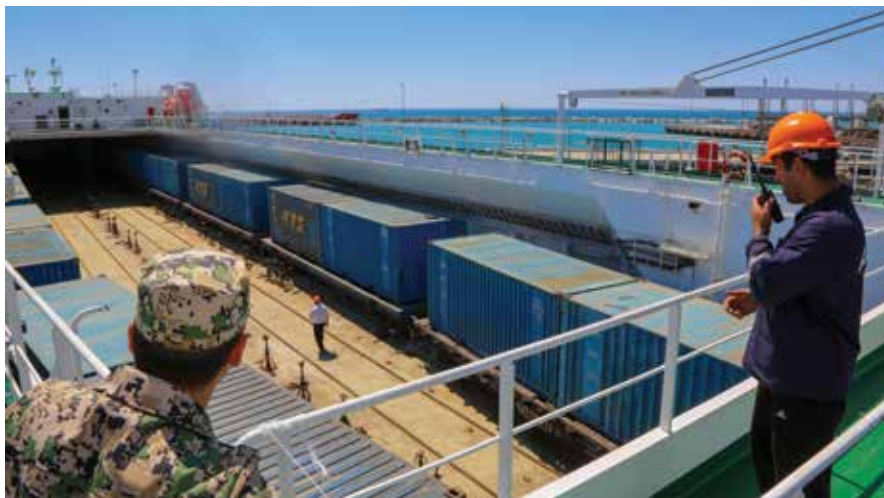
بەندەری ئاكتاوا لە دەريای قەزوین، كازاخستان، هەولەدات بەدرئزایی پنگا بازرگانیه نوێیه كان كه ناسیای ناوهراست بە بازاره ئۆدەولەتییه كانەوه دەبەستیتەوه، بێت بە ناوهندیكى گرنك.

جگه له وهش، ولاتانی ئەنجومهنی هاوکاریی کەنداو (GCC) نامادەیی خۆیان دەربری بۆ پشتیوانیکردن لە پێگا سەرەکییەکانی گواستەوه، لەوانە هێلی ئاسنی چین، قەرغستان و ئۆزبەکستان و هێلی ئاسنی ئۆزبەکستان، ئەفغانستان و پاکستان. ئەم پرۆژانە دەبنە هۆی باشتکردنی دەستپراگەیشینی ئاسیای ناوهراست بۆ بازاره جیهانییهکان.