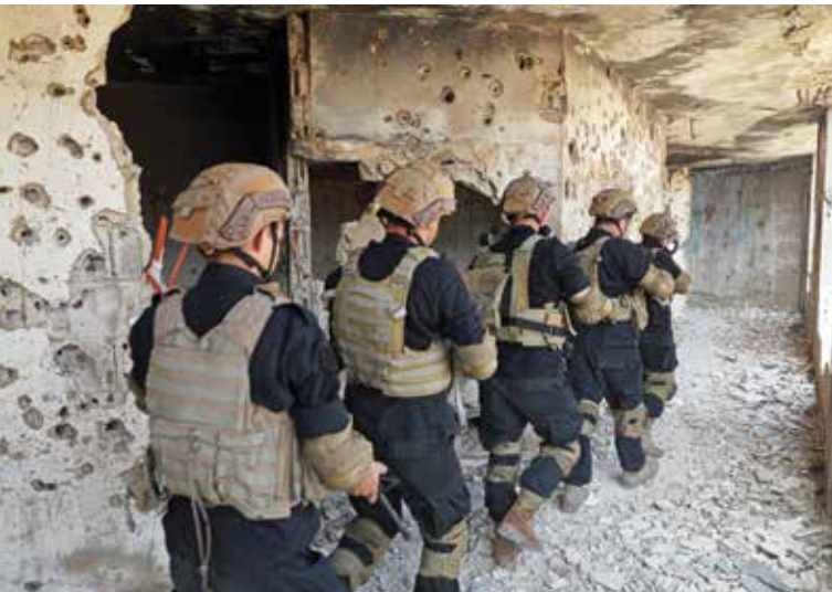
سه‌بازانی کۆماندۆی لوونان هه‌لیانکوتابه‌ی سه‌ر سه‌شارگه‌به‌کی خه‌بالی تیرۆرستان له که‌ناراهه‌کان.