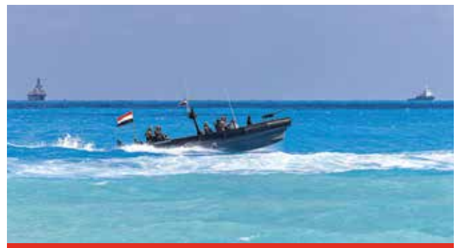
بەلەمکی پاسەوانی میسر بە پشتیوانی ھێزە دەریایەکان لە دەریاوہ یارمەتی ئەنجامدانی ھێرشێکی زەمینی و ئاوی دەدات.

”ئەم سەربازانە و ھەموو ئەم ئەفسەرانە ی دەستە لەسەر بنەمای ھاتن بۆ ئەستێرە گەش و بوون بە بەشیک لەم مەشقە مەزنە کە ھەر دوو سال جارێک ئەنجامی دەدەین، دەگەرێتەوہ بۆ سوپای خۆیان و کۆمەلێک کارامە یی باشتەر لە گەل خۆیان دەبەنەوہ.” فەریق فرانک رایگە یاند. ♦