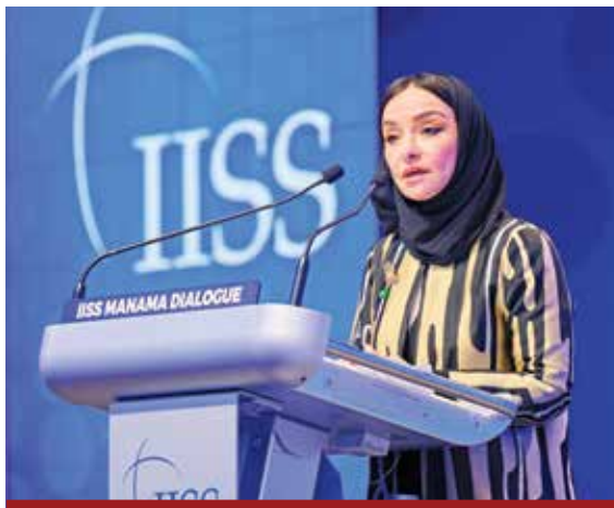
د. مهال په زوانی سعودی له کونفرانسی ئاسایشی گفتوگویی مهنامه ی سالی 2025 له به حره ین قسه ده کات. دامه زراوه ی ټیوده ولتی، بو توژپنه وه سه راتیزیه کان

ټه م جوړه توندوتیژی سه نوو ردار نییه. تا ټو کاته ی پارټیزبه ندی له جیکه ی لپرسینه وه دا بیت، نادادپه روه ری په رده ده ستینیت و توندپه و بوون پشه ده کیشیت. چه ند باسی ناشتی بکه یت، چاره سه ری ټه مه ناکات. هه یچ پرتوه یه که له چاکسازی له په پروه ی په روه رده ییدا چاره سه ری ټه مه ناکات. توندوتیژی و بیایه خکردنی ژانی مروف نه که نه نا ئاسایش به رقه رار ناکات، به لکو ململانی بیکو تایی دینیته کایه وه. له ناو دوخی ناومیدی دوو سالې رابدوو، به سه رکردایه تی سه روکی ټه مریکا دونا لد تره مپ و به دیپلوماسییه کی چالاکانه ی ناوچه یی که له لایه ن شانشینی سعودیه، ده ولتانی قه تهر، میسر و تورکیا وه سه روکیا ته تی ده کرا، له سه ر