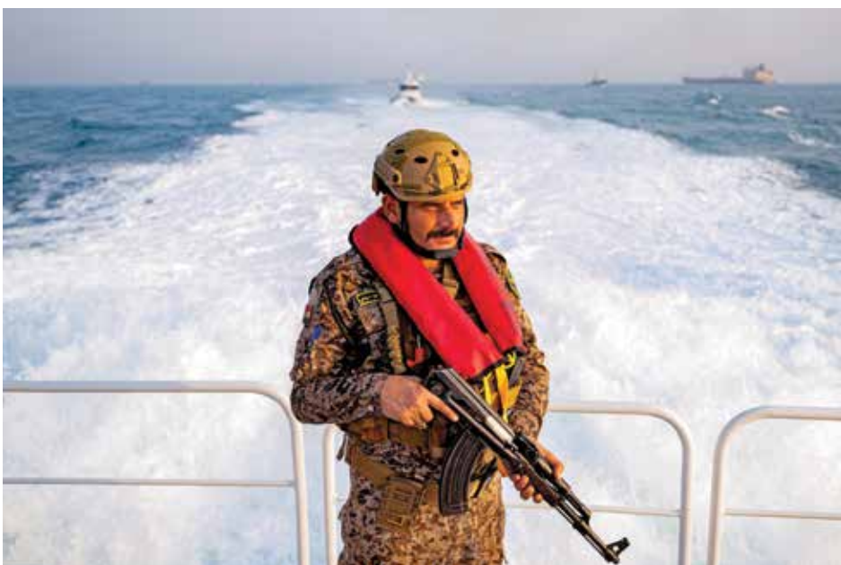
ئەندامێکی هێزی دەریایی عێراق لەسەر بەلەمیکی پاسەوانی پارێزگاری لە کەنداوی عەرەبی دەکات.

"شەرکە شەش رۆژی خایاند و لە رۆژی شەشەمدا خالید ستراتیژی خۆی لە بەرگریکردنەوه گۆری بۆ هێرشبردن. بە زبیرەکییە لەپارە بەدەرەکەیی توانی