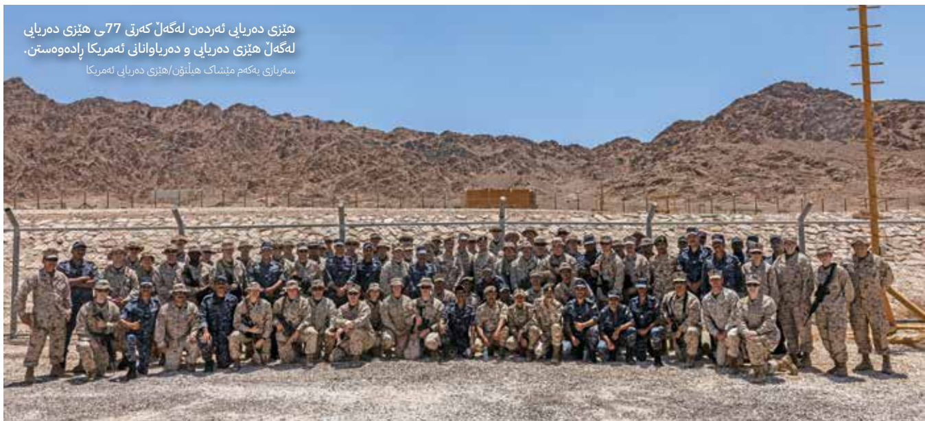
ھىزى دەريايى ئەردەن لەگەل كەرتى 77 ھىزى دەريايى لەگەل ھىزى دەريايى و دەرياوانى ئەمىرىكا پادەوھەستن. سەربازى يەكەم مېشاك ھىلۆن/ھىزى دەريايى ئەمىرىكا

لە سالى 2024دا، تورەيى رەسەن لە سەودىيە و ئىمپارات بەرپۆھە چوو و كواستەنەو ھەتوانانكى سەربازى بە پزىگاي خىرا لە بەندەرى يەنوبى سەر دەريايى سەورەو ھەتوانانج بە ھەتوانانج دەورگەى عەرەبىدا بەدواى خۆيدا ھىتا. لە تورەيى رەسەنى 25دا، عەقەبە ھەك بەندەرى چوونە ژوورەو ھەتوانانج بەكەن.