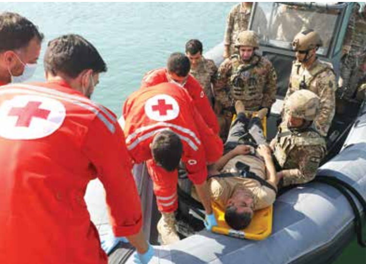
هیزه‌کانی لوونان له یه‌کیتیبی یه‌کلاکه‌ره‌وه‌ی 26 چالاک‌ی چۆل‌کردنی پزشکی ته‌نجام ده‌ده‌ن.