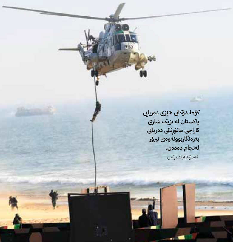
كۆماندۇكانى ھىزى دەريابى پاكستان لە نىزىك شارى كاراچى مانۇپكى دەريابى بەرەنگاربوۋنەۋەى تېرۋر ئەنجام دەدەن.

لە كاتىكدا كە دەكرېت پېشلىگىرتن كەموكۆپى ھەبېت، ھەندىك لە تويۇزەران دەلېن كە كاتىك دېتە سەر باسى كوشتنى سەركردە سەرەكېيەكانى رېكخراۋە تېرۋىستىيەكان، ئەۋا سەرەكەۋنەكانى رېشويىنى پېشلىگىرتن زۆر ئاشناترن. پىرسىكى دېكەى رېشويىنى پېشۋەختە برىيە لە ۋەۋايتىدان و پەھەندە ئاكارىيەكان. لە كاتىكدا كە دەكرېت ئەنجامدانى ئۆپەراسىۋىنى پېشلىگىرتنى بەرەنگاربوۋنەۋەى تېرۋر لەسەر بنەماى زانىبارى ھەۋالگىرى كە گروپە ديارىكراۋەكان بە ھېرشە