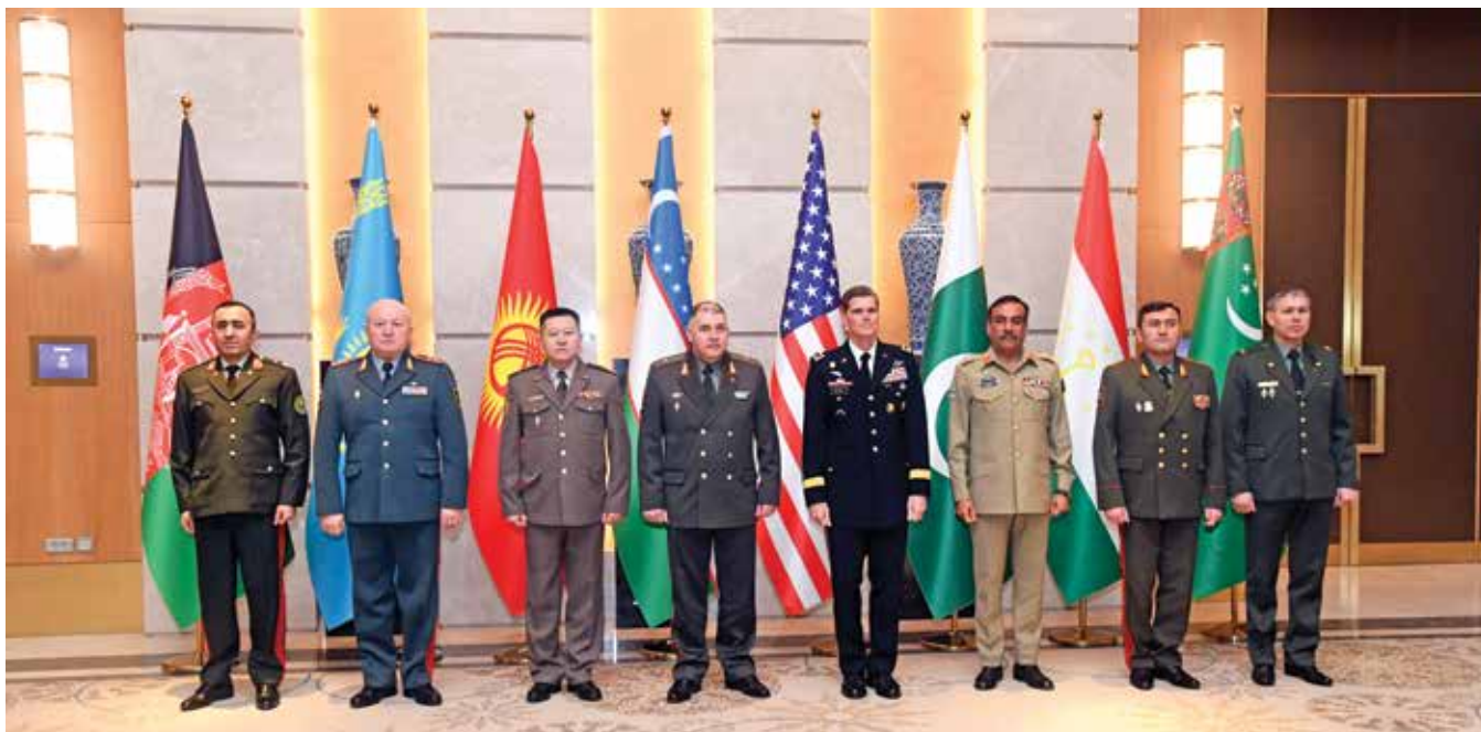
مدیران ارشد نظامی در نشست سران دفاعی آسیای میانه/جنوبی اشتراک کردند. قومندانی مرکزی ایالات متحده

سران دفاعی از فرصت این نشست برای بازدید از «آکادمی قوای مسلح ازبکستان» و نظارت بر روند تعلیم محصلین و صاحب منصبان استفاده کردند. ایجاد روابط بین آکادمی های نظامی منطقه جزو موضوعات مورد بحث بود. ♦