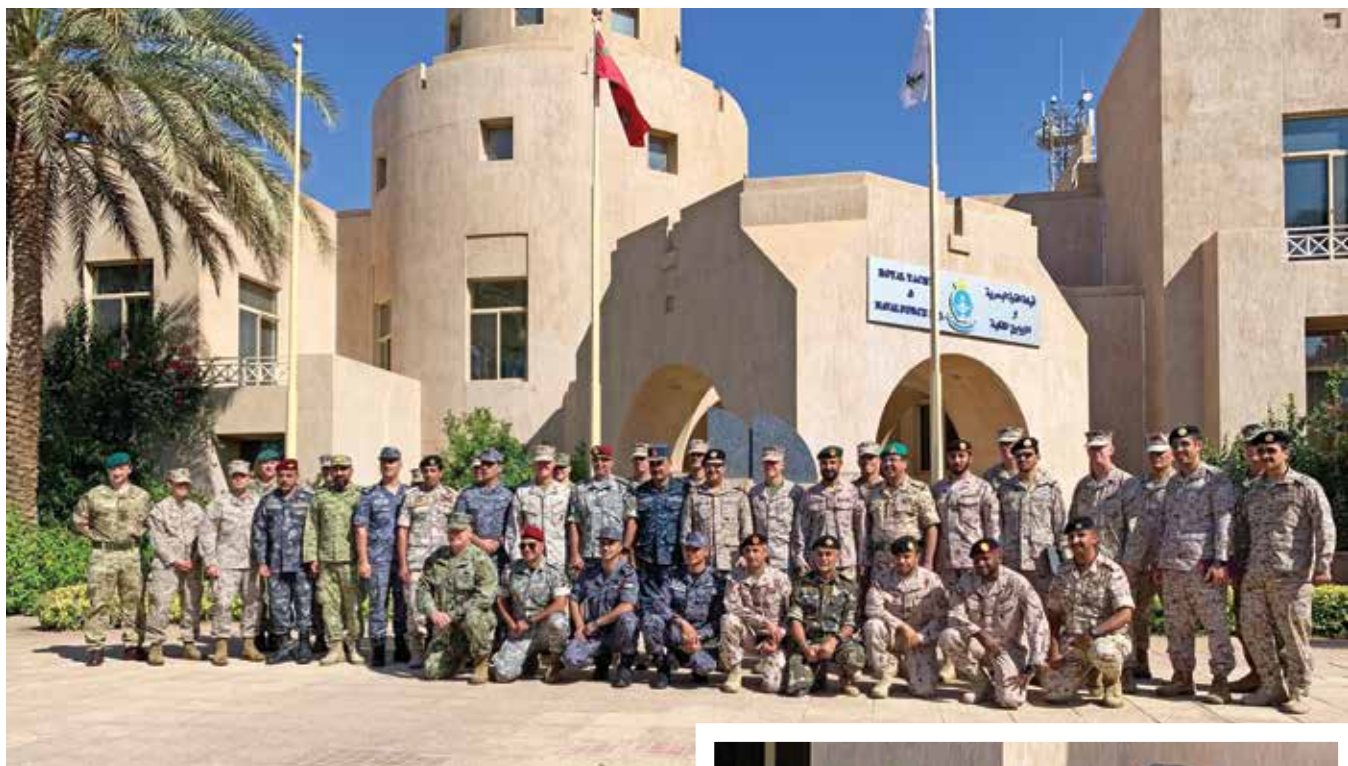
اشتراک‌کنندگان کنفرانس قومندانان زمینی و بحری خاورمیانه سال 2019 برای گرفتن عکس در مقابل مقر قوای بحری سلطنتی اردن در عقبه اردن، مقابل کمره قرار می‌گیرند. کارکنان یونیهات