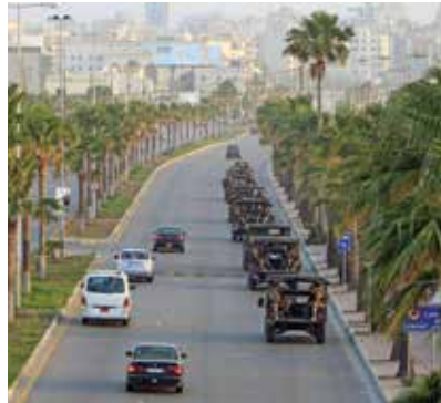
گزمه عساکر لبنانی در شهر صیدا در آستانه انتخابات پارلمانی در می 2018.

بطورمثال، حمایت بین‌المللی به لبنان کمک کرده است تا از سرحدات زمینی و بحری خود محافظت کند. ایالات متحده، بریتانیا و دیگر کشورهای همکار حامی طرح محافظت از سرحدات زمینی لبنان هستند و جرمنی از طرح