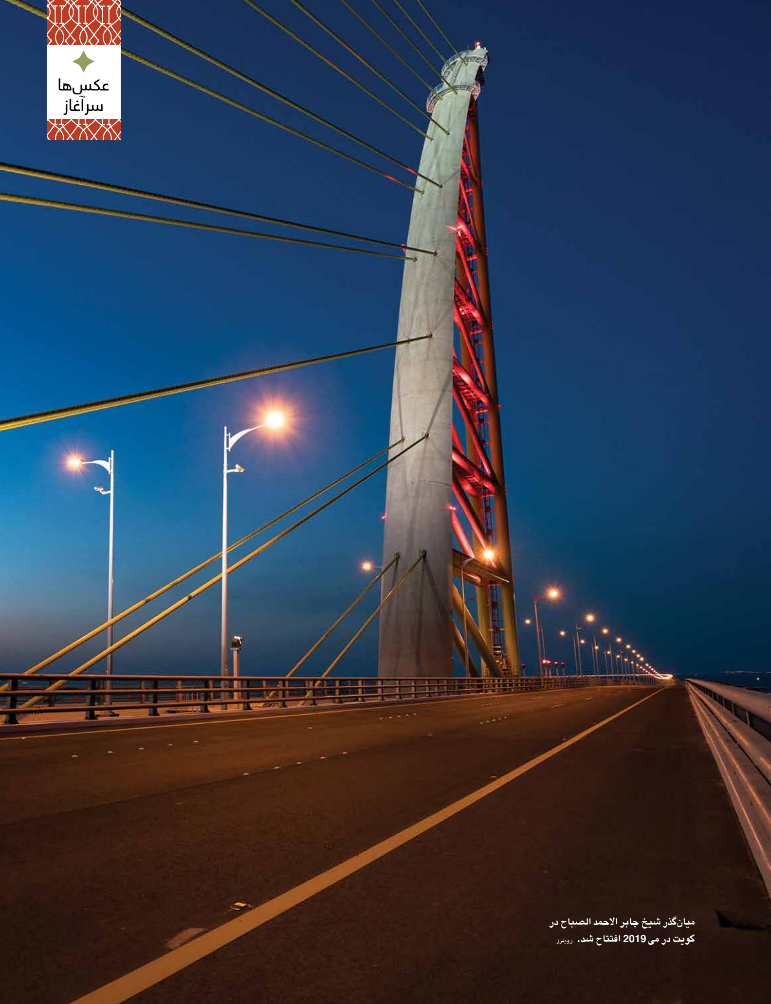
میانگذر شیخ جابر الاحمد الصباح در کویت در می 2019 افتتاح شد. روبرز