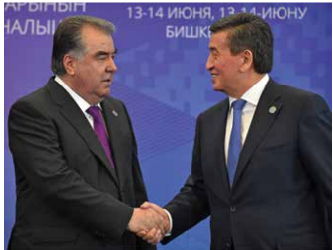
امامعلی رحمان، رئیس‌جمهوری تاجیکستان (چپ) در جلسه سران منطقه در جون 2019 در کنار سورونبای جینبکف، رئیس‌جمهوری قرغزستان.

تاجیکستان برای مبارزه با نمودهای افراط‌گرایی و بنیادگرایی مذهبی در جامعه به کمک جامعه جهانی ضرورت دارد. بدون تجربه کافی، امکان مبارزه با این نمودها را نخواهیم داشت. در جامعه ما، مردم به تدریج به این باور رسیده‌اند که مبارزه با این تهدیدات مستلزم استفاده از روش‌ها و ابزارهای دیگر است. برای مقابله با این پدیده‌ها پرداختن به اقدامات پیشگیرانه ضروری است. همچنان، به نظر من، ایجاد مراکز تخصصی برای کمک‌رسانی به قربانیان