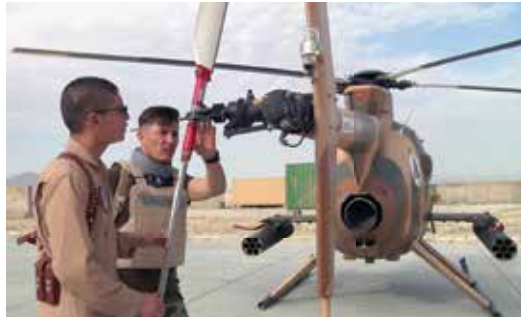
پیلوت‌های افغان در حال بازرسی هلیکوپتر MD530 در میدان‌هوایی مزارشریف. تالی

محیط امنیتی پویای افغانستان نیازمند قوای امنیتی قدرتمندی است که بتواند از تصاحب نواحی زمینی ذریعه دشمن و تهدید ثبات کشور جلوگیری کند. در این راستا، قوای دفاعی و امنیتی ملی افغانستان باید بدون وابستگی به کمک‌های خارجی با تکنیک‌های جنگی مدرن همگام شود.