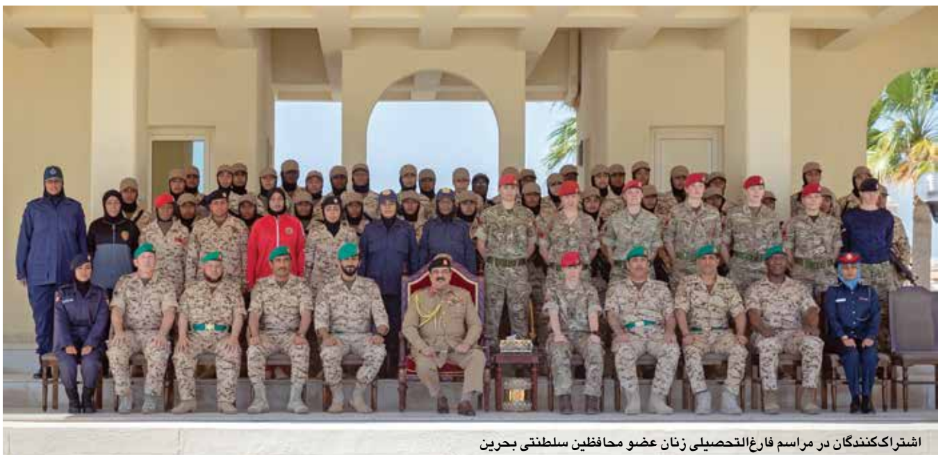
اشتراک‌کنندگان در مراسم فارغ‌التحصیلی زنان عضو محافظین سلطنتی بحرین

از آنجا که طبق سنت عربی و اسلامی مردان اجازه تلاشی بدنی زنان را ندارند، تروریست‌ها گاهی خود را در لباس زنانه پنهان می‌کنند و از زنان برای قاچاق سلاح و مواد انفجاری استفاده می‌کنند. نقش زنان در مقابله با این شگردهای