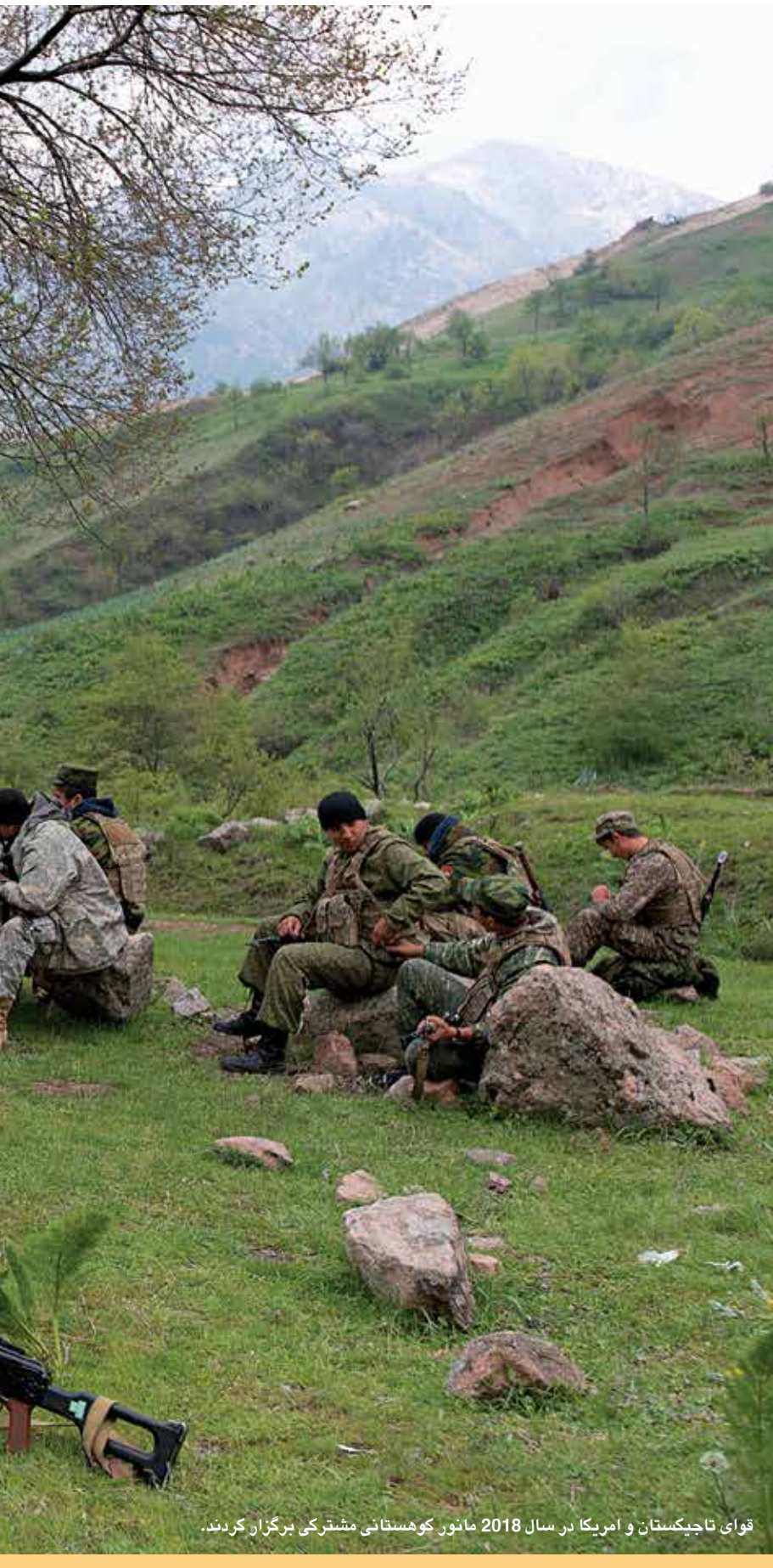
قوای تاجیکستان و آمریکا در سال 2018 مانور کوهستانی مشترکی برگزار کردند.

کرده است. دولت تاجیکستان همچنان رهنمای اطلاع‌رسانی رایگانی به نام «اسلام علیه ترور» منتشر کرده است که بر نظریات انسانی قرآن و ناسازگاری اصول اسلام با تروریسم تأکید دارد. در جنوری 2019، تاجیکستان اعلان کرد که قانون مبارزه با افراط‌گرایی را ظرف سه ماه به‌روز خواهد کرد. رئیس‌جمهور، امامعلی رحمان، خواستار تصویب قانون جدیدی برای جلوگیری از ورود اتباع تاجیکستان به سازمان‌های تروریستی و افراط‌گرا و بازگرداندن اشخاص پیوسته به گروه‌های بنیادگرا در خارج از کشور، شد. رئیس‌جمهور رحمان از قوای مسلح این کشور درخواست کرد که آمادگی نظامی پیوسته خود را برای مقابله با پیامدهای احتمالی مشکلات امنیتی در سرحدات این کشور با افغانستان حفظ کنند. به راپور دفتر لوی سارنوالی، این قانون برگرفته از آخرین پیمان‌های حقوقی بین‌المللی، بشمول قطعنامه‌های شورای امنیت سازمان ملل و دیگر سازمان‌ها خواهد بود.