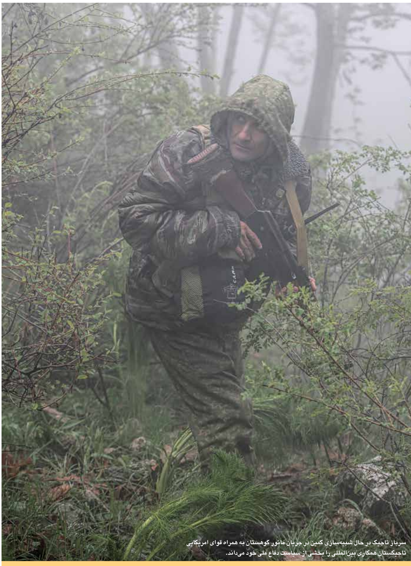
سرباز تاجیک در حال شبیه‌سازی کمین در جریان مانور کوهستان به همراه قوای امریکایی تاجیکستان همکاری بین‌المللی را بخشی از سیاست دفاع ملی خود می‌داند.