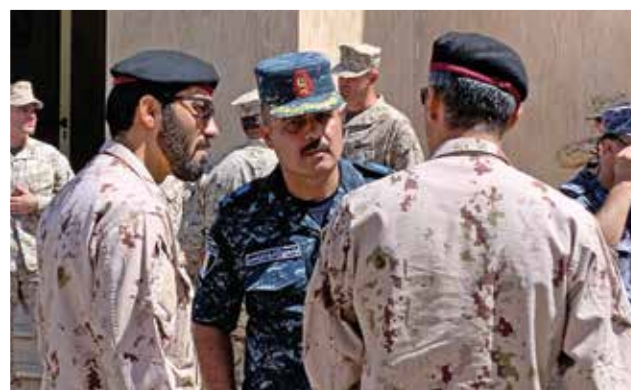
تورن‌جنرال زکریا، تورن‌جنرال قوای بحری مصر، با دو قومندان امارات متحده عربی در جریان کنفرانس قومندانان زمینی و بحری خاورمیانه سال 2019، گفتگو می‌کند. کارکنان یونیهات

می‌توان از طریق تبادل معلومات استخباراتی بین متحدان، بر آن غلبه کرد. داشتن یک مرکز تبادل معلومات باعث انجام مأموریت‌های دقیق و موفق می‌شود.» برید جنرال محمد مصطفی، قومندان غوند کومندوی بحری لبنان، از اشتراک‌کنندگان خواست تا برای یافتن نشانه‌ها و سرنخ‌های حملات آینده، در مورد حملات تروریستی قبلی تحقیق کنند. از آنجا که لبنان تصمیم دارد تا یک ترمینال کلان نفتی را در دریای مدیترانه احداث کند، ضرورت به امنیت بحری در این کشور افزایش یافته است.