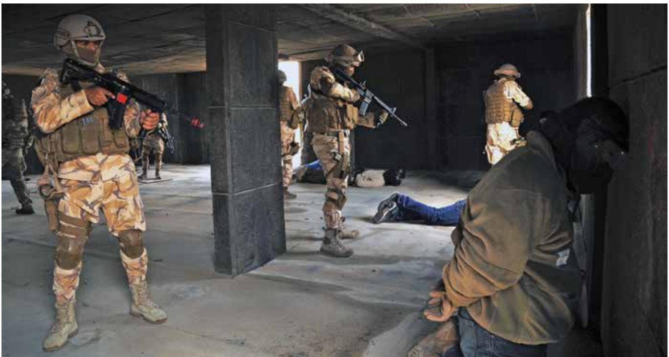
قوای قطری و امریکایی در حال شبیه‌سازی عملیات توقیف تروریست‌ها