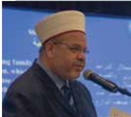
برید جنرال داکتر مجید دراوشه در حال سخنرانی در نشست.