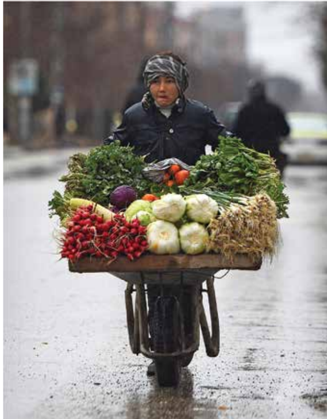
یک بچه افغان در حال گشتاندن یک کراچی دستی در شهر مزار شریف کارشناسان پیش‌بینی می‌کنند که افغانستان برای بازسازی اقتصاد خود همچنان نیازمند کمک‌های خارجی خواهد بود. تصاویر گنی

در صورتی که مذاکره درباره توقف جنگ با طالبان ضرورت پیدا کند، دولت افغانستان باید سیاست‌ها و استراتژی‌های اقتصادی و تجارتي خود را برای بهره‌برداری کامل از فرصت‌های جدید اقتصادی به شکل اساسی بازتعریف و سامان‌دهی کند. این روند ممکن است تحلیل‌الگوهای همکاری اقتصادی منطقوی در بخش‌های خاص را شامل شود؛ بخش‌هایی که در کوتاه‌مدت دست‌یافتنی باشد و بتواند کشورهای همسایه را تشویق به پایبندی به صلح کند. در ضمن، سیاست‌های جامع توسعه اجتماعی باید اولویت‌بندی شود؛ از این سیاست‌ها می‌توان به هم‌آمیزی اعضای طالبان، افراد بازگشتی و آوارگان داخلی در جامعه و ایجاد پروسه قضایی انتقالی برای رزمندگان سابق برای ایجاد زمینه صلح و کاهش احتمال شروع دوباره جنگ، اشاره کرد. ♦