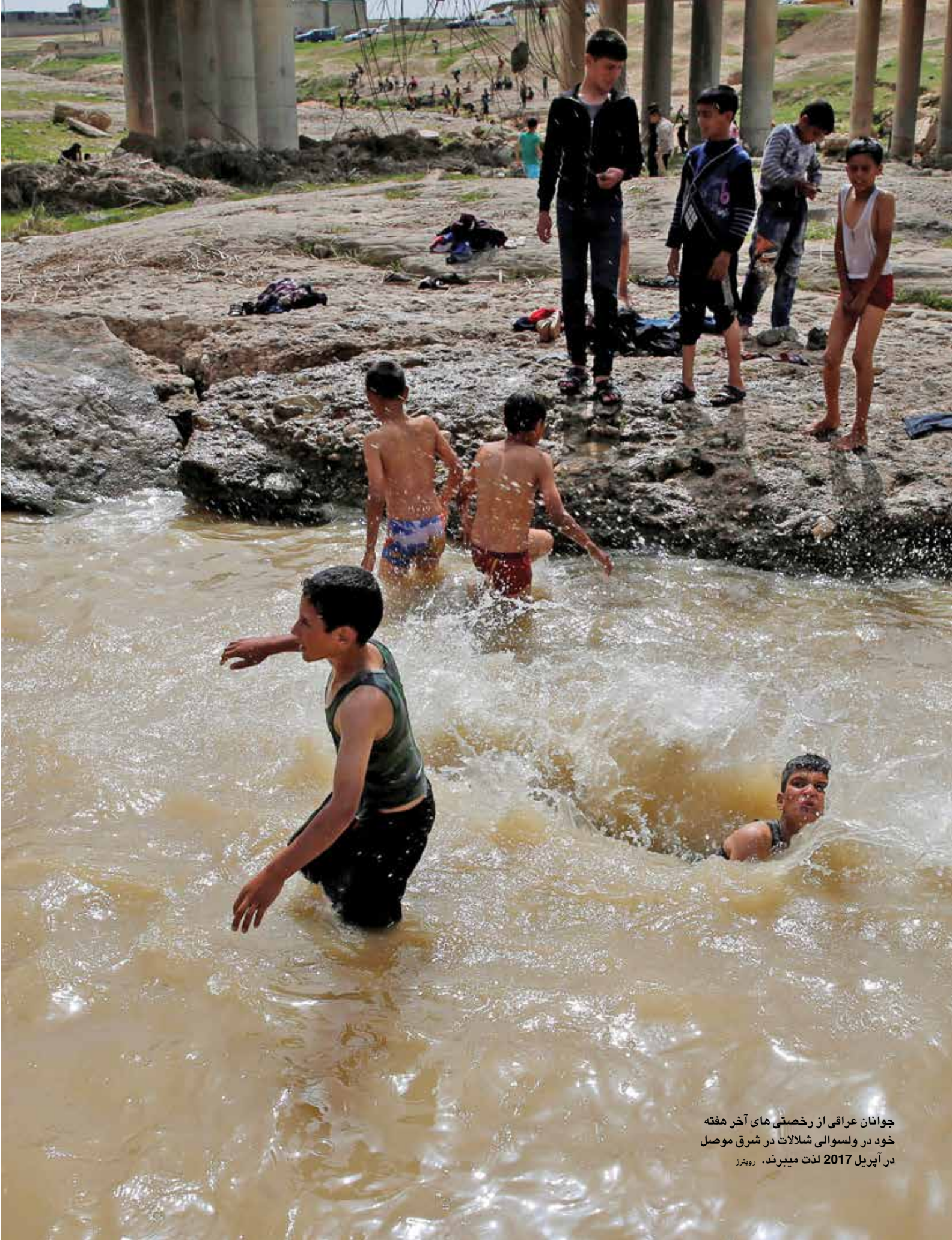
جوانان عراقی از رخصتی های آخر هفته خود در ولسوالی شلالات در شرق موصل در آپریل 2017 لذت میبرند. روبنز