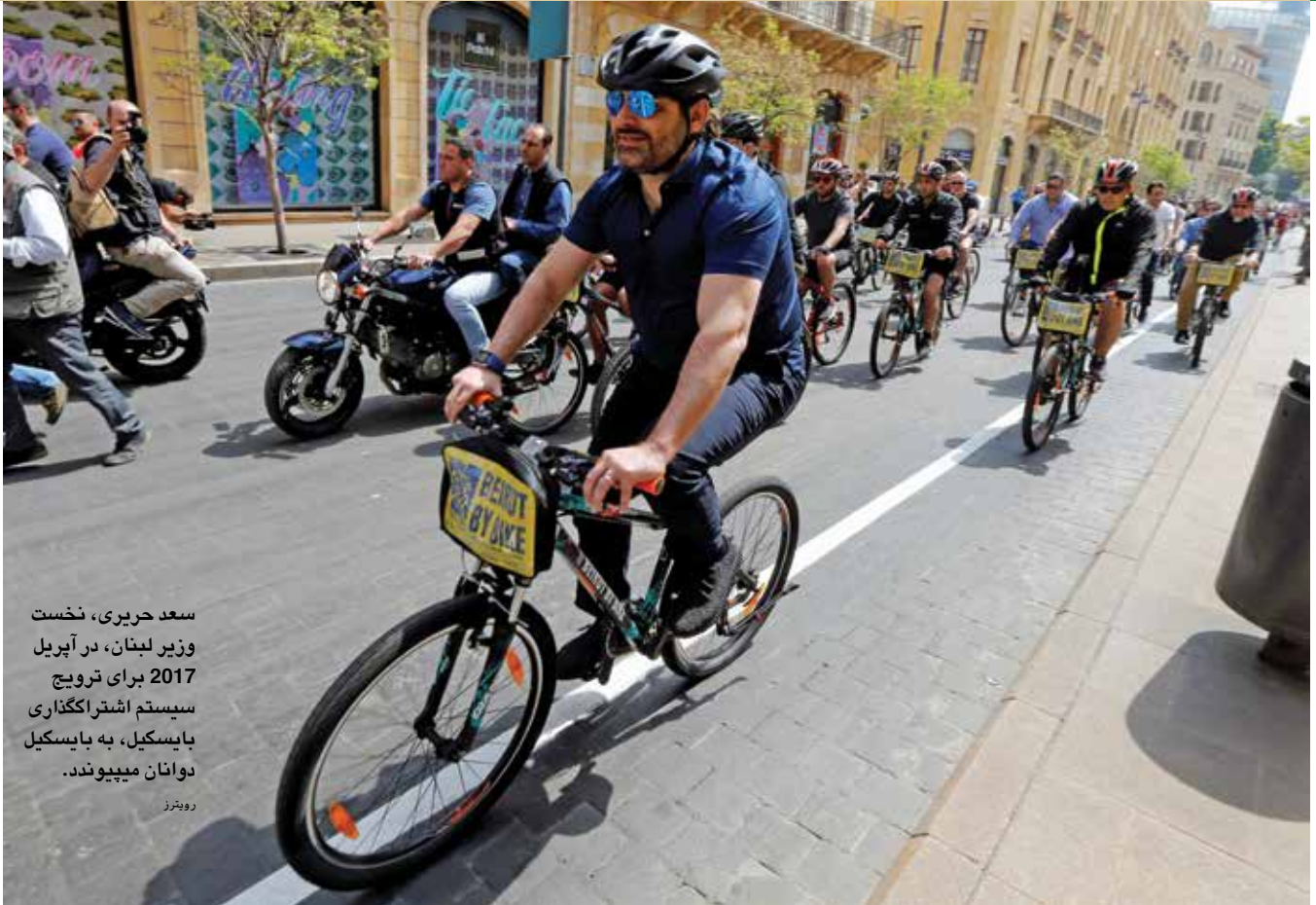
سعد حریری، نخست وزیر لبنان، در آپریل 2017 برای ترویج سیستم اشتراک گذاری بایسکیل، به بایسکیل دوانان میپیوندد.