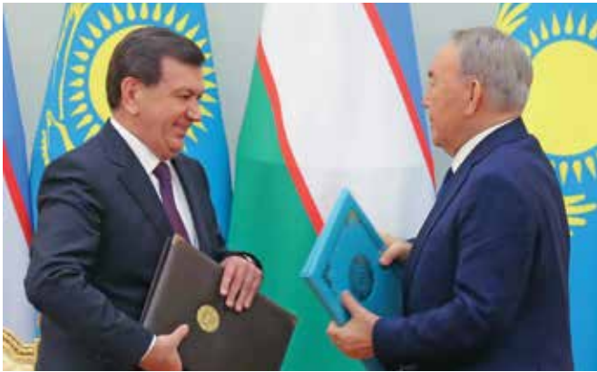
رئیس‌جمهور قزاقستان، نورسلطان نظربایف و رئیس‌جمهور ازبکستان، شوکت میرضیایف در مارچ 2017 درباره فرصت‌های مشارکت اقتصادی در آستانه با هم صحبت می‌کنند.

نظربایف مدتها است که پیش‌تاز همگرایی منطقی در آسیای مرکزی بوده