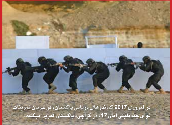
در فبروری 2017 کماندوهای دریایی پاکستان، در جریان تمرینات قوای چندملیتی امان 17، در کراچی، پاکستان تمرین میکنند.