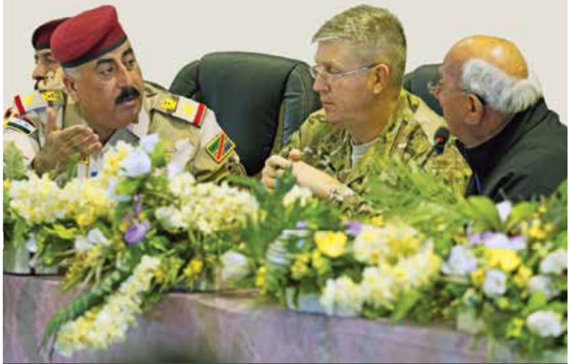
تورن جنرال ارکان اردوی عراق قاسم محمد صالح المحمدی، قومندان قومندانی عملیات جزیره، در کانفرانس رهبران الانبار در فبروری 2017 در الاسد لوجیستیک و قوای بشری منطقوی در سراسر ولایت الانبار را برای برید جنرال اردو استرالیا ادام فیندلی، قومندان سابق گروه ضربت مشترک عملیات خاص- عملیات اراده قاطع (عراق) توضیح میدهد.

مبروک حمید میهادی، شاروال حدیثه گفت چندین ناحیه تحت کنترل او از وجود داعش پاکسازی شده است. او اضافه کرد، هنوز باید کارهایی برای حفظ سرحدات این مناطق انجام شود.