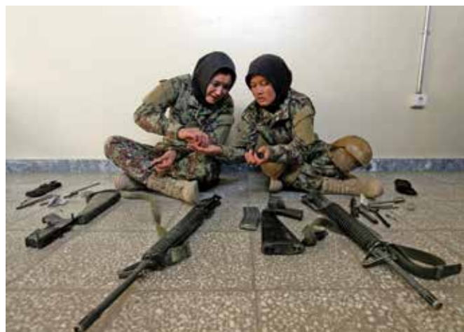
عساکر اردوی ملی افغانستان در اکتبر سال 2016 سلاح خود را در مرکز تعلیم نظامی کابل پاک کاری میکنند.