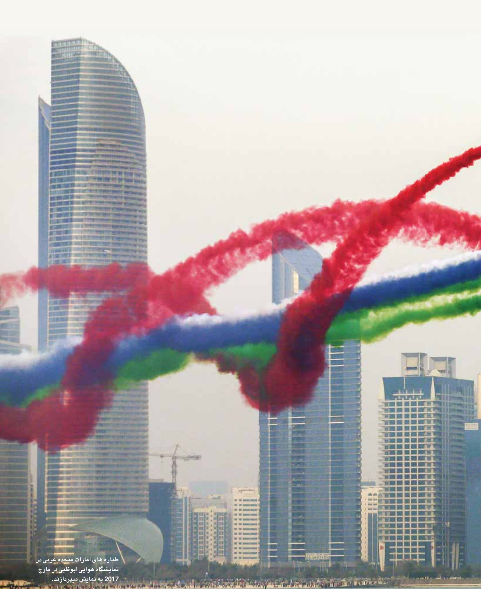
طیاره های امارات متحده عربی در نمایشگاه هوایی ابوظبی در مارچ 2017 به نمایش میپردازند.