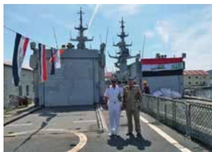
برید جنرال عمر التمیمی و دگروال محمد احمد شفیق بالای عرشه کشتی موسی بن نصیر قوای دریایی عراق

تنها چند روز پیش، دولت عراق خبر امضای توافقنامه با ایتالیا برای تحویل 12 کشتی جنگی به عراق سالها بعد از خرید آنها را اعلام کرد.