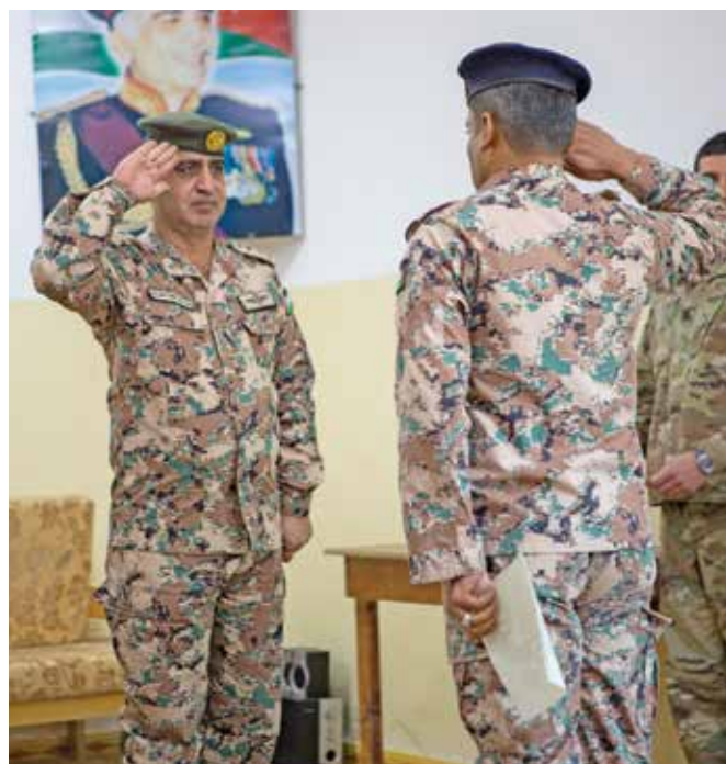
یک افسر ضابط قوای مسلح اردن، طرف راست، از کورس معلمی پایه اردن در دسامبر 2016 فارغ التحصیل میشود. فرماندان سنکام

دهها تن از افسران ضابط اردن به مدت یک سال در دوره رهبری محاروبی اردوی ایالات متحده در فورت بلیز، تگزاس اشتراک کردند تا از تعالیم صنفی و