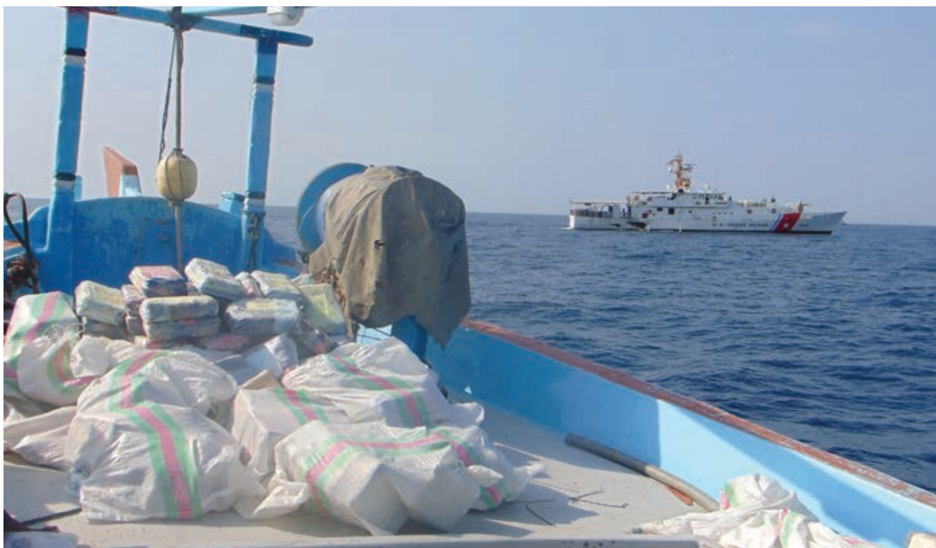
Катер американской Береговой охраны «Эмлен Таннелл» перехватывает судно с нелегальным грузом наркотиков в Оманском заливе в ходе операций Объединенной тактической группы 150, одной из пяти тактических групп в регионе Ближнего Востока в составе Объединенных морских сил – коалиции из 40 государств.

Учения в Кувейте взяли за основу предыдущие учения по тематике VBSS и включали суда «условного противника», более частые повторения процедур VBSS и выполнение заданий VBSS на борту кувейтских судов.