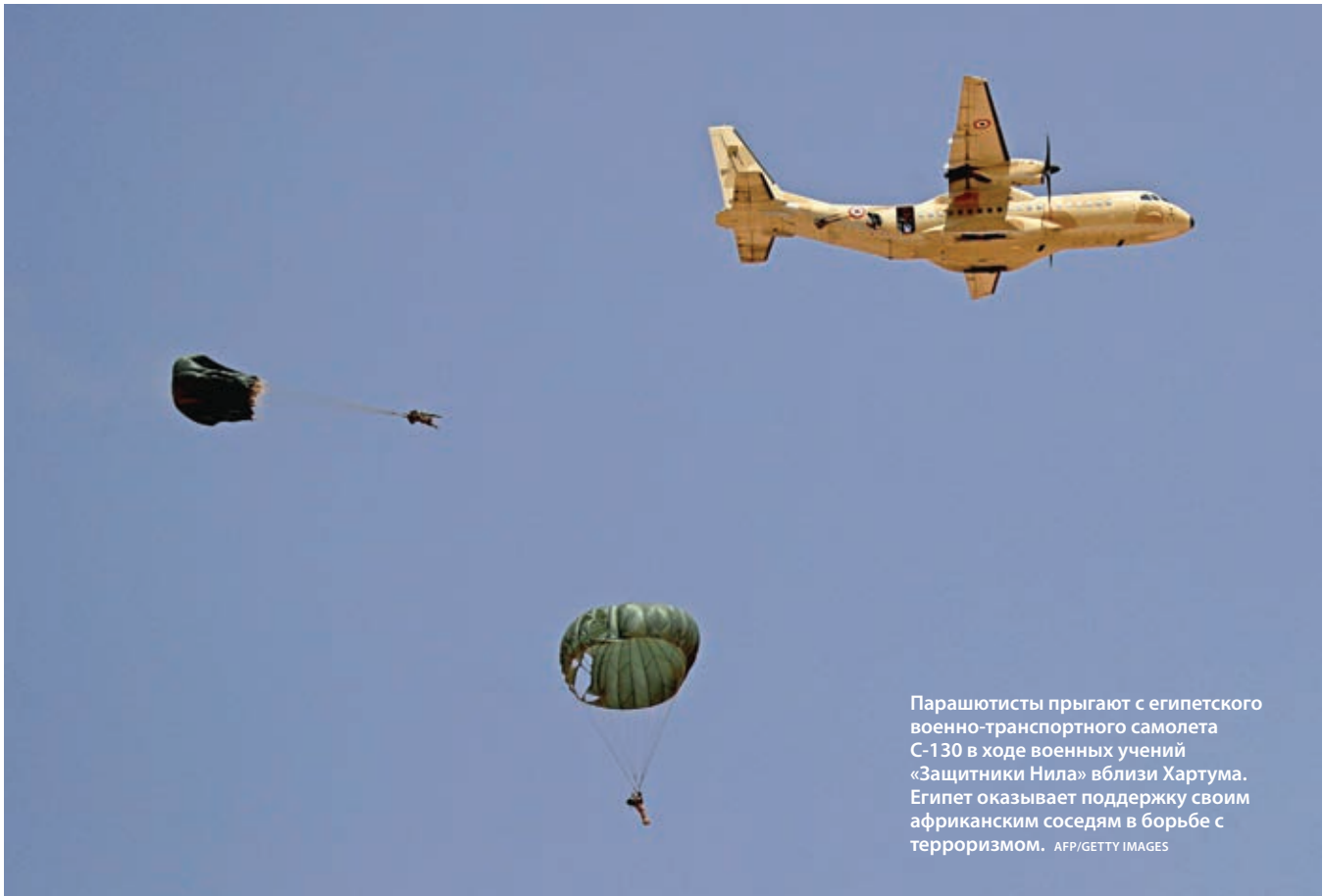
Парашютисты прыгают с египетского военно-транспортного самолета С-130 в ходе военных учений «Защитники Нила» вблизи Хартума. Египет оказывает поддержку своим африканским соседям в борьбе с терроризмом.

Европейского союза и Лиги арабских государств с участием более 50 стран. Участники обсуждали вопросы терроризма и нелегальной иммиграции на фоне ведущейся во имя всего мира борьбы Египта против террористических элементов на Синайском полуострове и приграничных районах.