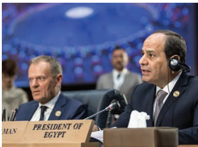
Президент Египта Абдель Фаттах ас-Сиси на заключительной сессии саммита Лиги арабских государств и ЕС в 2019 г. рядом с Дональдом Туском, бывшим в то время президентом Европейского совета. В числе основных обсуждаемых вопросов была борьба с терроризмом.

Терроризм нанес удар по Египту и по многим другим странам. Террористы уже близко подобралась к Европе и Соединенным Штатам, терроризм также набирает силу в Африке. Местные и многонациональные группировки могут сделать своими жертвами граждан многих государств. Например, при угоне самолета страдают пассажиры из многих стран.