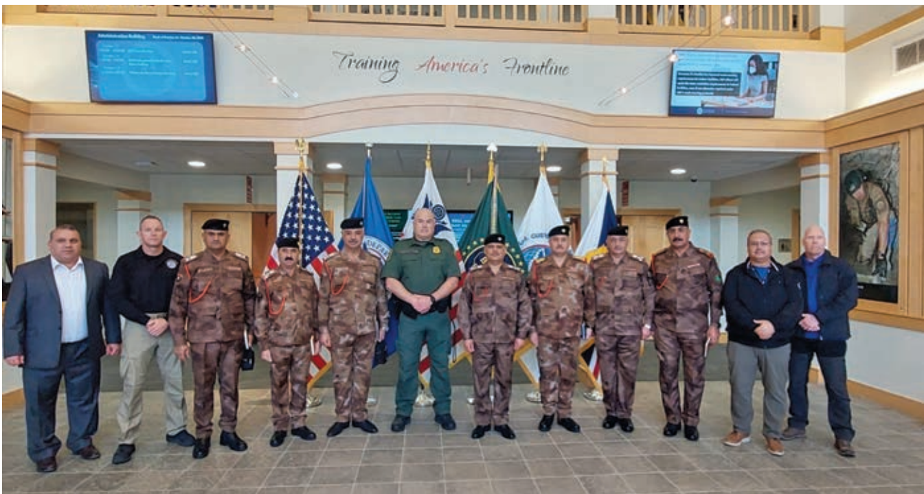
Делегация пограничников Ирака посещает центр таможенной и пограничной службы США в штате Западная Вирджиния.

«Unipath»: Иорданская пограничная служба пресекла попытки использовать беспилотники и парашюты для контрабанды наркотиков. А иракские пограничники пресекали подобные попытки? Могут ли датчики обнаружить их?