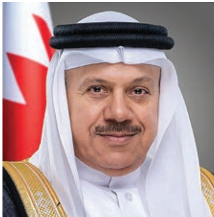
Д-р Абдуллатиф Бин Рашид Аль Заяни

Если мы сможем отстаивать эти ценности и принципы в мировом масштабе, демонстрируя их важность всем государствам, обществам и народам, то я считаю, что мы будем в состоянии перенаправить конкуренцию в позитивное русло в нашем регионе и за его пределами. Тем самым мы покажем, что международные отношения являются не «игрой с нулевой суммой», а возможностью наладить сотрудничество и взаимодействие, ведущие к взаимной выгоде и взаимоприемлемым решениям. ♦