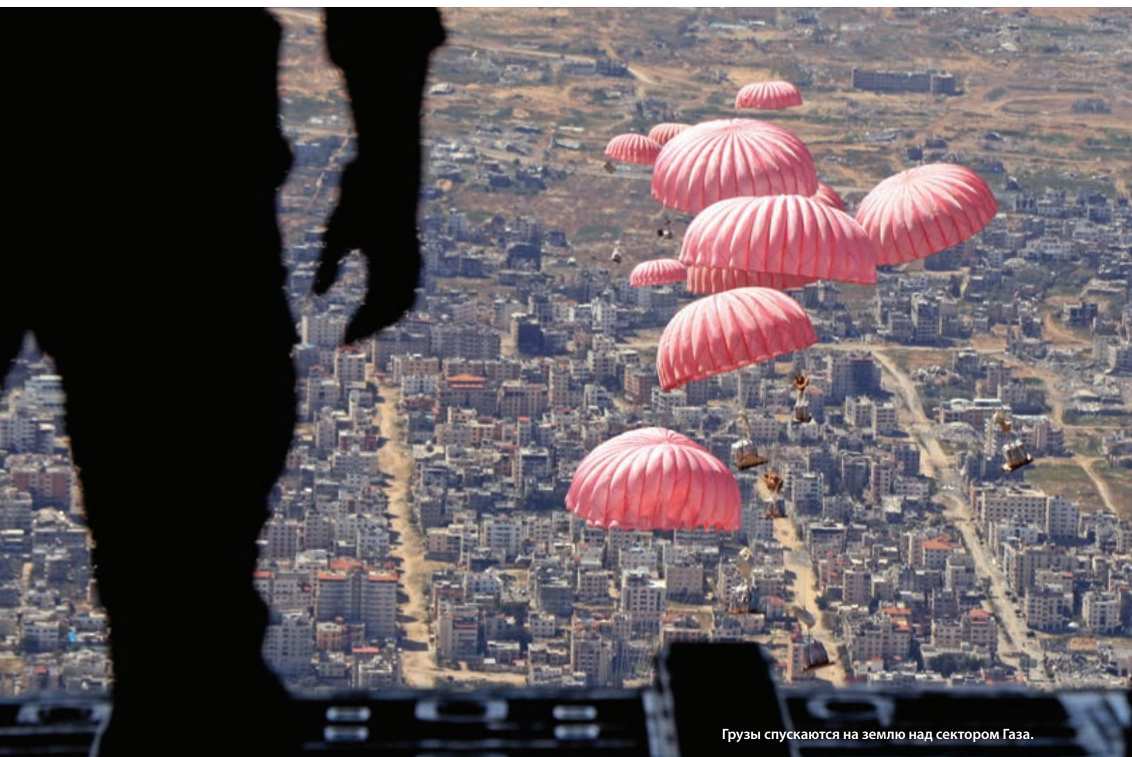
Грузы спускаются на землю над сектором Газа.

другую помощь для иорданских полевых госпиталей в секторе Газа, чтобы поддержать и расширить возможности работающих в них медиков по оказанию медицинских услуг, тем самым облегчая страдания раненных и травмированных людей в этих сложных условиях.