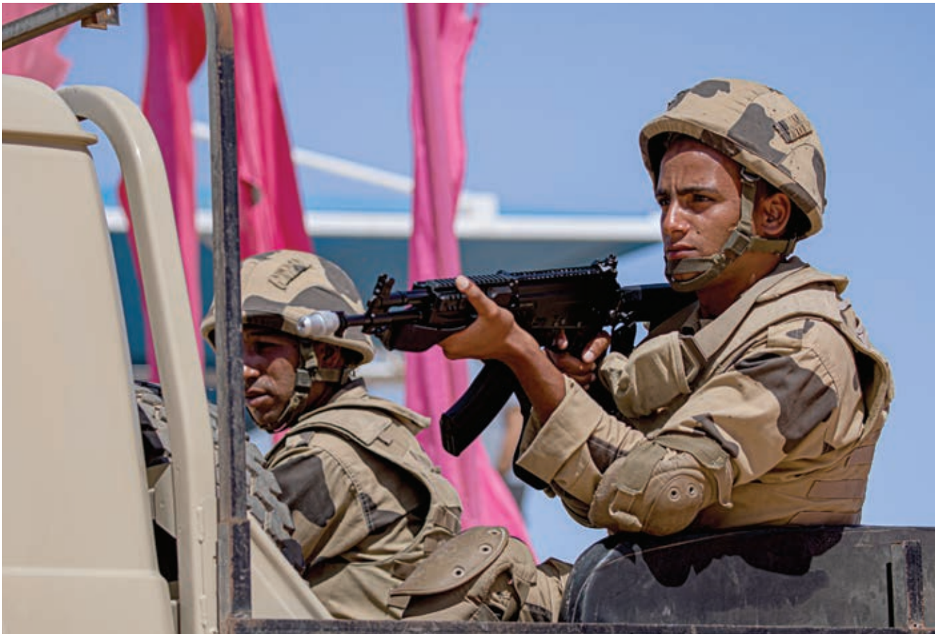
Египетские военные готовятся очистить деревню от террористов в ходе показательного «боя» в городской местности на военной базе им. Мухамеда Нагуиба во время учений «Яркая звезда – 23».

Египет считает, что терроризм не имеет национальной или религиозной принадлежности, и что необходимо бороться повсеместно с любыми его формами и проявлениями. Таким образом, государства мира должны превратить эту борьбу в ответственность, которую они несут перед своими народами и перед всем человечеством.