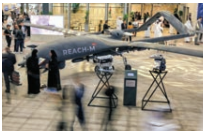
На авиасалоне в Дубае в ноябре 2023 г. в павильоне компании «EDGE» выставлен беспилотный летательный аппарат, способный летать на средних высотах долгое время.

«EDGE Group», государственный конгломерат в ОАЭ, был создан в 2019 г. и состоит из 25 компаний, предоставляющих военную и гражданскую продукцию и услуги. ОАЭ является вторым по