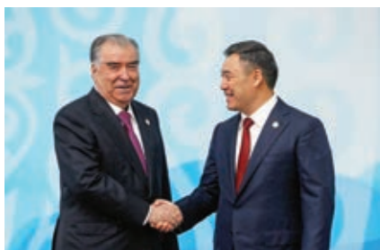
Президент Кыргызстана Садыр Жапаров приветствует президента Таджикистана Эмомали Рахмона в Бишкеке. Октябрь 2023 г.

«Я считаю, что этот формат должен быть сосредоточен на укреплении взаимопонимания и доверия, обеспечивая