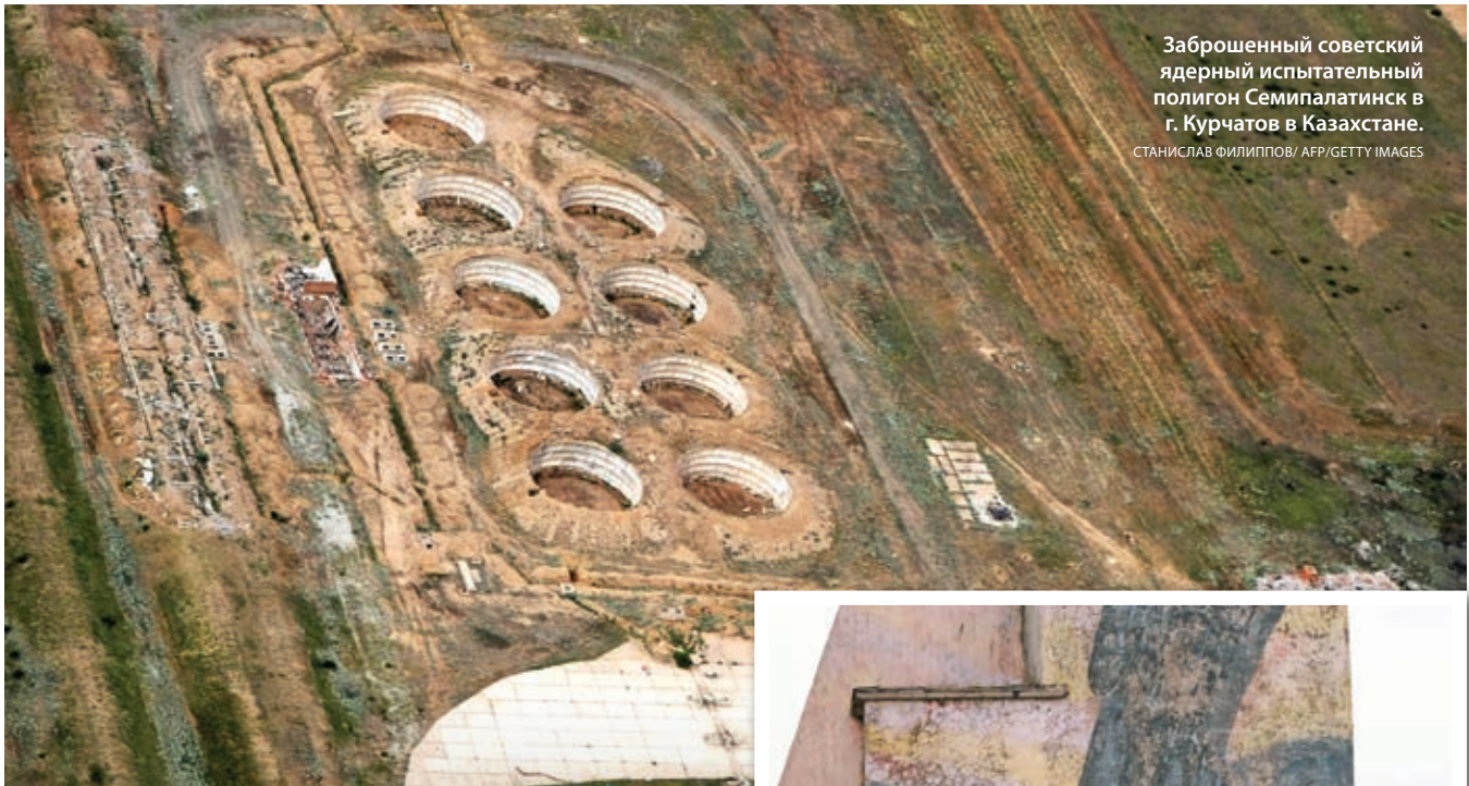
Заброшенный советский ядерный испытательный полигон Семипалатинск в г. Курчатов в Казахстане.