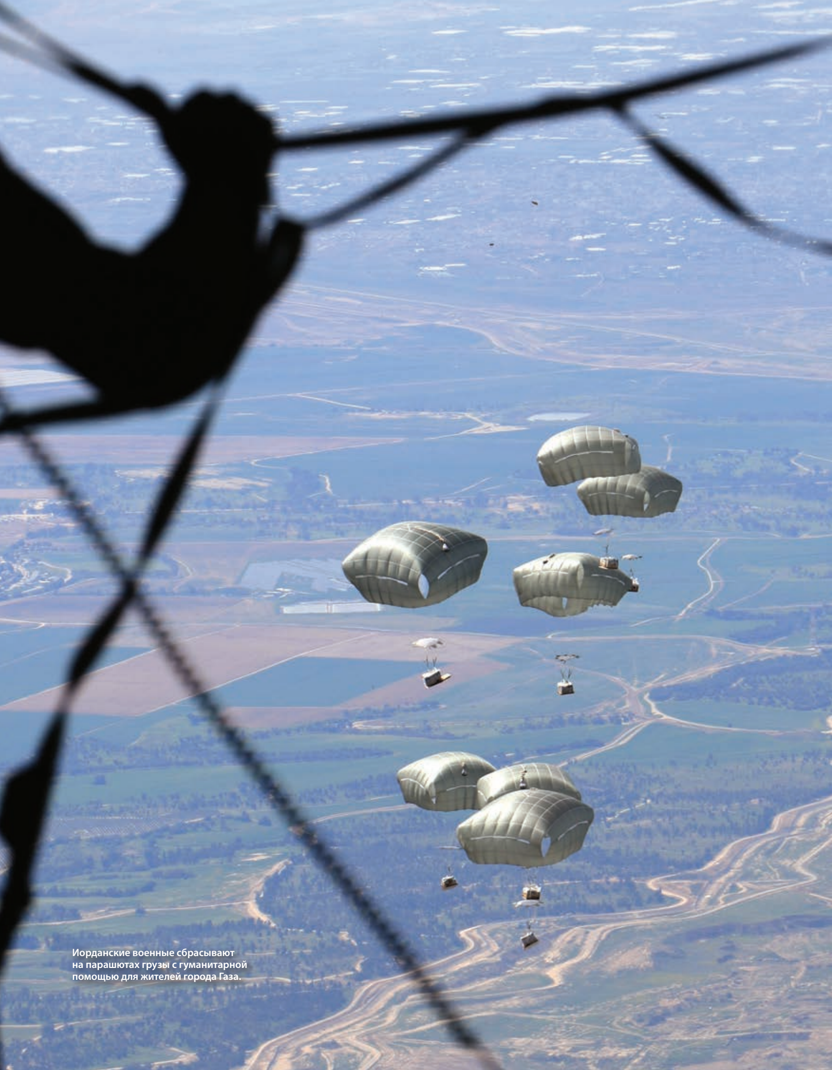
Иорданские военные сбрасывают на парашютах грузы с гуманитарной помощью для жителей города Газа.