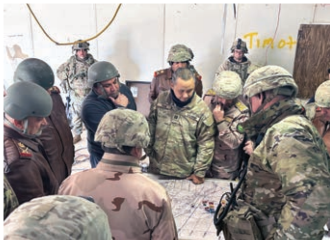
Офицер Сухопутных войск США разъясняет учебные операции, используя карту боевых действий.

оттачивании навыков сотрудников сил безопасности. Очень надеемся, что иракская армия сможет создать такой же инновационный учебный центр, который будет развивать потенциал доблестной иракской армии, обеспечивая ее полевыми навыками путем моделирования боевой обстановки и тактики, соответствующей различным местностям. Центр расширит возможности армии за счет обучения и создания подлинного боевого опыта для командиров и солдат. Он будет способствовать развитию лидерских качеств и процесса принятия решений командирами в управлении боевыми действиями, как на уровне подразделения, прибывшего для обучения, так и на уровне персонала центра, играющего роль вражеских сил.