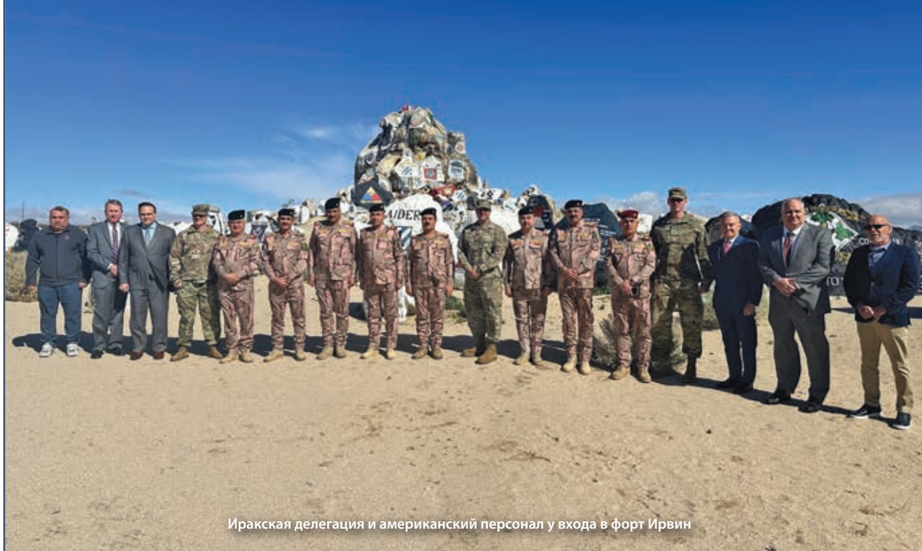
Иракская делегация и американский персонал у входа в форт Ирвин