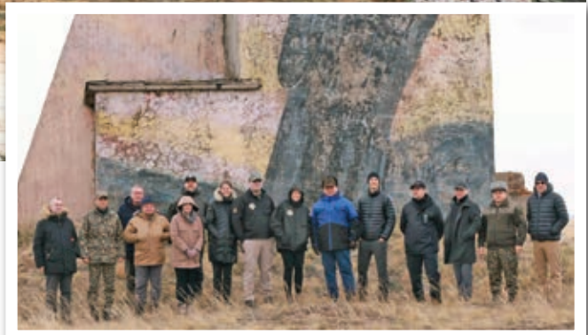
Официальные представители США и Казахстана посещают бывший испытательный ядерный полигон в Семипалатинске. Две страны совместно приступили к расчистке полигона, когда после развала Советского Союза Москва оставила этот объект зараженным.

Получив в наследие более 40 лет ядерных испытаний, Нурсултан Назарбаев, бывший в то время президентом ставшего независимым Казахстана, подписал Договор о сокращении стратегических наступательных вооружений (СНВ) и Договор о нераспространении ядерного оружия (ДНЯО), а также создал в стране Агентство по атомной энергетике. В обязанности этого нового агентства входило взаимодействие с Международным агентством по атомной энергии и его группой инспекторов и экспертов. В регионе Семипалатинска проживало 1,3 млн. человек, и примерно 30 тыс. жителей подверглись в советские времена облучению, связанному с ядерными испытаниями. Президент Назарбаев обратился к международному сообществу за помощью в разрешении этой кризисной ситуации в экологии и здравоохранении.