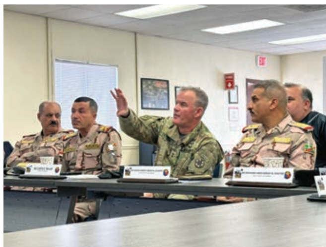
Справа: Генерал-лейтенант США Курт Тейлор объясняет сценарии тренировок своим почетным гостям.

их распределяют по различным воинским частям и подразделениям. Там они проходят специализированную подготовку по тем навыкам и специальностям, которые необходимы подразделению. Кроме того, у каждого полка есть учебный центр, где его подразделения проходят подготовку на уровне роты или батальона. Есть также учебный лагерь в Хаббании, способный обучать военнослужащих вплоть до генеральского уровня. Именно там мы тренировались во время учений «Iron Hammer» («Железный молот») в 2023 году.