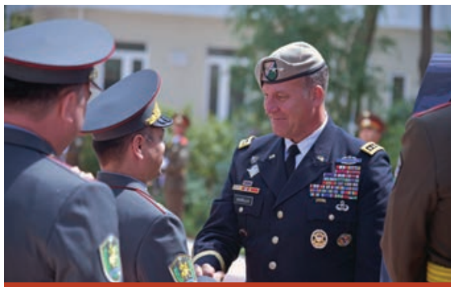
Генерал Майкл «Эрик» Курилла встречается с руководством Вооруженных сил Республики Узбекистан.

Делегация генерала Куриллы использовала поездку в