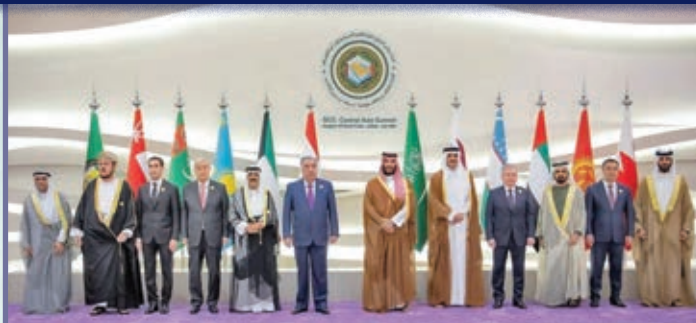
Руководители стран Центральной Азии и региона Арабского залива на саммите в июле 2023 г.