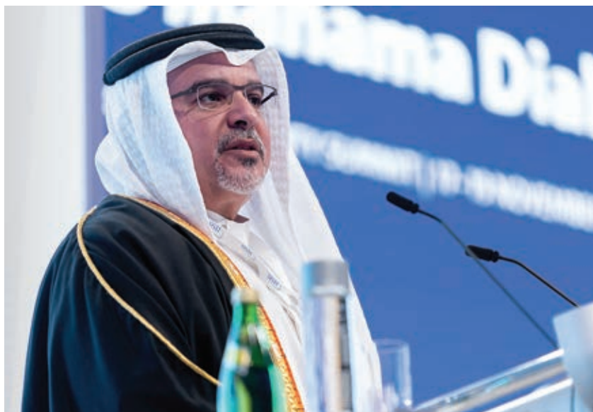
Его Королевское Высочество принц Салман бин Хамад Аль Калифа выступает на конференции.

Во время своего выступления 17 ноября 2023 г., Его Королевское Высочество назвал условия, необходимые для того, чтобы «разорвать порочный круг насилия», что возможно сделать только освободив невинных людей