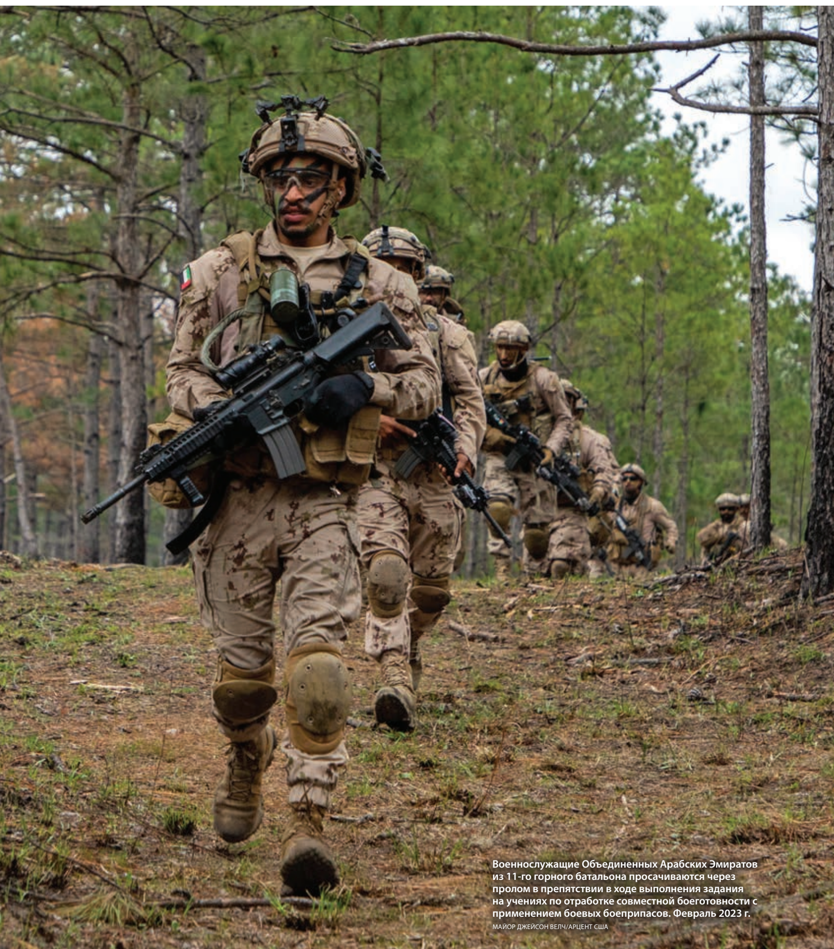
Военнослужащие Объединенных Арабских Эмиратов из 11-го горного батальона просачиваются через пролом в препятствии в ходе выполнения задания на учениях по отработке совместной боеготовности с применением боевых боеприпасов. Февраль 2023 г.