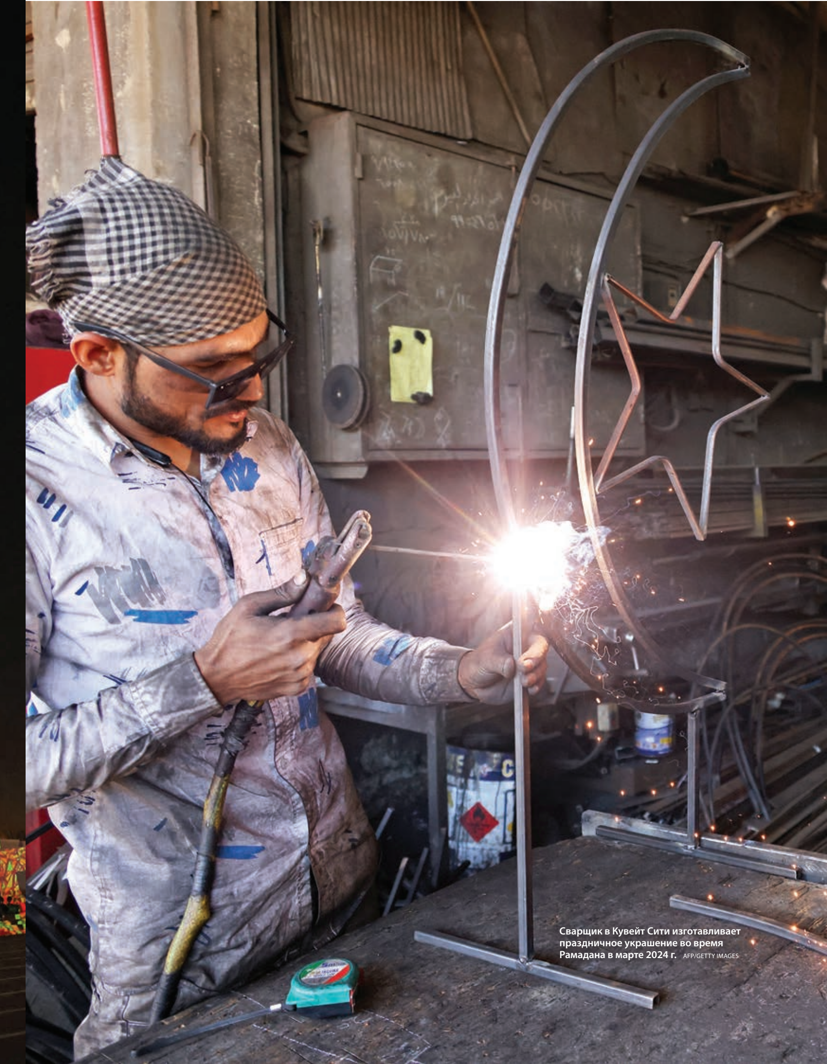
Сварщик в Кувейт Сити изготавливает праздничное украшение во время Рамадана в марте 2024 г.