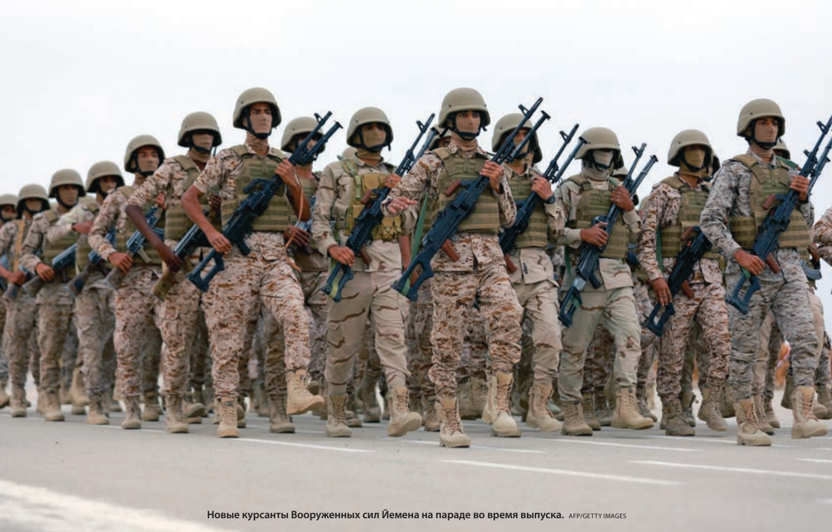
Новые курсанты Вооруженных сил Йемена на параде во время выпуска.

«У нас в Вооруженных силах Йемена есть возможности и практический опыт – это офицеры и другие военнослужащие ВМФ Йемена, сил прибрежной обороны и службы береговой охраны. Они все готовы к проведению операций, как только получат необходимое для этого вооружение, ресурсы и материальное обеспечение».