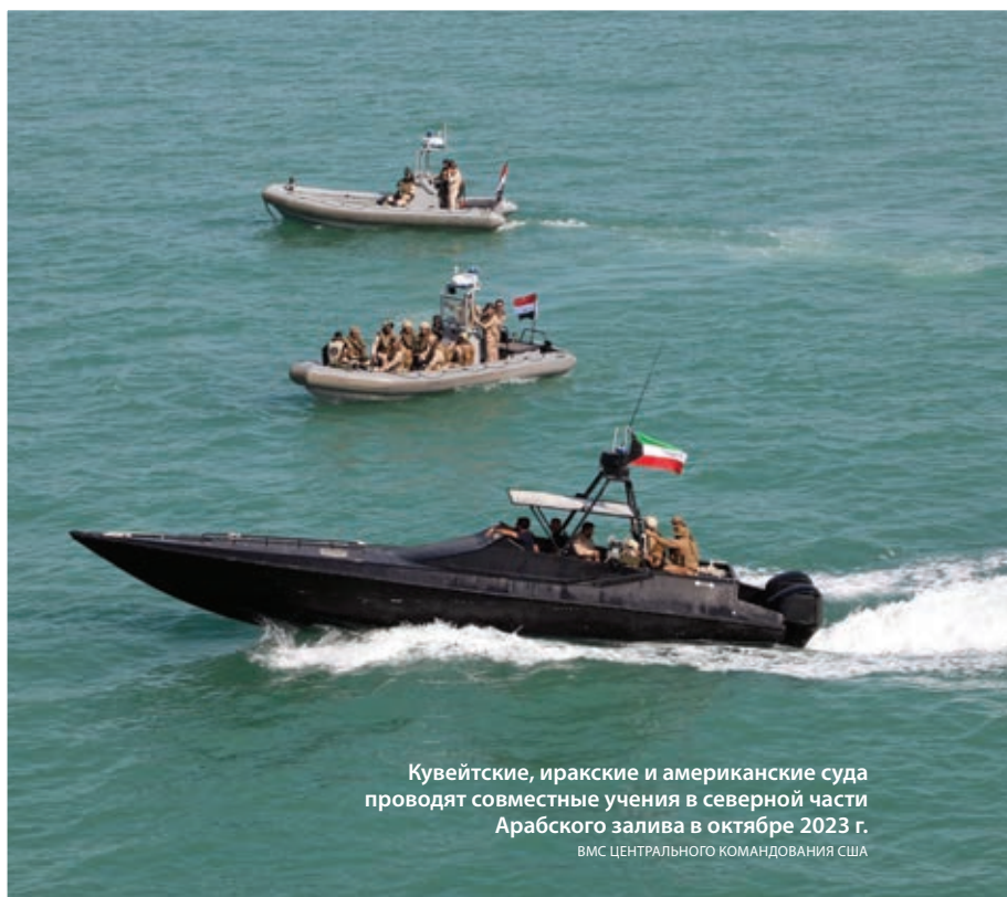
Кувейтские, иракские и американские суда проводят совместные учения в северной части Арабского залива в октябре 2023 г.

Учебные задания были сосредоточены на процедурах посещения, взятия на бордаж, обыска и конфискации судна (VBSS), проведении операций малыми судами, обеспечении безопасности рыбаков, проверке оборудования связи, а также на других аспектах морской безопасности.