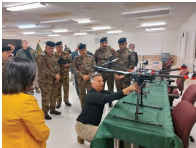
Агенты таможенной и пограничной службы США демонстрируют иракской делегации новые технологии, используемые для контроля границ.

того, они постоянно поддерживают связь с пограничниками из соседних стран. Мы лично отправляемся на границу, чтобы решить любую проблему, которая выходит за рамки компетенции бригадного и регионального командования. Уровень координации высок. Эти страны имеют искренние намерения в отношении с Ираком. Все, кто отвечает за пограничный контроль, начиная с Ирана и заканчивая Кувейтом, Саудовской Аравией, Иорданией, а также южной Сирией, демонстрируют высокий уровень координации.