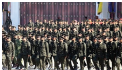
Кувейтские военнослужащие маршируют во время церемонии выпуска в Военной академии им. Али Аль-Сабаха в Кувейт-Сити. Февраль 2022 г.

Вооруженные силы Кувейта регулярно участвуют в национальных, региональных и международных