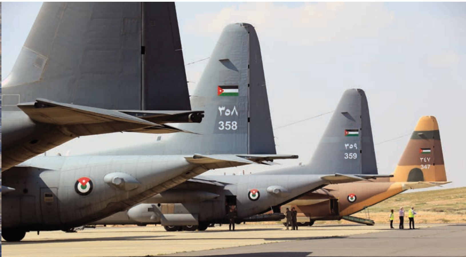
Эскадрилья транспортных самолетов Королевских ВВС Иордании в ожидании отправки грузов на авиабазе им. короля Абдуллы II.

случаях отсутствия функционирующей наземной инфраструктуры или когда гражданское население оказалось в местах, недоступных для гуманитарных организаций. Тем не менее, вариант сброса грузов с воздуха рассматривается как самый крайний случай, учитывая его высокую стоимость по сравнению с наземной транспортировкой, опасность полетов над зоной конфликта и риска травмирования людей на земле в случае приземления тяжелого груза в незапланированном месте.