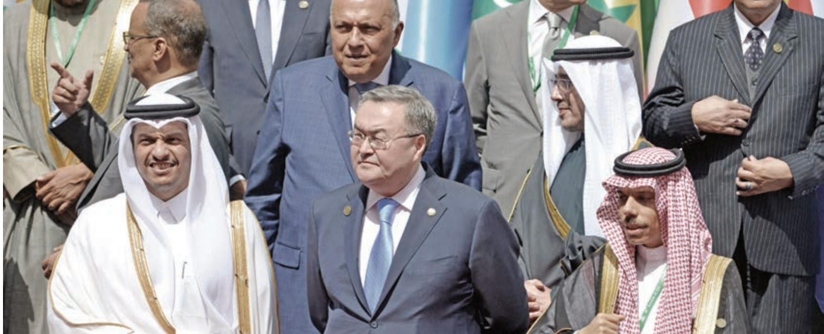
Министр иностранных дел Катара Мухаммед бин Абдулрахман бин Яссим Аль Тани, слева, министр иностранных дел Казахстана Мухтар Тлеуберди и министр иностранных дел Саудовской Аравии принц Файсал бин Фархан Аль Сауд на 48-й сессии Совета министров иностранных дел Организации исламского сотрудничества в Исламабаде.

крупные инвестиции в проекты энергетической инфраструктуры в регионе, включая завод по переработке угля и химический комбинат в Казахстане.