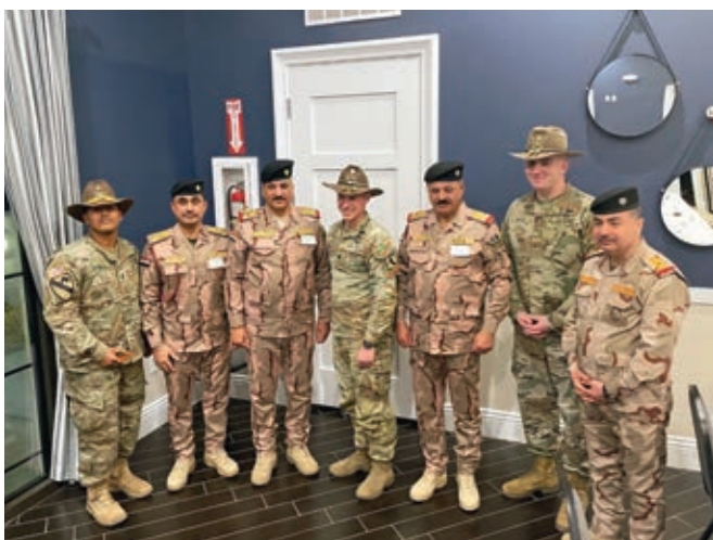
Слева: Иракские офицеры посещают американских военных в центре военной подготовки.