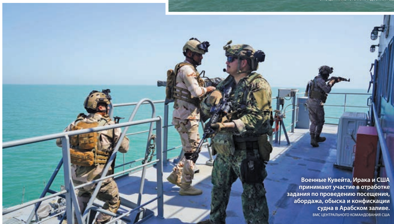
Военные Кувейта, Ирака и США принимают участие в отработке задания по проведению посещения, бордажа, обыска и конфискации судна в Арабском заливе.