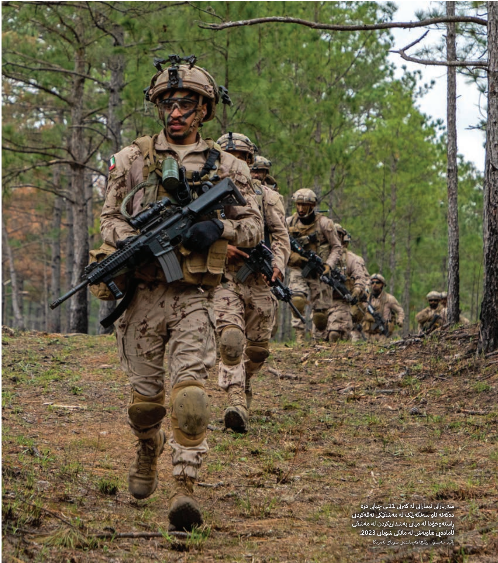
سەربازانی ئیماراتی له کهرتی 11ی چیبای دزه ده‌کهنه ناو سه‌نگه‌زنگ له مه‌شقی ته‌قه‌کردنی پاسته‌وخۆدا له میان به‌شداریکردن له مه‌شقی تاماده‌ی هاوبه‌ش له مانگی شوپاتی 2023.