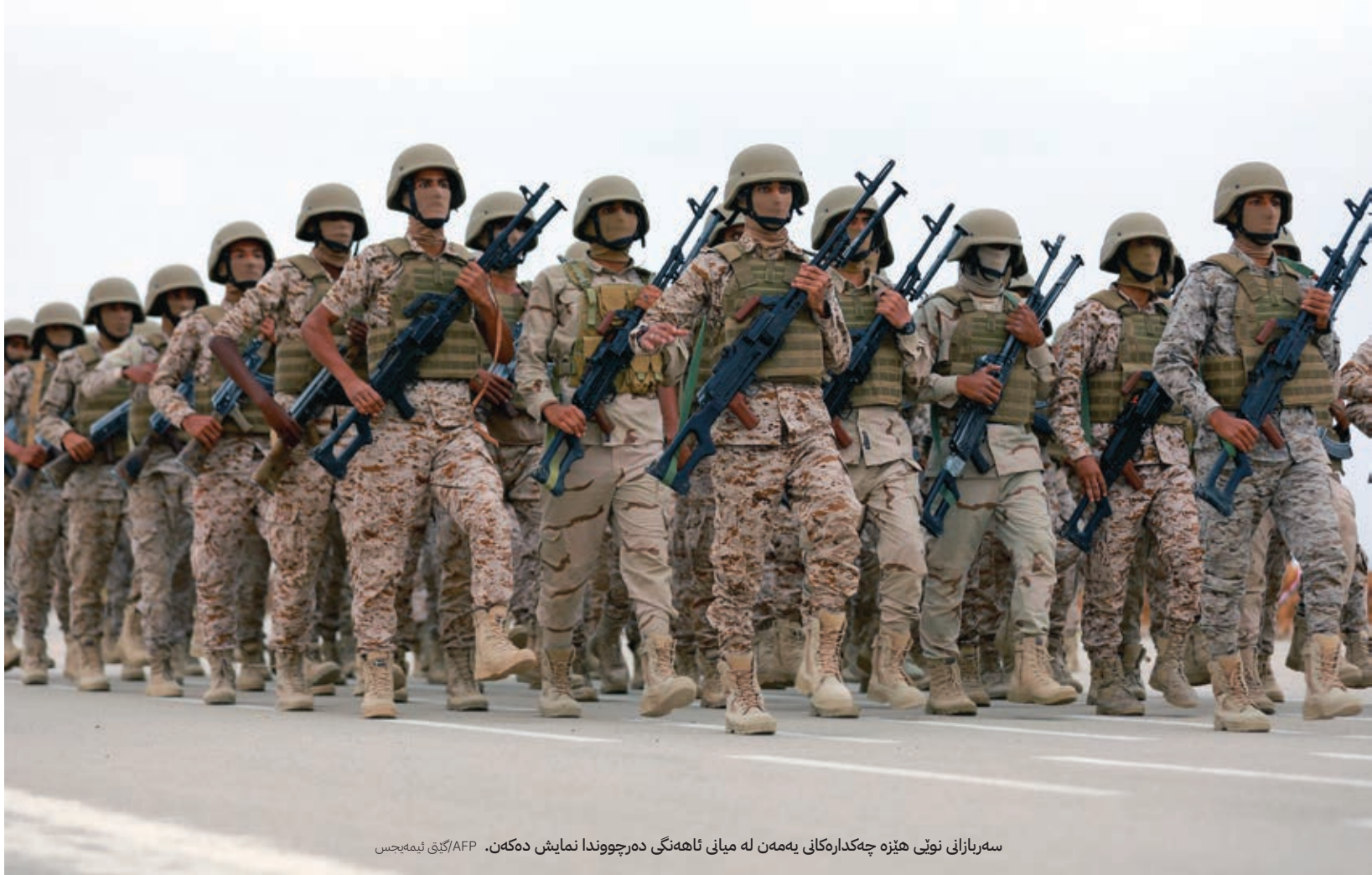
سەربازانى نوێى ھېزە چەكدارەكانى يەمەن لە ميانى ئاھەنگى دەرچووندا نەمايش دەكەن.

”ئېمە لە ھېزە چەكدارەكانى يەمەن خاوەنى توانا و ئەزموونى كردارىين لە شېوھى ئەفسەر و كارمەندانى دىكە لە ھېزى دەريايى يەمەن، ھېزەكانى بەرگريى كەناراو و پاسەوانى كەناراو. ئەمانە كاتىك كە بە چەك و سەرچاوەى ترى پېويست ئامېر بەند دەكرين و پشتيوانى ئامرازى پېويستيان بۆ بەرپۆە بردنيان ھەبىت، بۆ ئەنجامدانى ئۆپەراسيۆنەكان تەواو ئامادە دەبن.“