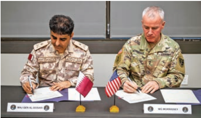
لیوای قەتەری عەبدولعەزیز ئەلدۆسەری، راوژکاری جیگری سەرۆک وەزیران و وەزیری دەولەت بۆ کاروباری بەرگری بۆشایی ئاسمان و پەیوەندییە ئەلیکترۆنییەکانی قەتەر، لەگەڵ لیوای سوپای ئەمریکا مایکل مۆریسی، بەرپۆشەری بەرپۆشەرایەت ستراتژی، پلاندانان و سیاسەت فەرماندەیی بۆشایی ئاسمانی ئەمریکادا پێککەوتننامە یەکپان واژۆکرد. فەرماندەیی بۆشایی ئاسمانی ئەمریکا

لە کاتیگدا شاندی قەتەر بۆ واژۆکردنی پێککەوتننامە ئەگەڵ فەرماندەیی بۆشایی ئاسمانی ئەمریکا لە ویلايەتی کۆلۆرادۆی ئەمریکا بوو، USSPACECOM بۆ بەشداریکردن لە پاسەوانی جیهانی 2024 لە بنکە یەزێی بۆشایی ئاسمانی فاندنبرگ لە ویلايەتی کالیفۆرنیا، بانگهێشتی هێزە چە کدارەکانی قەتەر کرد. پاسەوانی جیهانی، گرنترین چالاکی هەماهەنگی ئاسایشی USSPACECOM، کە بۆ بەهێزکردنی هاوبەشییە ئێودەوڵەتیەکان، باشتکردنی هەماهەنگی کارکردن و برەودان بە ئاکاری بەرپرسیارانە لە بۆشایی ئاسمان داڕژراوە.