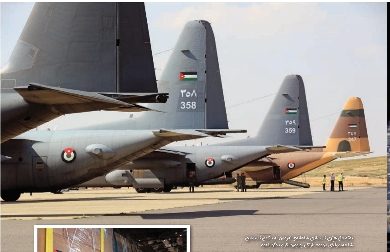
پهكەيهكې ھيڙى ئاسمانىي شاھانەي ئەردەن لە بنكەي ئاسمانىي شا عەبدوللەي دووھم بارىكى چاوپەرەنكرائو دەگوازئەوھ.