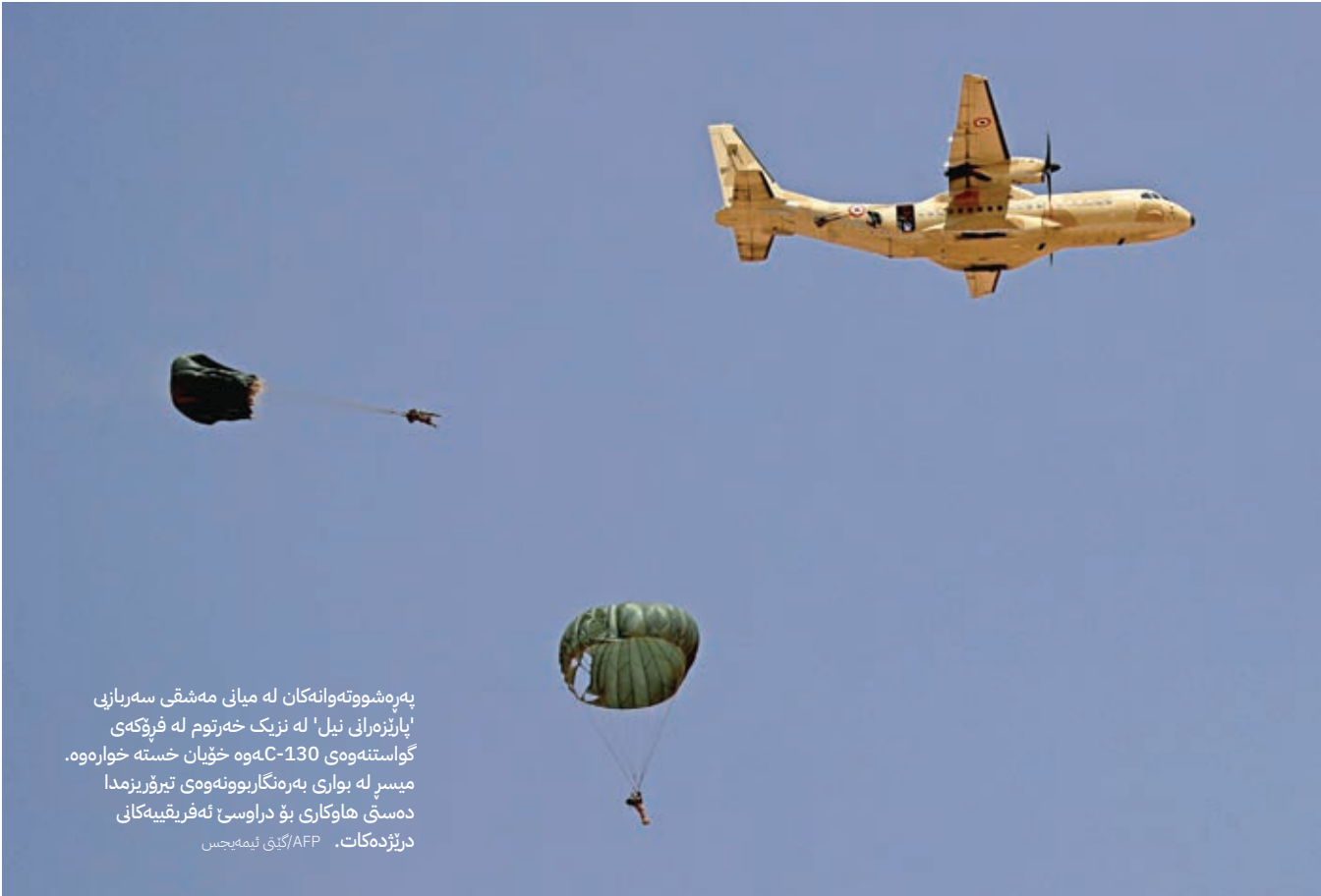
پەشەشووتەوانەکان لە میانى مەشقى سەربازى 'پارێزەرانى نیل' لە نزىک خەرتوم لە فرۆكەى کواستنهوهى C-130هوه خۇيان خستە خوارهوه. میسر لە بواری بەرەنگاریبووتەوهى تیرۆریزمدا دەستى هاوکارى بۆ دراوسێ ئەفریقایەکانى درژدەکات.