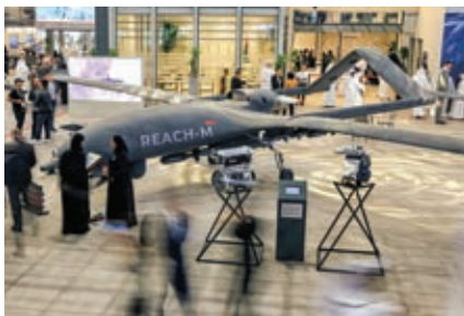
فرۆكەيەكى بۆ فرۆكەوانى بۆ تەلى بەرزى مامناوھەندى مەودا درژى لە ميانى پىشانگاي ئاسمانى دۆبەى لە مانگى تشرىف دووھى 2023، لە كۆشكى ئىچ نەمايشكرا. AFP/گىڤى ئىمەيجس

سەرچاوەكان: كۆمپانىيائى ئىچ گروپ، breakingdefense.com ، Aviationweek.com