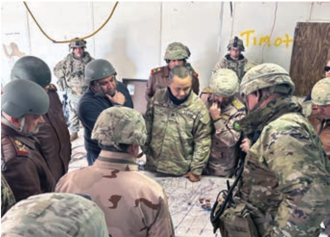
ئە فسه رکی سوپای ئەمریکا به به کارهینانی نه خشه یه کی مەیدانی جهنگ ئۆپه راسیۆنه کانی مەشکردن روونکرده وه.

سوپای عێراق بتوانیت ناوهندیکی هاوشیوه ی ئە م دامه زراوه سه رسورهینه ری هه بیته. ناوهندیکی له و شیوه یه توانا کانی سوپای بویری عێراقی په ره پیده دات و له پێگه ی هاوشیوه کردنی ژینگه کانی جهنگ و ته کتیکه شیوا بۆ ناوچه جیاوازه کان توانای مەیدانیان پیده به خشیته. له پێگه ی مەشقی و دروستکردنی ئە زمونیکی جهنگی راسته قینه بۆ فەرمانده و سه بارزه کان، توانا کانی بهرز ده کاته وه. ئاخۆ له سه ر ئاستی ئە و یه که یه ی که بۆ مەشکردن هاوتوه یاخود ئە و کارمه ندانه ی ناوه ند که پۆلی هیزه دوژمن ده گێرن، توانای سه رکردایه تی و پروسه ی بێراردانی فەرمانده کان له به پۆه بردنی جهنگه کاندایه بهرز ده کاته وه.