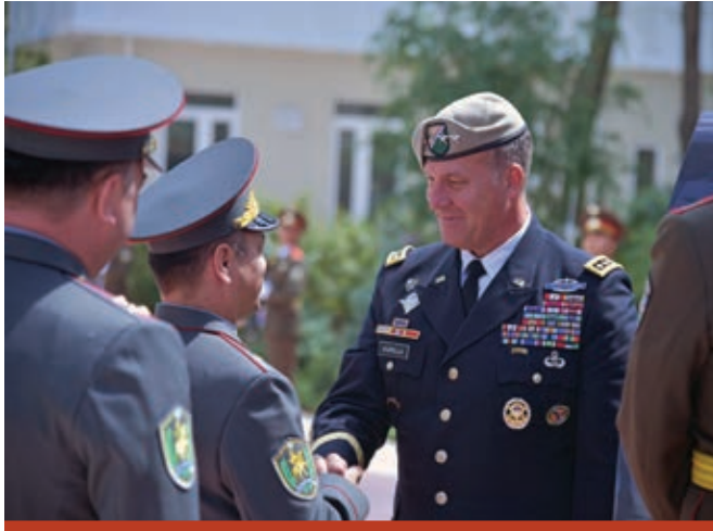
فەرىقى يەكەم مايكل "تېرىك" كورپلا لەگەل سەرکردايەتەي ھيژە چەكدارەكانى كۆماری ئۆزبەكستان كۆدەبیتتەوہ. فەرماندەي ناومندى ئەمريكا

بەرەوپیشچوونەكان لە پەيوەندىي بەرگرىي لەگەل فەرماندەي ناوہندى ئەمريكادا، گەشتەكەي بۆ ئۆزبەكستان بەكارھيئا.