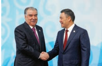
سادىر جاپارۆف سەرۆكى قىرغىستان لە مانگى تشرىف يەكەمى 2023دا لە شارى بېشكېك پېشوازى لە ئىمۇمالى رايخۇن سەرۆكى تاجاكىستان دەكات. پۇتەرز

سەرچاوەكان: Vesti.kg, NewsCentralAsia.net