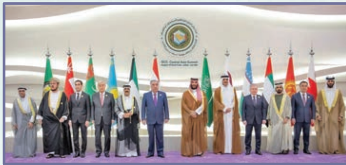
سہرکدہکانی ئاسیای ناوہراست و کھنداوی عہرہبی بۆ دیداری لوٹکھی مانگی تہموزی 2023 کۆدہنہوہ. دہرگای رۆژنامہوانی سعودیہ