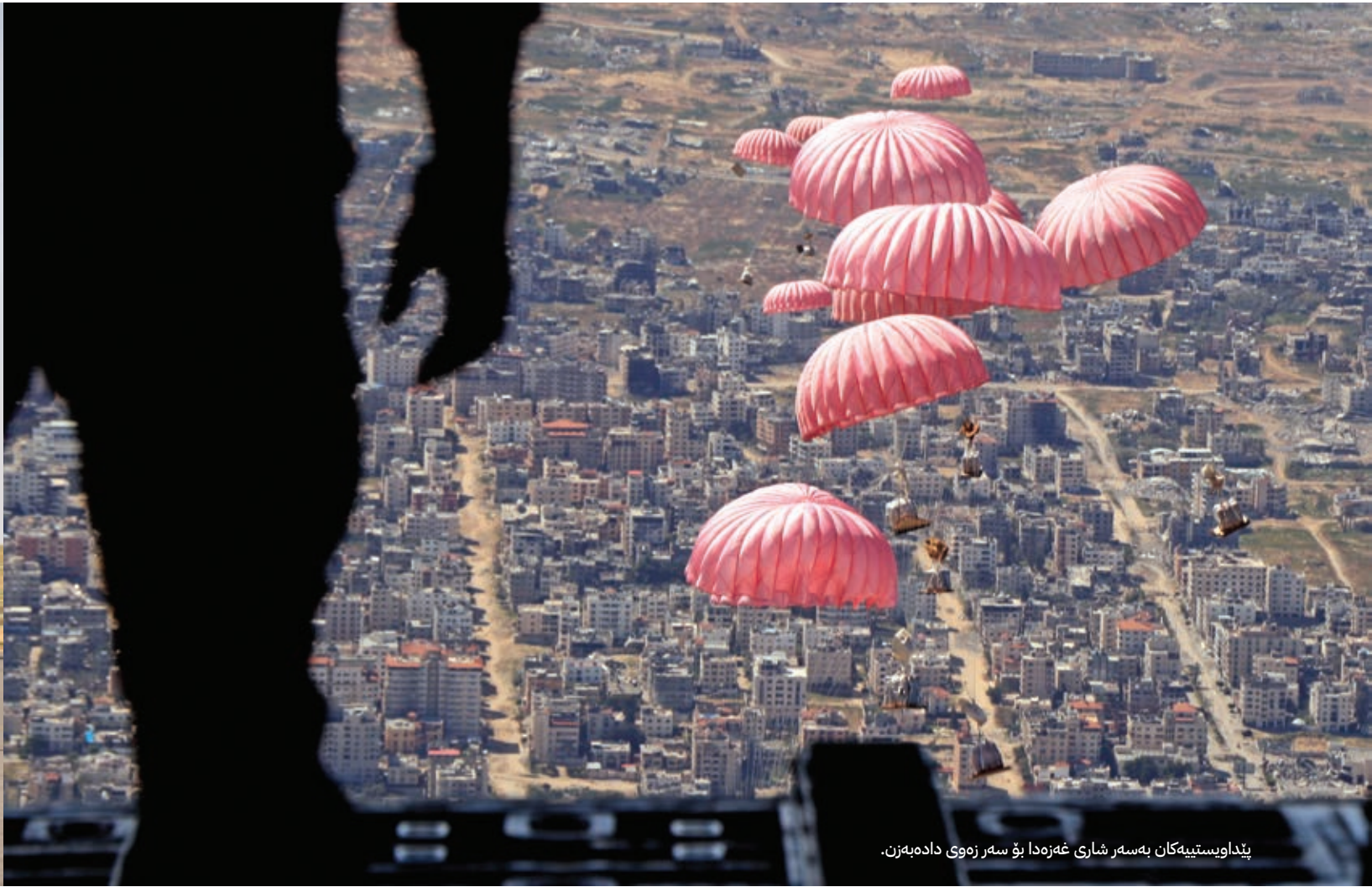
پیداویستییهکان بهسەر شاری غەزدا بۆ سەر زهوی دادەبەزن.

خستنه خوارهوهی ئاسمانی زیادیکرد، لهبەرئەوهی هێزه چه کدارهکانی ئەردەن بۆ چەرکدنهوهی ئۆپەراسیۆنهکانی خستنه خوارهوهی ئاسمانی، شانبهشانی زۆریک له ولاتانی تر کاریانکرد.