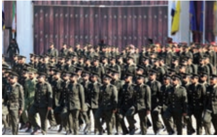
سەربازانى كوهيت لە ميانى ئاھەنگى دەرچوونيان لە ئەكادىميای سەربازىي عەلى ئەلسەباح لە مانگى شوباتى 2022، لە شارى كوهيت رپيپوان دەكەن.

بە سەركردايەتەي ئەمريكا لە سالى 1991 دەستى بە بەرنامەيەكى ئامانجدار بۆ ئاوەدانكردنەوہى خۆي و ئامپەربەندكردنەوہى ھيژە چەكدارەكانى كرد. بۆ ئەم مەبەستەش، كوهيت فەرمانگەي چاكبوونەوہى فريگوزارىي كوهيتى دامەزراند كە لە نزيكەوہ لەگەل فەرمانگەي ھاوكارىي ئاوەدانكردنەوہى بەرگرىي ئەمريكاي تازە دامەزرادا كە كارمەندانى يەكەي ئەندازيارانى سوپاي ئەمريكا كاريان تيدا دەكرد، ھەماھەنگى ئەنجامدا. لە سالى 2017دا، كوهيت ناوہندىكى ناوچەيى ناتۆي كردەوہ، دووبارە خزمەتكردنى سەربازىي ناچارىي ھيتايە ئاروہ و بودجەي 10 ملىار دۆلارى ئەمريكاي بۆ ھاوچەرخكردنى بەرگرى تەرخانكرد، لە تىوانياندا كرىنى فرۆكەي جەنگى، تانك و سيستەمى بەرگرىي ئاسمانى پيشكەوتوو تا سالى 2026.