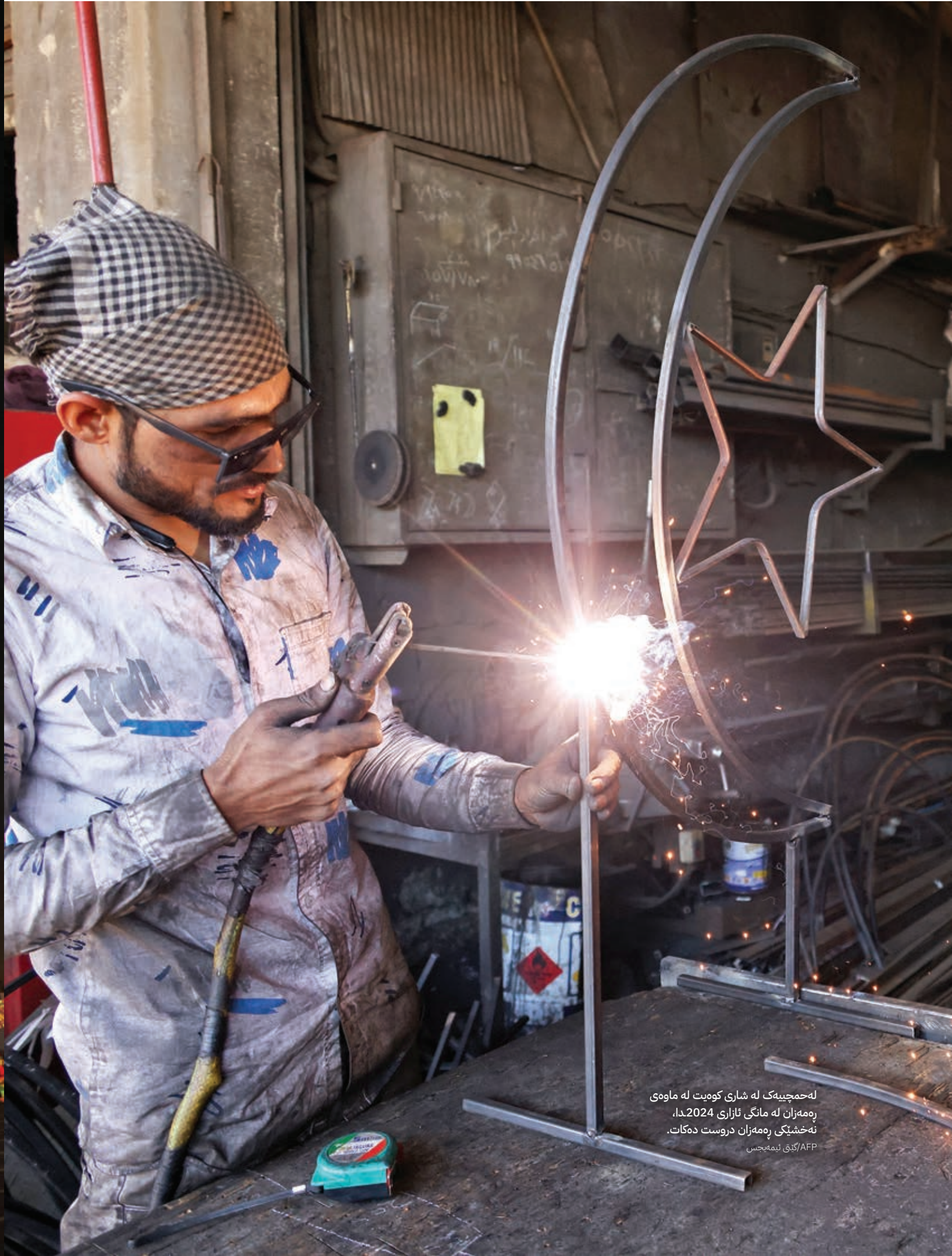
له‌حمچیه‌ک له شاری کوهیت له ماوهی په‌مه‌زان له مانگی ئازاری 2024دا. نه‌خشیکی په‌مه‌زان دروست ده‌کات.