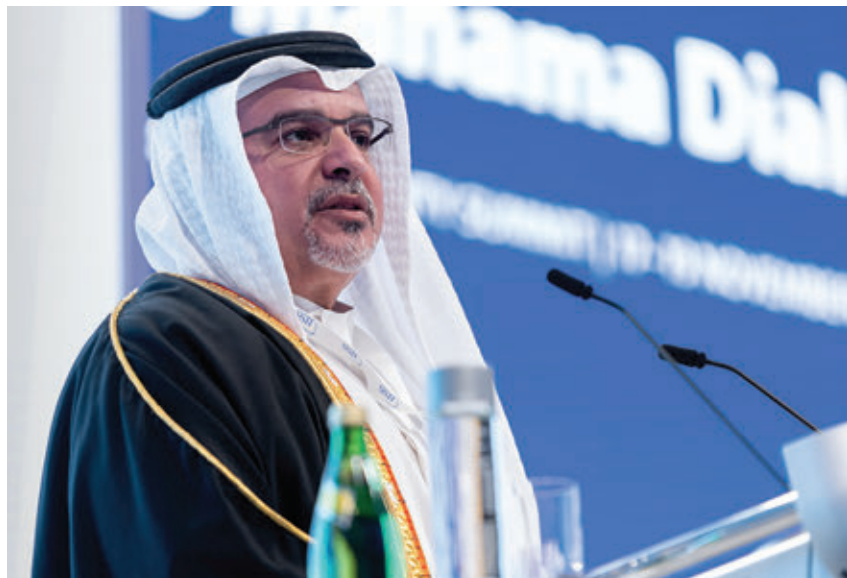
عالی‌جناب شاهزاده سلمان بن حمد آل خلیفه، از بحرین، در نشست منامه سخنرانی می‌کند. موسسه بین‌المللی تحقیقات استراتژیک

عالی‌جناب شاهزاده سلمان بن حمد آل خلیفه ، ولیعهد و صدراعظم بحرین، سخنان اصلی نوزدهمین دوره نشست امنیتی «گفتمان منامه» بود. وی بر انتخاب راهکار مسالمت‌آمیز برای بحران غزه تأکید کرد.