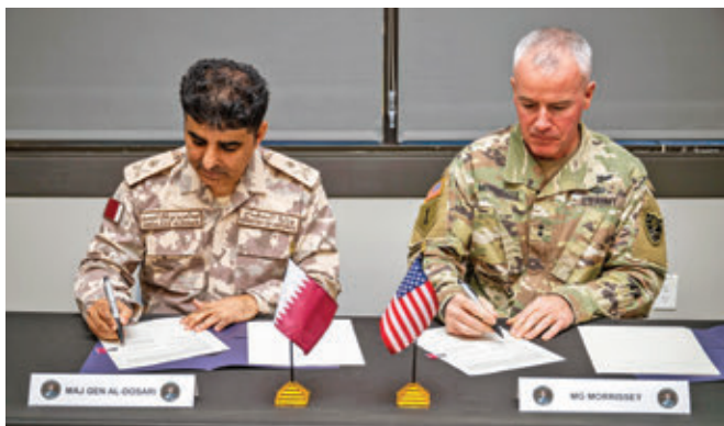
تورن جنرال عبدالعزیز الدوساری، مشاور معاون صدراعظم و وزیر امور دفاعی قطر در حوزه فضا و مخابرات، قراردادی را با تورن جنرال مایکل مورسی، مدیر اداره استراتژی، پروگرام و سیاست قرارگاه فضایی ایالات متحده، امضا نمود.

«سازمان هوانوردی و فضاوردی قطر» برای ایجاد زمینه پیشرفت این کشور در حوزه هوانوردی و فضاوردی تاسیس شد. قطر و «سازمان هوانوردی و فضاوردی ایالات متحده» (NASA) در راستای پروژه دیگری برای پرتاب ماهواره تخصصی تحقیقاتی همکاری می‌کنند. این ماهواره برای شناسایی آب‌خیزهای کشف‌نشده صحرا، که برای کشورهای خشک خاورمیانه اهمیت بسزایی دارد، به فضا پرتاب خواهد شد.