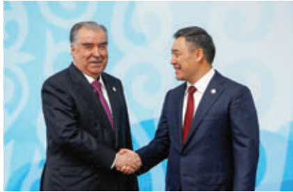
سیدر جباروف، رئیس‌جمهور قرقیزستان، در اکتوبر 2023 میزبان امامعلی رحمان، رئیس‌جمهور تاجیکستان بود.

رئیس‌جمهور جباروف، با اشاره به مسائل امنیت منطقوی، بر اهمیت حفظ صلح و ثبات در افغانستان و جلوگیری از بی‌ثباتی این کشور و مقابله با هجوم پناهندگان از این کشور به کشورهای همسایه تاکید کرد. منابع: Vesti.kg, NewsCentralAsia.net