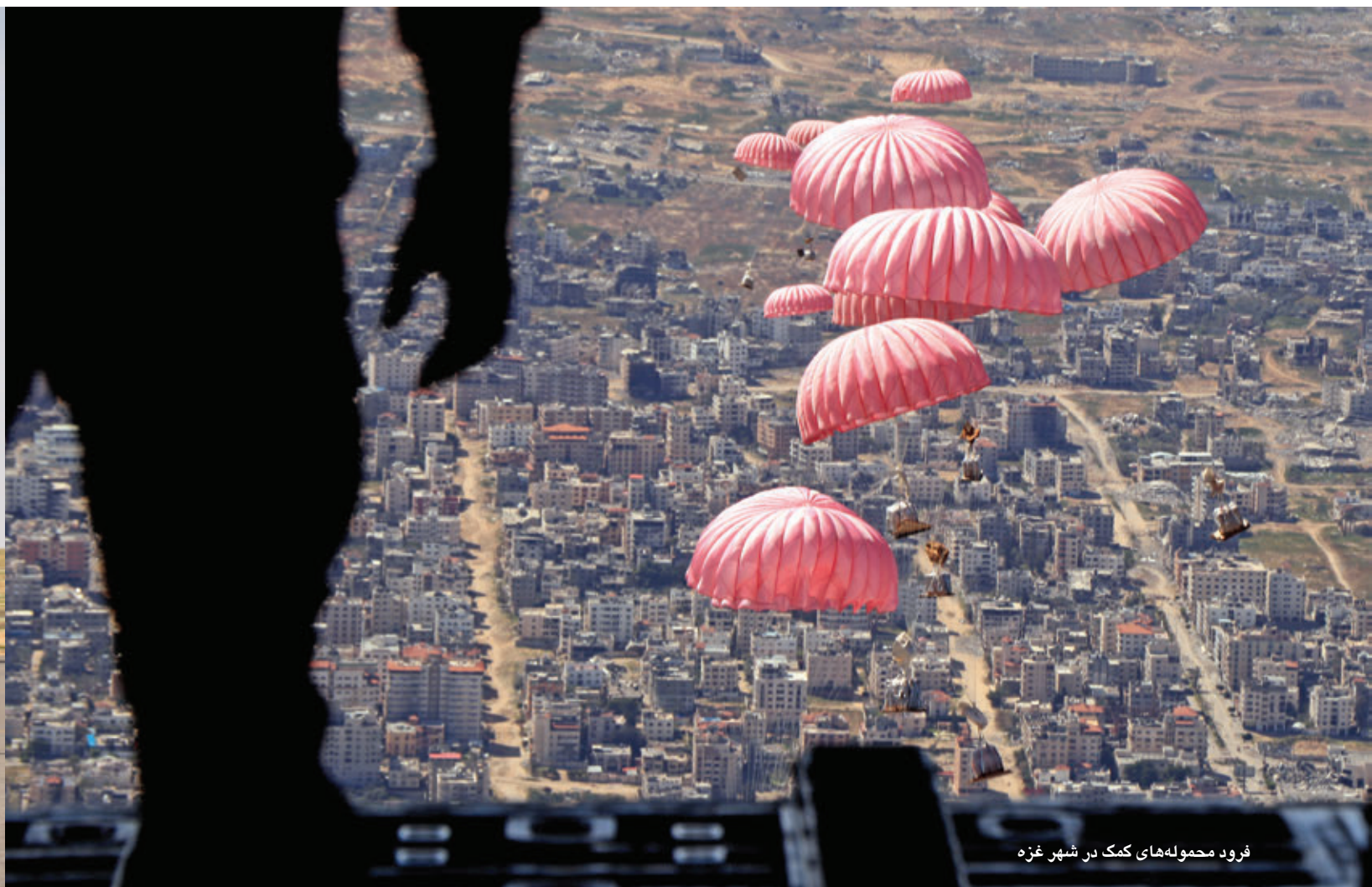
فروند محموله‌های کمک در شهر غزه

چون کشورهای دیگری نیز در این ماه با قوای مسلح در قسمت کمک‌رسانی هوایی همکاری می‌کردند.