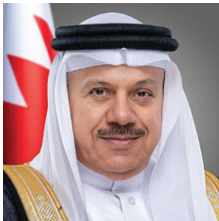
داکتر عبداللطیف بن رشید الزیانی

اگر بتوانیم این ارزش‌ها و اصول را در مقیاس جهانی ترویج و تقویت کنیم و اهمیت آنها را به همه کشورها، جوامع و مردم نشان بدهیم، می‌توانیم جریان رقابت در منطقه و فراتر از آن را در مسیری سازنده هدایت کنیم. به این ترتیب، ما ثابت خواهیم نمود که روابط بین‌المللی بازی جمع صفر نیست، بلکه فرصتی برای همکاری و مشارکت تأمین‌کننده منافع دوجانبه و راهکارهای مشترک است. ♦