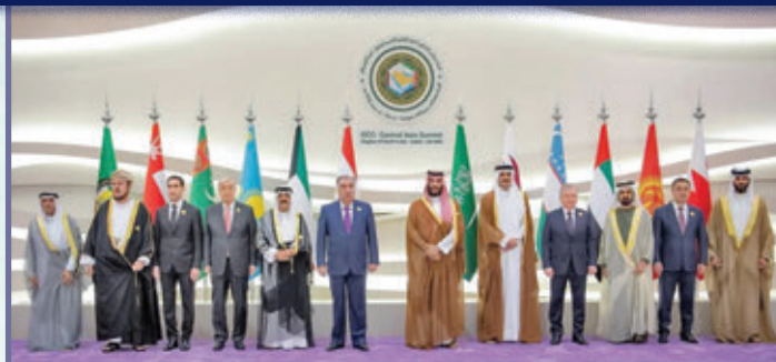
رهبران آسیای میانه و کشورهای حاشیه خلیج عربی در جولای 2023 در نشست گرد هم آمدند.