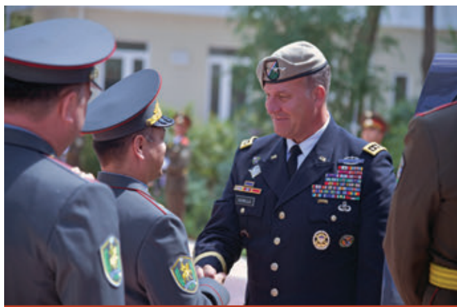
جنرال مایکل «اریک» کوریل با قومندان قوای مسلح جمهوری ازبیکستان دیدار کرد. قومندانی مرکزی ایالات متحده

دگر جنرال بهادر قربانف، استفاده کرد. دگر جنرال قربانف بر ضرورت تقویت پیوندهای دفاعی با قومندانی مرکزی ایالات متحده تاکید کرد. «روابط دوستانه بین دو کشور در حوزه دفاعی هر سال مستحکمتر می‌شود.» این گفته قربانف، وزیر دفاع، در ملاقات با جنرال کوریل است. منابع: قومندانی مرکزی ایالات متحده، وزارت دفاع ازبیکستان، خبرگزاری AKI