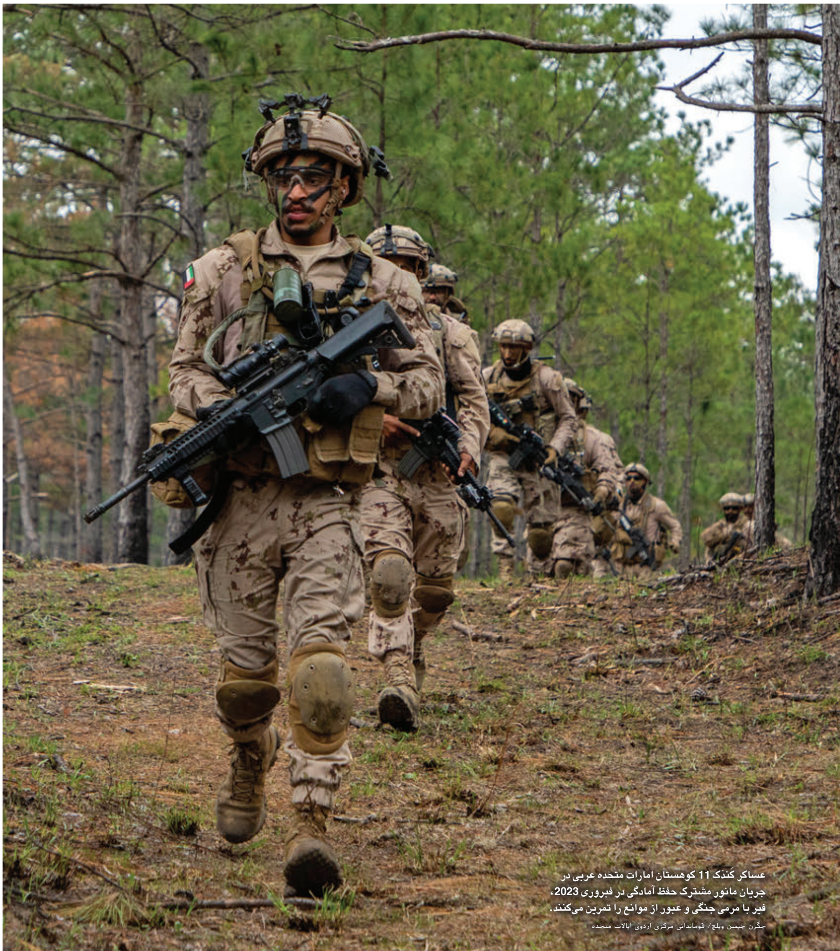
عساکر کُتدک 11 کوهستان امارات متحده عربي در جريان مانور مشترك حفظ آمادگي در فيبروري 2023، فیر با مرمی جنگی و عبور از موانع را تمرین می‌کنند.