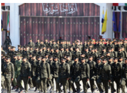
رژه نظامیان کویتی در مراسم فارغ‌التحصیلی در اکادمی نظامی علی الصباح در شهر کویت در فبروری 2022.

ائتلاف تحت هدایت ایالات متحده رخ داد، پروگرام بلندپروازانه‌ای را برای بازسازی کشور و نوسازی تجهیزات قوای مسلح آغاز کرد. کویت، در مسیر رسیده به این هدف، «دفتر بازبانی اضطراری کویت» را برای هماهنگی با دفتر تازه-تاسیس «همکاری بازسازی دفاعی ایالات متحده» که به‌وسیله کارمندان فرقه انجینری اردوی ایالات متحده اداره می‌شد، تشکیل داد. در سال 2017، کویت یک مرکز منظوقی NATO تاسیس کرد، خدمت نظامی را دوباره اجباری کرد و بودجه‌ای 10 میلیارد دلاری برای نوسازی دفاعی، شامل خرید جنگنده‌های پیشرفته، تانک و سیستم‌های دفاعی تا 2026، در نظر گرفت. منابع: خبرگزاری کویت، مرکز معلومات اروپا-خلیج، فرقه انجینری اردوی ایالات متحده.