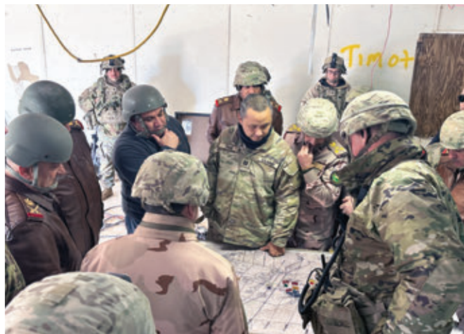
صاحب‌منصب اردوی ایالات‌متحده عملیات تعلیمی را روی نقشه جنگی شرح می‌دهد.

مشابه این مرکز کارآمد در اختیار داشته باشد. چنین مرکزی می‌تواند در ارتقای سطح توانایی‌های ارتش شجاع عراق و تقویت مهارت‌های میدانی آن، از طریق شبیه‌سازی محیط جنگ و تکنیک‌های خاص عوارض زمینی مختلف، نقش‌آفرین باشد. تقویت توانایی‌ها از طریق تعلیم و ایجاد تجربیات میدانی واقعی برای قومندانان و عساکر صورت می‌گیرد. چنین مرکزی می‌تواند تقویت‌کننده مهارت‌های راهبری و تصمیم‌سازی قومندانان در حوزه مدیریت نبرد، چه در سطح جزوتام‌های تعلیم‌گیرنده و چه در سطح کارمندان مرکز که نقش قوای دشمن را بازی می‌کنند، باشد.