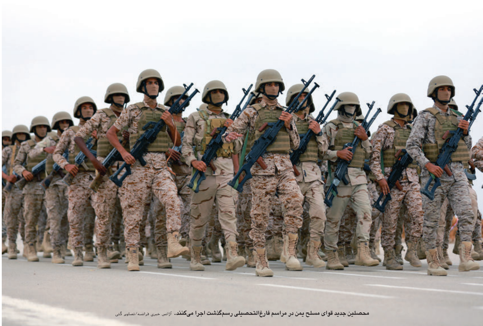
محصّلین جدید قوای مسلح یمن در مراسم فارغ‌التحصیلی رسم‌گذشت اجرا می‌کنند.

«ما، در قوای مسلح یمن، از توانایی‌ها و تجربه عملی صاحب‌منصبان و دیگر پرسونل قوای بحری، دفاع ساحلی و گارد ساحلی یمن برخوردار هستیم. این قوا آمادگی دارند تا، در صورت مجهز شدن به سلاح‌های لازم و منابع دیگر و مستفید شدن از حمایت مادی ضروری، به عملیات‌های مختلف پردازند.»