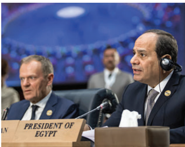
عبدالفتاح السیسی، رئیس‌جمهور مصر، در کنار دانیل توسک، رئیس وقت شورای اروپا، در جلسه پایانی نشست اتحادیه کشورهای عرب-اتحادیه اروپا (2019) حضور یافت. بررسی موضوع تروریسم در آجندای این نشست بود.