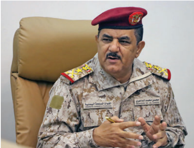
دگر جنرال محسن به بررسی موضوع امنیت در یمن پرداخت. وزارت دفاع یمن

در جریان این جنگ -10 ساله قدردانی نمود. او کوشش‌های «ائتلاف احیای مشروعیت یمن به رهبری عربستان» را که به قوای یمنی در جریان آزادسازی خاک یمن از دست حوثی‌ها کمک کردند، ستود. سازمان‌های خیریه سعودی به ساخت مکتب، شفاخانه، خطوط برق‌رسانی و دیگر زیربناهای ضروری پرداخته‌اند.