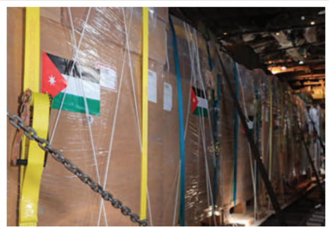
محموله‌ها به بخش بار طیاره C-130 اردن منتقل می‌شود تا به دست مردم غزه برسد.

غزه، طبق تخمین سازمان ملل، در آستانه قحطی قرار گرفته‌اند. یک-ششم اطفال زیر 2 سال در شمال غزه دچار سوءتغذیه شدید هستند. بااین‌که انتقال مواد غذایی را نمی‌توان یک راهکار دائم در نظر گرفت، کمک‌رسانی هوایی قوای مسلح اردن، با همکاری کشورهای دوست و برادر، زمینه انتقال امکانات طبی و کمک‌های بشردوستانه و کاهش رنج قربانیان جنگ را فراهم ساخته است. ♦