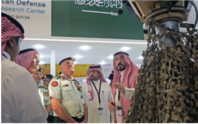
رئيس هيئة الأركان المشتركة للقوات المسلحة الأردنية - الجيش العربي الفريق الركن يوسف الحنيطي يقوم بجولة في الجناح السعودي في معرض قوات العمليات الخاصة.

وجدير بالذكر أن معرض «سوفكس» تأسس في عام 1996 ويُعقد كل عامين، ويهدف إلى تبادل الآراء والأفكار والابتكارات والمتطلبات والفرص لمواجهة التحديات والتهديدات التي تواجه منطقة الشرق الأوسط وشمال إفريقيا. المصادر: سوفكس الأردن، جريدة الدستور الأردنية