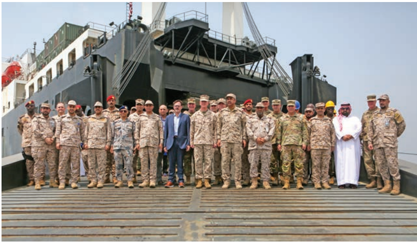
رجال القوات المسلحة الأمريكية والسعودية والزوار يقومون بجولة تفقدية على متن السفينة «سي» التابعة للبحرية الأمريكية خلال يوم كبار الزوار في تمرين «الغضب العارم».