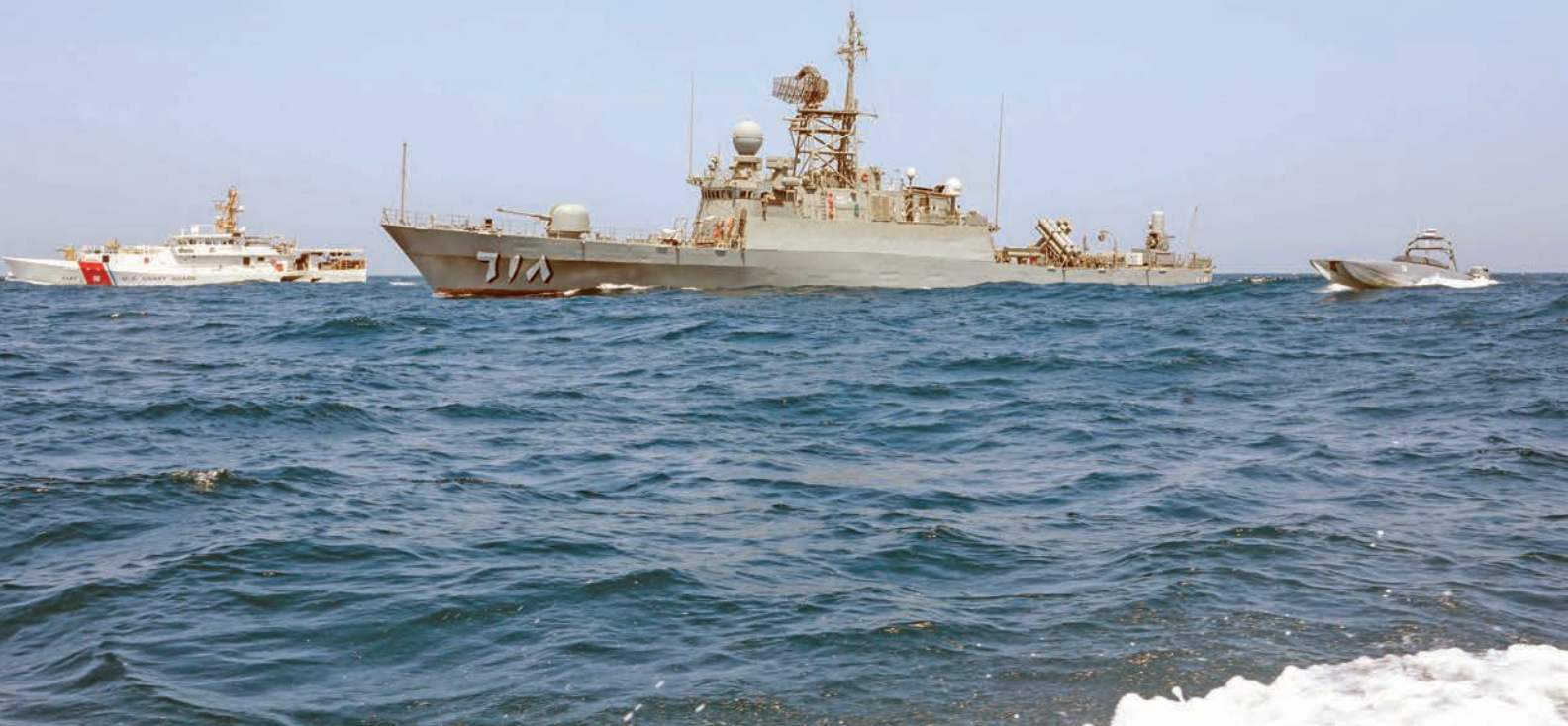
الفرقاطة التابعة للبحرية الملكية السعودية «سفينه جلاله الملك توك» تتدرب مع زورق ومسيرة «ديفيل راي» السطحية التابعين لبحر السواحل الأمريكي خلال فعاليات تمرين «عزم النسر».

انقسم مئات المشاركين في تمرين «عزم النسر» إلى قوات ميدانية تستجيب لمحاكاة حالات الطوارئ، ووحدة مركز قيادة تعمل على صقل قدرتها على الاستجابة لأزمات متداخلة؛ وجميعهم يمتلكون الخبرة في مواجهة التهديدات في منطقة الشرق الأوسط. وشملت مهام التمرين تدمير الصواريخ والطائرات المسيّرة، والتخلص من المتفجرات، واحتواء الهجمات بالأسلحة الكيميائية، ومكافحة الإرهابيين المسلحين، وتفكيك الألغام البحرية، والقيام بعمليات معلوماتية، وإنقاذ المرضى والمصابين من الجنود.