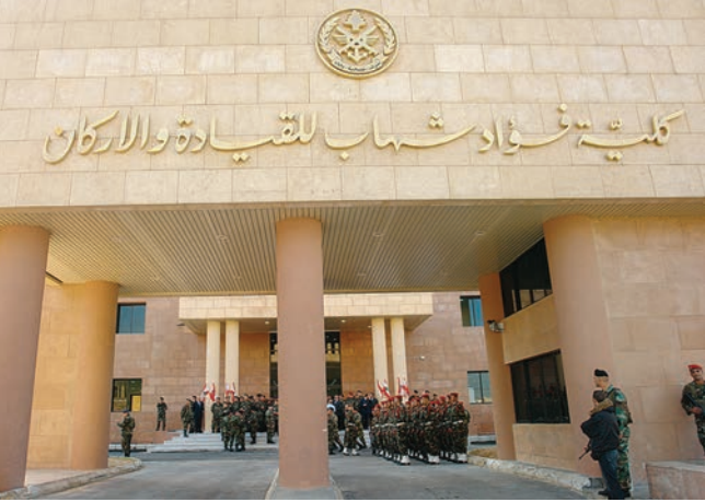
ضباط من الجيش اللبناني يتفنون في تشكيل صباحي في كلية فؤاد شهاب للقيادة والأركان. الجيش اللبناني

وكان منوط به وبأقرانه الضباط فرض سلطة الدولة في بيئة تحكمها الميليشيات وأجندات خارجية غايتها القضاء عليها. وانتصرت شجاعة هؤلاء الضباط الشباب ووطنيتهم على وحشية سفكة الدماء وأجندات الميليشيات لينهض علم لبنان من تحت الأنقاض ويسود حكم القانون والسلام.