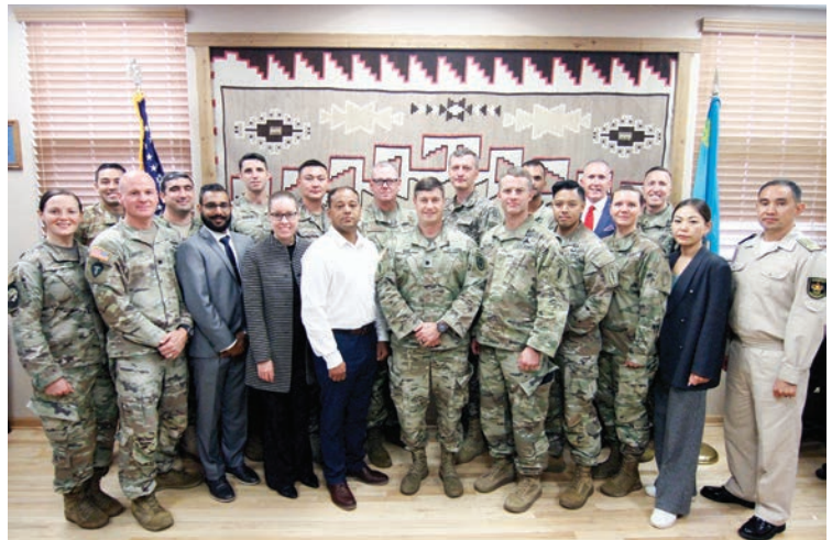
قوات كازاخية تزور ولاية أريزونا للقاء ممثلي القيادة المركزية الأمريكية والحرس

وقال اللواء مولينبيك: "مستوى التوافق العملي المستمد من تمارين كهذا التمرين ذو أهمية معنوية عظيمة؛ إذ يمنحنا برنامج شراكة الولايات الخاص بالحرس الوطني الفرصة للعمل معاً بتعبوي واستراتيجياً وهذا لا يفيد دولنا الشريكة فحسب، بل يفيد قواتنا المسلحة رجالاً ونساءً أيضاً." المصدر: الحرس الوطني لولاية أريزونا