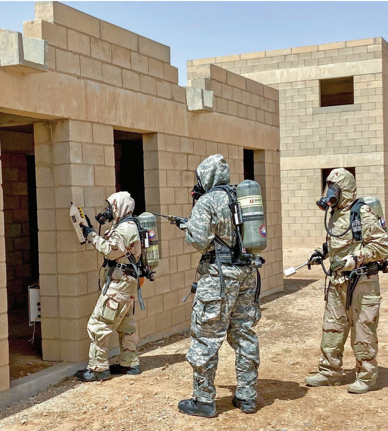
جنود سعوديون وأمريكيون يتدربون على مكافحة الأسلحة الكيميائية والبيولوجية والإشعاعية والنوية خلال فعاليات تمرين «عزم النسر».