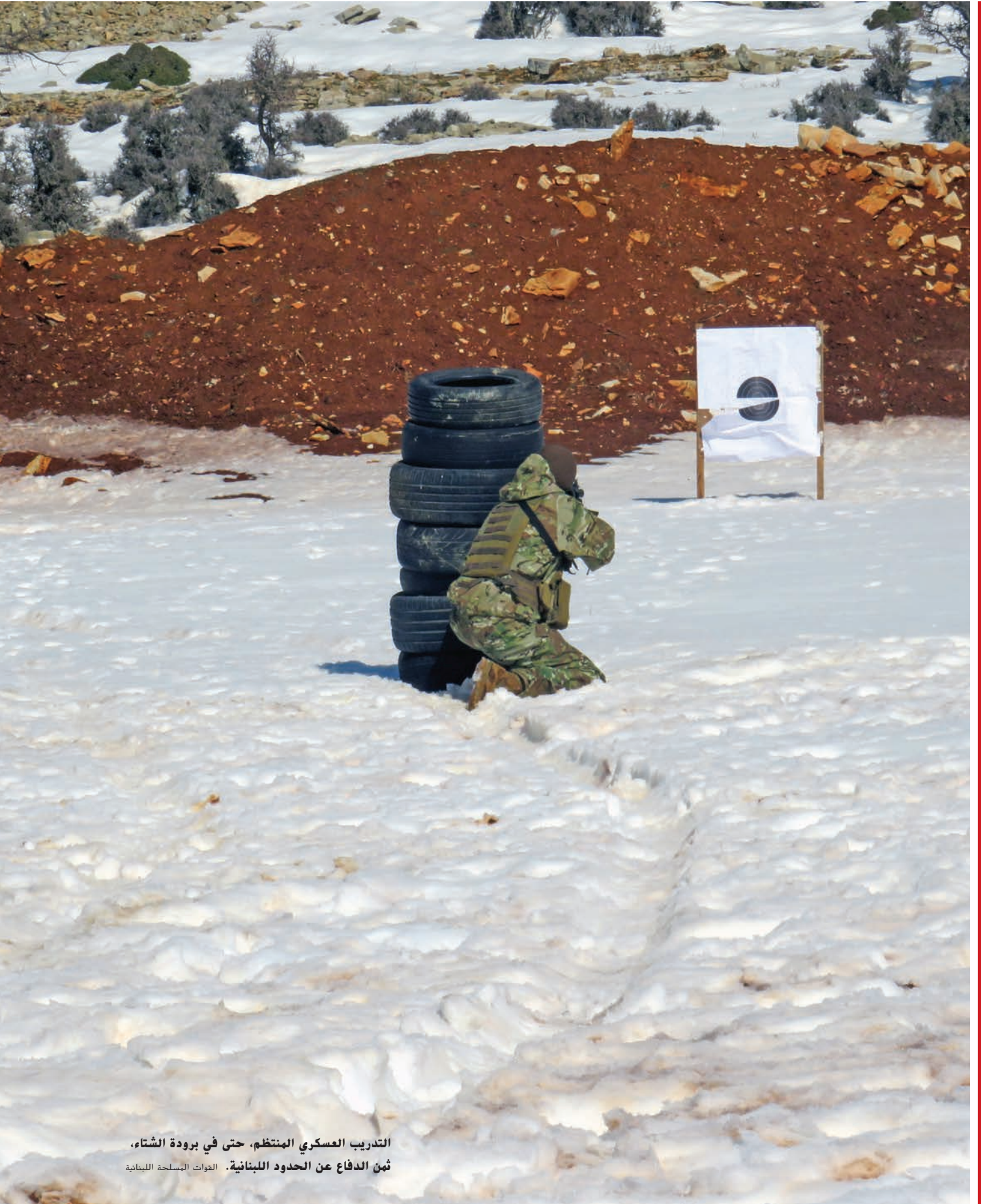
التدريب العسكري المنتظم، حتى في برودة الشتاء، ثمن الدفاع عن الحدود اللبنانية. القوات المسلحة اللبنانية