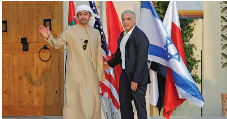
يائير لبيد، وزير خارجية إسرائيل، يرحب بالشيخ عبد الله بن زايد آل نهيان، وزير خارجية الإمارات، في مؤتمر قمة عُقد في آذار/مارس 2022.

وكما كتب الدكتور ثاني الزويدي، وزير الدولة الإماراتي للتجارة الخارجية، يقول: "على مدى العامين الماضيين، أثبتت الإمارات وإسرائيل ما يمكن تحقيقه حين نحينا ما بيننا من انقسامات وخلافات." المصادر: البيان، سي إن إن، جيروزاليم بوست