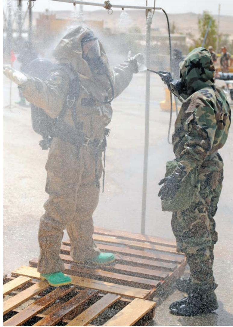
القوات الأردنية والأمريكية تتدرب على إزالة التلوث خلال تدريب لمواجهة الهجمات الكيميائية والبيولوجية والإشعاعية والنووية.

ولكن يسير التقدم بخطوات بطيئة، فحين يتعلق الأمر بتضييق الخناق على شحنات العوامل البيولوجية والكيميائية (المواد التي يمكن أن تسبب في أضرار فادحة بكميات صغيرة)، فإن ما يقرب من 95% من البلدان لم تسن أي قوانين لوضع قيود على صادراتها. ♦