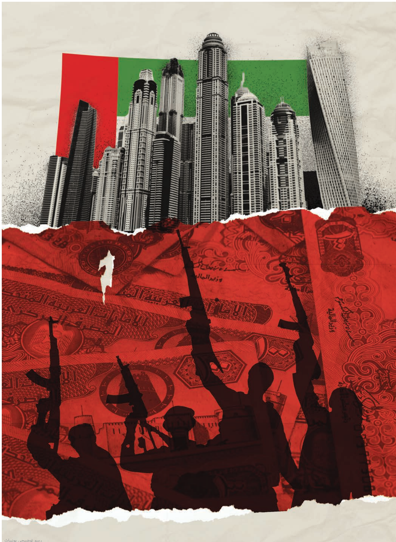
رسم توضيحي يونيباث