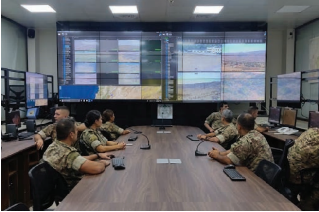
القوات المسلحة اللبنانية تعمل على دمج نظام إدارة حدودها لزيادة وعيها بالوضع الأمني على الحدود. القوات المسلحة اللبنانية

كما توفر القوات المسلحة اللبنانية الأمن في المعابر الرسمية على الحدود الشمالية والشرقية، وفي المعابر البحرية وفي مطار رفيق الحريري