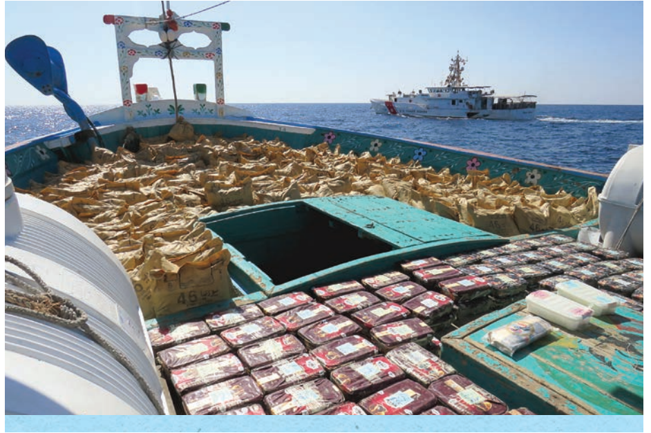
سفينة تابعة لخفر السواحل الأمريكي تضبط كمية مخدرات على متن قارب صيد في خليج عُمان.

يوم 8 تشرين الثاني/نوفمبر 2022، نجحت سفينة تابعة للبحرية الأمريكية وأخرى تابعة لخفر السواحل الأمريكي في طريقهما إلى اليمن في اعتراض سفينة إيرانية تحمل مواداً تُستخدم في تصنيع الأسلحة. فعثر المحققون على 70 طناً من كلورات الأمونيوم تُستخدم في تصنيع وقود الصواريخ الباليستية و100 طن من سماد اليوريا القابل للانفجار.