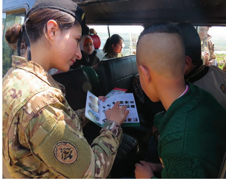
جنديّة لبنانيّة تنفذ حملة مدنيّة عسكريّة للتوعية بمخاطر الألغام.