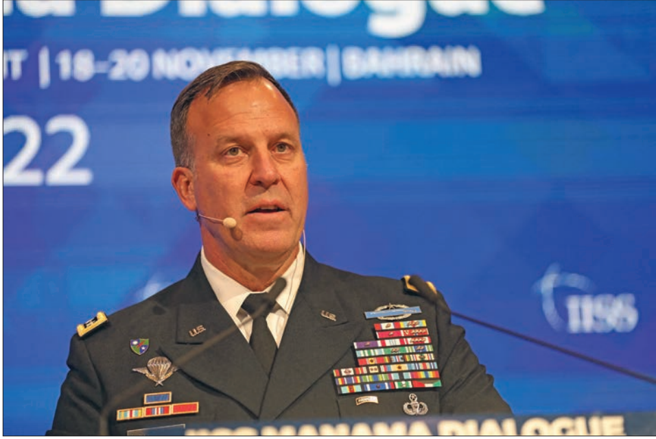
الفريق أول مايكل كوربلا، قائد القيادة المركزية الأمريكية

مخر مركب شراعي عُباب البحر في مكان ما في الخليج العربي، على مسيرة 50 كيلومتراً تقريباً من الساحل. يبدو من الخارج كأنه سفينة من آلاف السفن الأخرى التي تبحر في تلك البحار كل يوم. لكن هنالك فرق! فهذا المركب ينقل آلاف الكيلوجرامات من المتفجرات إلى المنطقة. ولا يمكن اكتشاف هذه المتفجرات من خلال أي ملاحظة خارجية. وفجأة تشق سفينتان أمواج الخليج بسرعة 70 عقدة في الساعة. وصار الرجال المتواجدون على متن المركب محاصرين حتى قبل أن يستوعبوا ما يحدث. وشعروا بالحيرة والارتباك مع اقتراب السفينتين، إذ لا يمكنهم رؤية أي كوادر بشرية على هاتين السفينتين. وخلال 30 دقيقة، وصل زورق دورية لتطويقهم واعتقالهم.