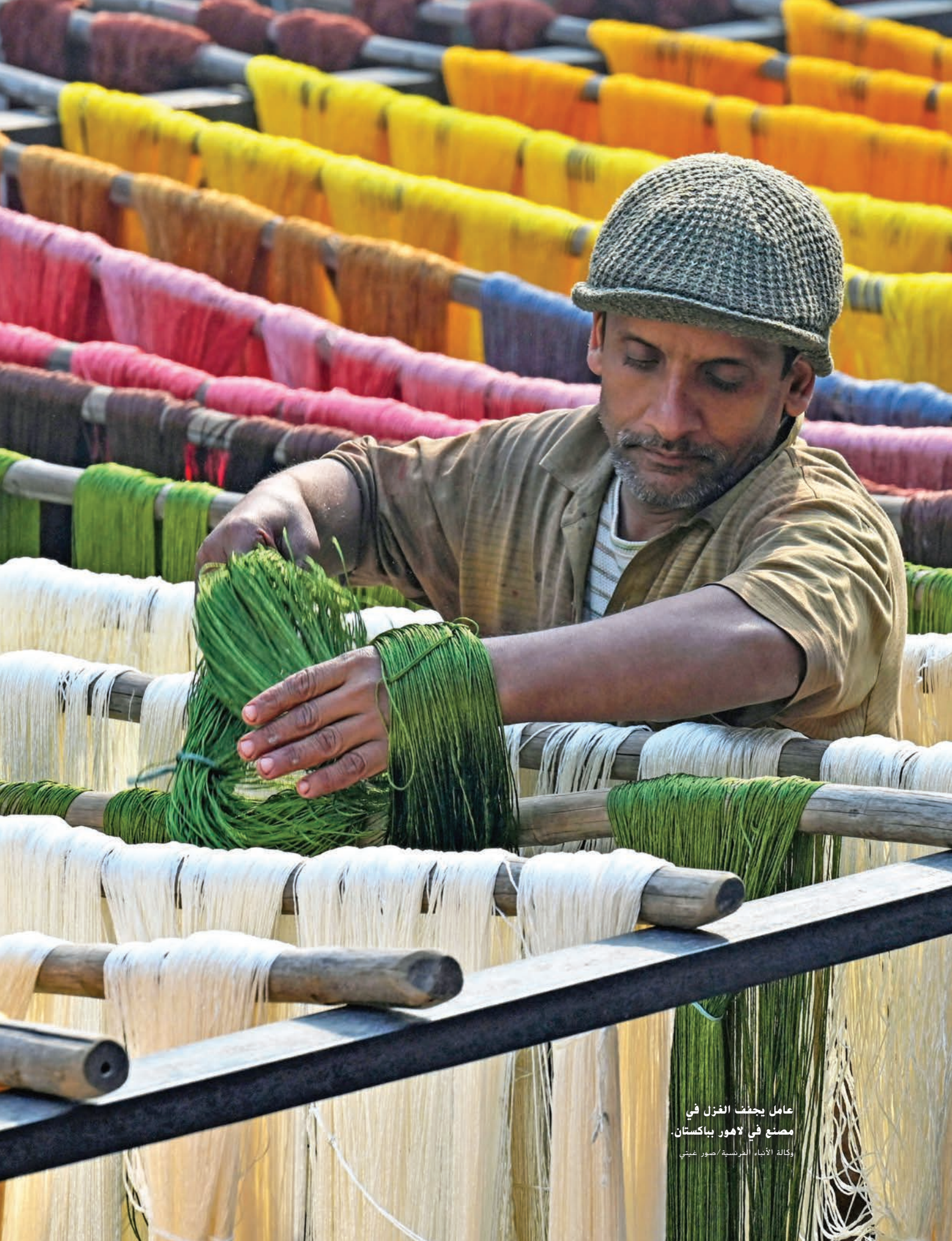
عامل يحفف الغزل في مصنع في لاهور باكستان.