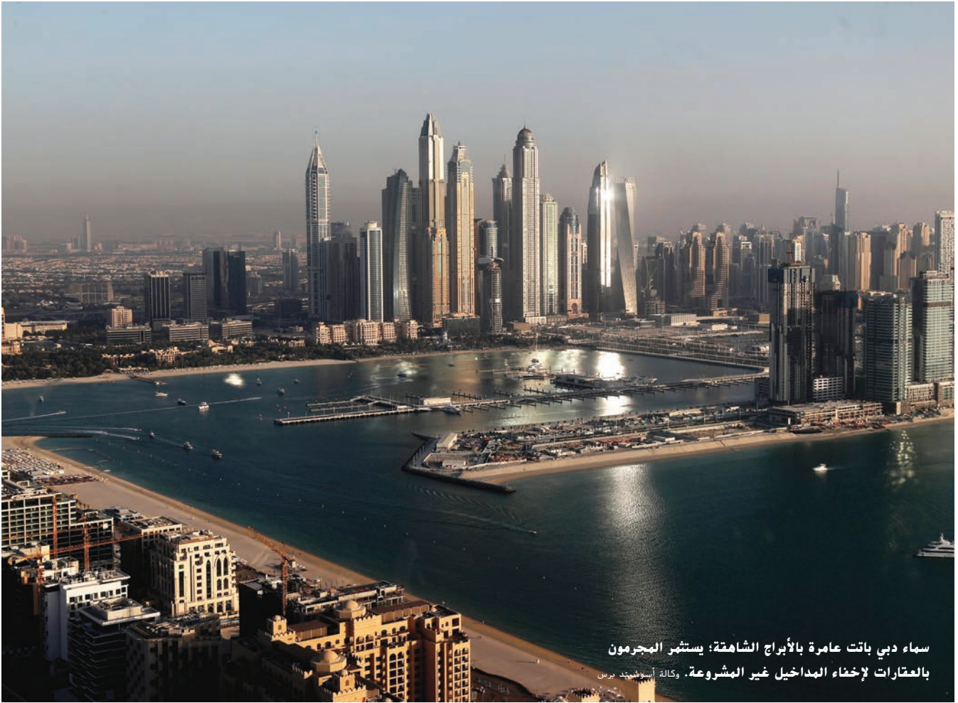
سما دبي باقت عامرة بالأبراج الشامخة؛ يستثمر المجرمون بالعتارات لإخفاء المداخل غير المشروعة.

والخاص من ورقتها الاستشارية بشأن تبادل المعلومات، وستتري تلك الورقة التشريعات الجديدة.