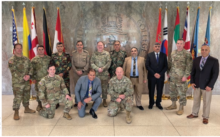
الوفد العراقي يزور جامعة الدفاع الوطني في فرجينيا.

والتوعية الوطنية بوزارة البشمركة. كما رافق الوفد مديان يعملان في الأمن العراقي: الدكتور حسين علاوي، مستشار رئيس الوزراء العراقي، والسيد صباح نوري النعمان، المتحدث باسم جهاز مكافحة الإرهاب العراقي ومستشار قائد الجهاز. من الجدير بالذكر أن هذا الحدث كان جزءاً من سلسلة من التبادلات لزيادة التعاون وفهم التهديدات المعادية المتعلقة بالمعلومات. كانت المحطة الأولى هي مقر القيادة المركزية الأمريكية بولاية فلوريدا، حيث أجرى العراقيون مناقشات مع كبار قادة الجيش الأمريكي وشاهدوا عمليات الإنترنت والعمليات الإعلامية التي تجريها القيادة. وتلقوا تطمينات بأن سلام العراق وأمنه ما يزالان يمتلآن أولوية قصوى لشركاء الولايات المتحدة.