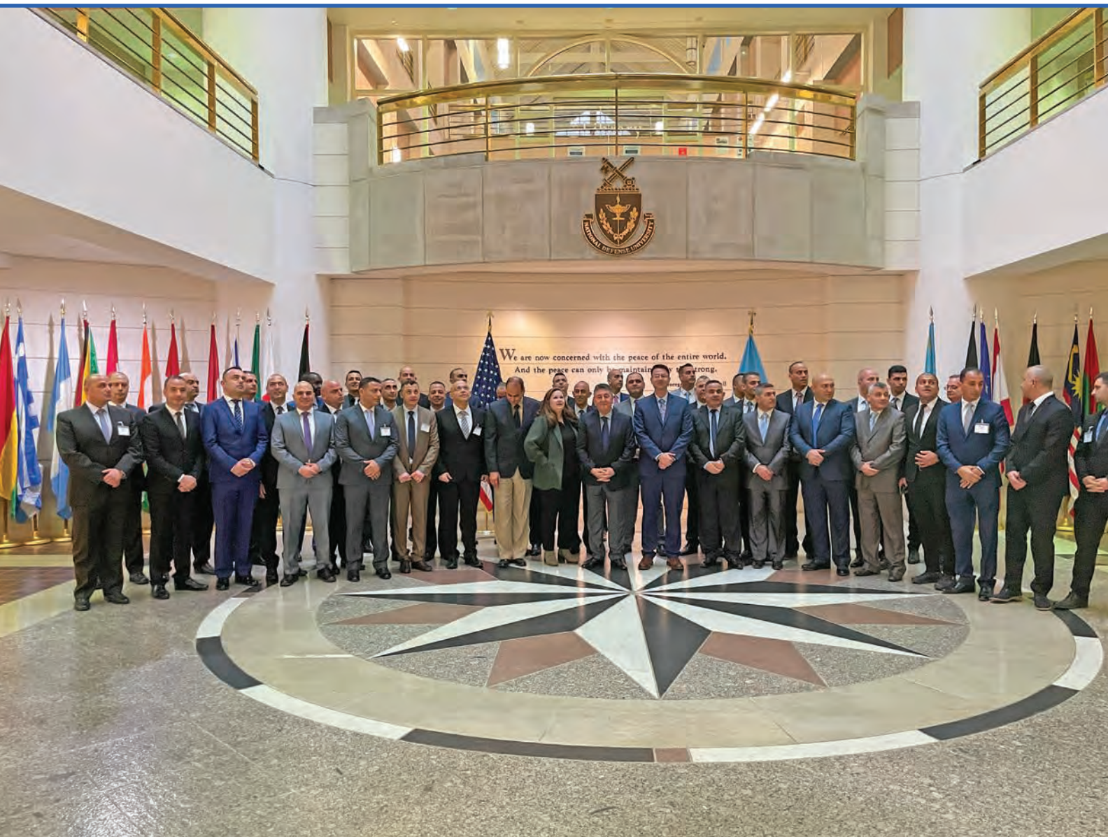
اشتراک صاحب‌منصبان لبنانی کالج ستاد و قومندانی فواد شهاب در صنوف پوهنتون دفاع ملی ایالات متحده، در سال 2022.

پروگرام تعلیمی دوره‌های ستاد با هدف تربیت صاحب‌منصبان قومندان و آماده‌سازی آنان برای پذیرش مسئولیت قطعات نظامی کلان یا فعالیت ستادی تدوین می‌شود. این پروگرام تعلیمی همه ترفندها و میکانیزم‌های تصمیم‌گیری نظامی در سطح تاکتیکی و عملیاتی را که یک قومندان برای پلان‌گذاری و ارزیابی موقعیت در همه مراحل و سطوح ضرورت دارد، شامل می‌شود. به این ترتیب قومندانان از توانایی گرفتن تصمیمات صحیح برای حل مسائل تاکتیکی یا عملیاتی، رسیدگی به مشکلات امنیتی و ضدتروریستی، یا مدیریت بحران‌های گسترده برخوردار می‌شوند.