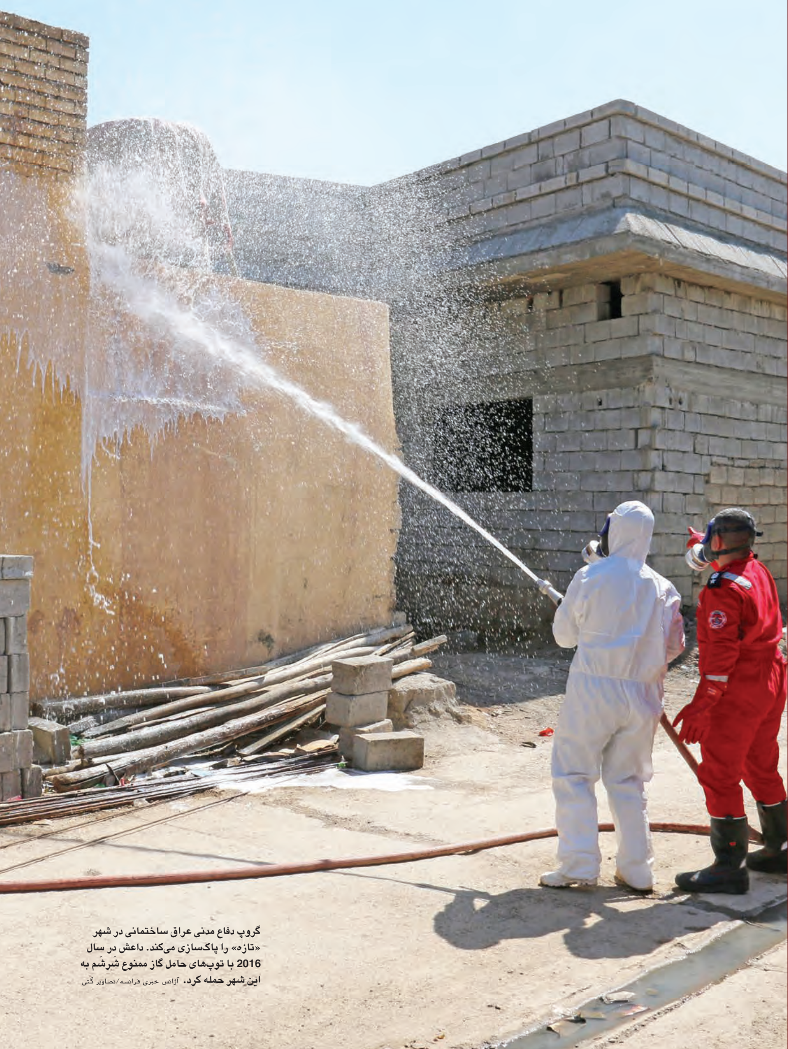
گروپ دفاع مدنی عراق ساختمانی در شهر «تازه» را پاکسازی می‌کند. داعش در سال 2016 با توپ‌های حامل گاز ممنوع شورش به این شهر حمله کرد.