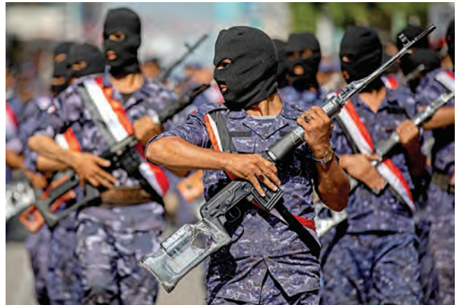
قوای امنیتی یمن در رسم گذشت گرامی‌داشت سالگرد انقلاب 1962 و تاسیس جمهوری یمن، در تعز رسم گذشت به نمایش می‌گذارند (سپتامبر 2022).