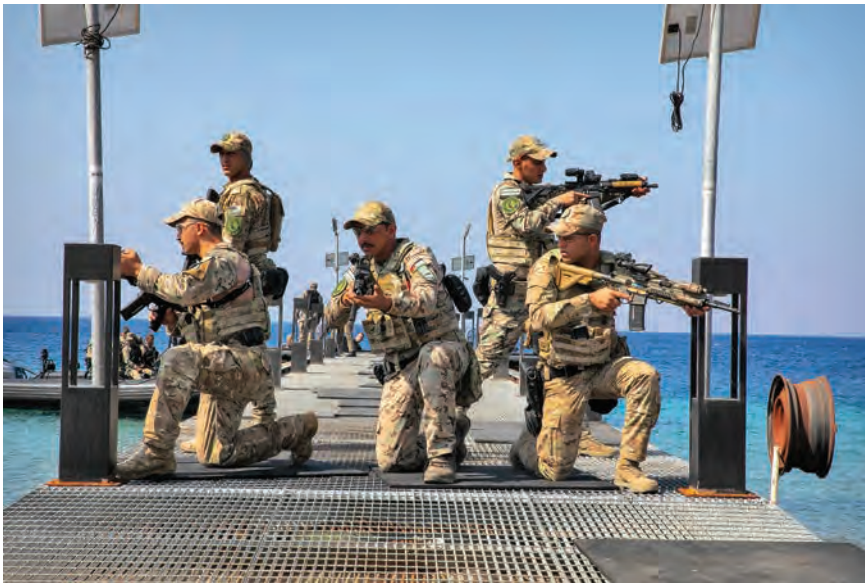
قوای اردنی در یک گارد نیمه ضدتروریسم در لنگرگاهی در عقبه.

وی علاوه کرد که "به این تهدیدها، از طریق سناریوهای طرح شده برای این منظور و در یک ماحول عملیاتی مشترک و مرکب از چندین گروه نظامی و کشور مطابق دوکتورین‌ها نظامی پذیرفته شده از سوی کشورهای عضو، پاسخ داده می‌شود. بعضی کشورها اشتراک مستقیم و فعال در عملیات‌ها داشتند، از جمله اردن، ایالات متحده، عربستان سعودی و عراق، و بعضی دیگر در این مانور منحصی ناظر اشتراک کردند تا بتوانند در فضای عمومی مانور تجربه کسب کنند." در اواسط مانور، سمینار رهبران ارشد، قوماندانان اشتراک کننده از بیش از ده کشور را به خود جلب کرد. گفتگوهای این سمینار بالای موضوعات حیاتی خط اول جنگ در شرق میانه تمرکز داشت. کویته‌ها بالای دفاع منسجم هوایی و موشکی تمرکز داشتند، سعودی‌ها بالای خنثی کردن مواد