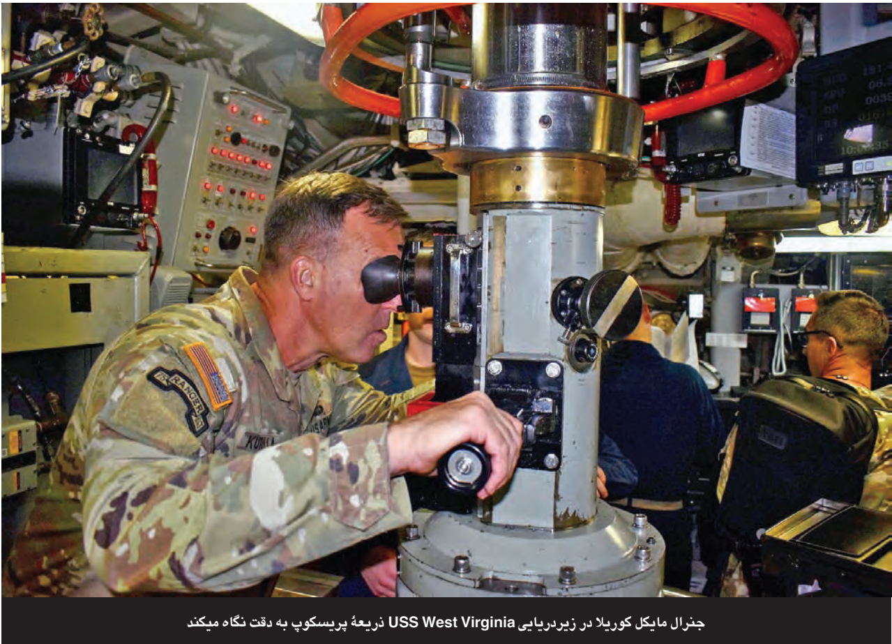
جنرال مایکل کوریل در زیردریایی USS West Virginia ذریعه پریسکوپ به دقت نگاه میکند

~ جنرال مایکل کوریل قوماندان مرکزی ایالات متحده