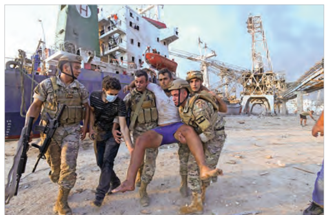
قوای لبنانی به یکی از شهروندان بیروتی که در جریان انفجار بندر متضرر شده است، کمک می‌کنند.