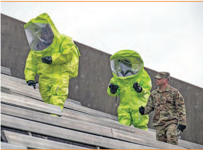
قوای سرویس صحتی اردوی قطر و قطعه سلاح‌های کشتار جمعی در کنار قوای ایالات متحده تعلیم می‌بینند (2022). قطر به اقدامات خود در قسمت همکاری‌های چندملیتی برای مقابله با تهدیدات امنیتی می‌بالد.

از من اکثراً درباره بازی توازن قطر سوال می‌کنند. از کدام طریق می‌توان روابط دفاعی، سیاسی یا تجاری را با شرکای خارجی دارای منافع مختلف حفظ نمود؟ باید تاکید کنم که قطر صرفاً بازیگر نیست. ما هویت و کمبودات خود را شناخته‌ایم و می‌دانیم که نقشه راه متمایز خود را در قالب «چشم‌انداز ملی قطر 2030» طراحی و تطبیق نموده‌ایم. شخصیت ما برای همه شناخته شده است. در روند تعامل با دولت قطر، طرف خود را دقیقاً می‌شناسید: یک شریک صادق و مطمئن که هیچ‌گاه از گفتن حقیقت به شما دریغ نمی‌ورزد.