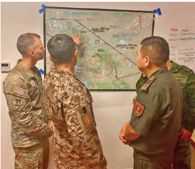
بخش مطالعه شرکای ائتلاف. جگرن فیلیپ بلانچارد/گارد ملی اردوی ایالات متحده

انتصاب 17 عسکر موظف برای اجرای وظیفه در همکاری منطوقی توسط دگروال کخارمون آشیلوف، قوماندان اردوی ازبک، مؤید این نکته بود که این مانور، یک مانور ارزشمند است که می‌تواند اشتراک کنندگان را به توافق برای مقابله با تهدیدات امنیتی سوق بدهد. وی ازبکستان را یکی از بازیگران فعال و مهم در تأمین امنیت منطقه دانست.