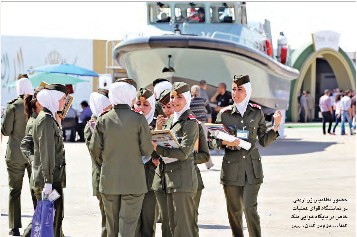
حضور نظامیان زن اردنی در نمایشگاه قوای عملیات خاص در پایگاه هوایی ملک عبدا... دوم در عمان.