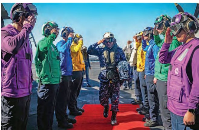
بریدجنرال قوای بحری محمد یوسف العصام از ناو طیاره بر U.S.S. Theodore Roosevelt دیدن کرد. درباردار از حامیان سرسخت قوای چند- ملیتی حاضر در خلیج عربی است.

گذاشت. بینش استراتژیکی عالی جناب این بود که پادشاهی بحرین باید از قوای بحری پیشرفته‌ای برای محافظت از دستاوردهای کشور برخوردار باشد. این قوا در نیمه دوم قرن 20 دچار تحول اساسی شد. وظیفه اصلی قوای بحری دفاع از آبهای سرزمینی و تجاری پادشاهی، حفظ ثبات و تمامیت ارضی و مقابله با حملات احتمالی است.