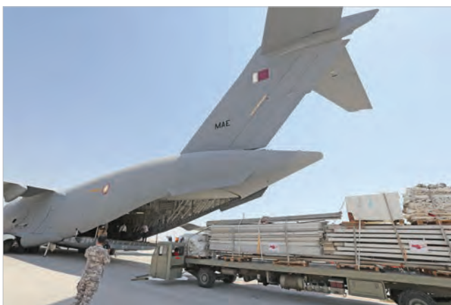
طیاره قطری در حال انتقال شفاخانه صحرائی و امکانات صحتی به لبنان، بعد از وقوع انفجار در بندر بیروت.

از طرف دیگر، مقامات لبنان علل و عامل این حادثه را بی‌صلاحیتی، فساد و بی‌توجهی اداری و نظارتی می‌دانند. مسئولین مربوطه تا فعلاً درباره دلیل وجود این مقدار زیادی از امونیم نایتريت در بندر اظهار نظر نکرده‌اند. هرچند مقامات لبنان این انفجار را غیرمترقبه می‌دانند، حمله با سلاح‌های