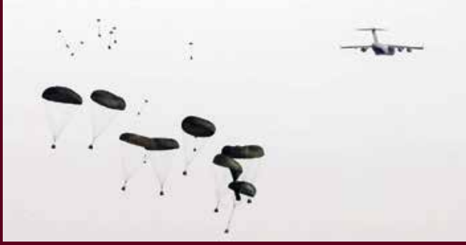
طائرة تلقي إمدادات لتعزيز القوات خلال فعاليات التمرين.