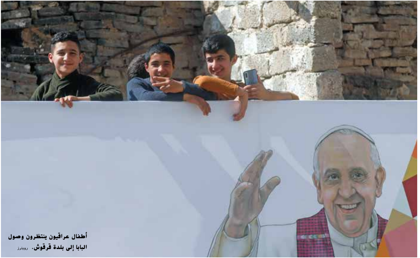
أطفال عراقيون ينتظرون وصول البابا إلى بلدة فرقوش. روبرت

المسلمين، ممّا زرع الرعب في قلوب السكان وبدأ الناس يتركون ممتلكاتهم ويهربون خارج الموصل. ولم يطق المسلمون العيش في كنف هذا الإرهاب الذي طال أحوثهم وجيران طفولتهم، فقرروا الهروب أيضاً. فقد حوّل الإرهاب هذه المدينة الجميلة إلى خرائب وأنفاق ومبانٍ مهدمّة، ولم يسلم من إرهابهم حتى جامع الحدياء [النوري] الأثري. كل هذه الأحداث جعلت زيارة قداسة البابا مهمة لزرع الطمأنينة في قلوب سكان الموصل الذين ما زالوا يعيشون بعيداً عن بيوتهم، ورسالة للعالم بأنّ الإرهاب بات مهزوماً مدحوراً في «أم الربيعين». وشاهد العالم أجمع إقامة القدّاس وسط الموصل على أطلال إحدى الكنائس التي دمرها داعش. وبرأيي الشخصي، إنّ ما جعل زيارة قداسه للموصل متميّزة هو كلماته التاريخية التي دعا من خلالها المسيحيين إلى العودة إلى المدينة؛ فقال مخاطباً العالم: «نؤكد قناعتنا بأنّ الأخوة أقوى من صوت الكراهية والعنف»، و «يجب تجاوز الانتماءات الدينية للعيش بسلام ووثام»، و «من المؤسف أنّ بلاد الحضارات تعرّضت لهذه الهجمة الإرهابية».