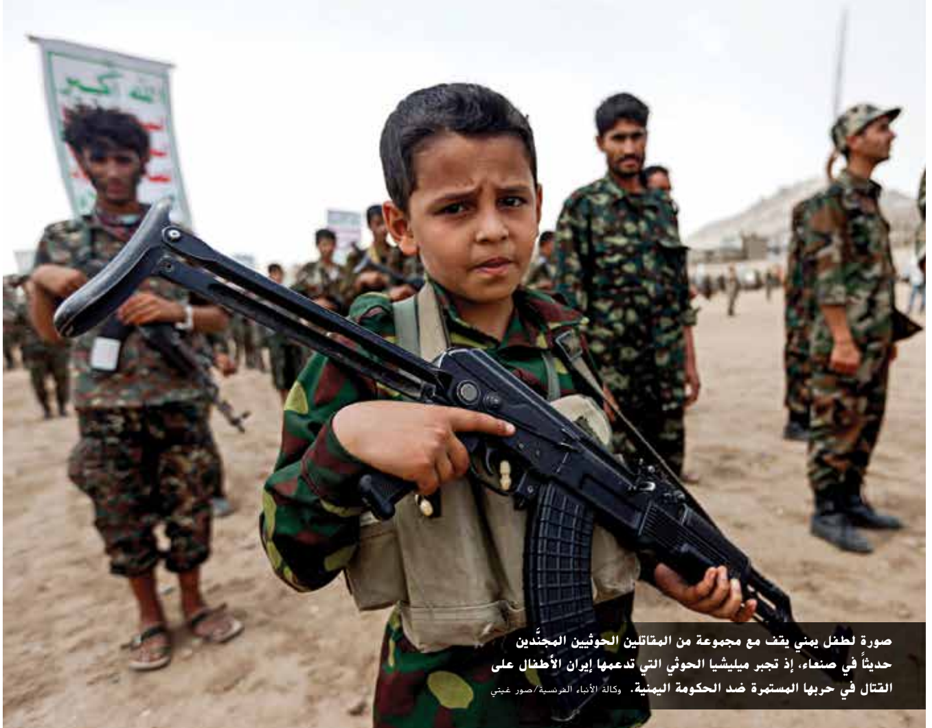
صورة لطفل يمني يقف مع مجموعة من المقاتلين الحوثيين المجهّدين حديثاً في صنعاء، إذ تجبر ميليشيا الحوثي التي تدعمها إيران الأطفال على القتال في حربها المستمرة ضد الحكومة اليمنية.

ولا ريب أنَّ هذا التصعيد سيؤدي إلى اتساع رقعة الحرب ويهدد النسيج الاجتماعي والسلام المدني وقيم التعايش بين اليمنيين على مدار عقود قادمة، وينذر بخلق جيل من متطرفي الفكر الذين لا يمكن السيطرة عليهم وتجنيدهم في معارك لا طائل من ورائها لخدمة المشروع التوسعي الإيراني وأطماع إيران في المنطقة.