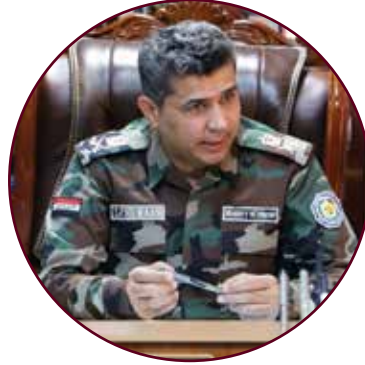
اللواء سعد معن

اللواء سعد معن: إن إقامة القُدَّاس في «كنيسة سيدة النجاة» وسط بغداد أعطى صورة حقيقية لواقع العراق وانتصار الحق على الباطل وانتصار السلام على الإرهاب. كما أنها رسالة للعصابات الإرهابية تفيد أن العراقيين خبروا التعايش السلمي منذ آلاف السنين ولا يمكن هزيمتهم أمام الفكر الظلامي. كلنا يتذكر الهجوم الإرهابي على «كنيسة سيدة النجاة» في عام 2010، الذي كان يُراد به إشعال حرب بين المسلمين والمسيحيين في العراق ومصر لتعم كل دول المنطقة؛ إذ طالب الإرهابيون في اتصال هاتفي بإحدى الفضائيات بإطلاق سراح محتجزة مصرية في الكنيسة القبطية، وكان المتصل يتحدث اللهجة المصرية؛ ولا شك أنها قضية افتعلها الإرهابيون لإشعال الفتنة الطائفية. فقد اقتحمها خمسة انتحاريين من تنظيم دولة العراق الإسلامية الإرهابي في أثناء القُدَّاس، وكان في نيتهم قتل المصلين ونشر المشاهد الدامية على صفحات وسائل التواصل الاجتماعي فيما كان العراق يستعد لاستضافة مؤتمر القمة العربية. بيد أن شجاعة القوات الأمنية أفضلت مخطط الإرهابيين واستطاعت تحرير معظم الرهائن بعد استشهاد نحو 50 مواطناً في هذا الهجوم الوحشي. وقد جاءت زيارة قداسته لتؤكد للعالم أن العراق آمن وأن «كنيسة سيدة النجاة» دحرت الإرهاب وما زالت أبوابها مفتوحة للمصلين. وكان عمل القوات الأمنية والمواطنين رائعاً لإنجاح القُدَّاس في الكنيسة التي كانت تحوم في سقوفها أرواح الشهداء الأبرار محتفية بوجود قداسة البابا. وقد حضر الكثير من المسلمين القُدَّاس ليعبروا عن دعمهم لإخوانهم المسيحيين وليرحبوا بضيف العراق الكبير وصدیق السلام؛ فلهذه الكنيسة التاريخية رمزية كبيرة عند العراقيين، إذ يقصدها الناس من جميع الطوائف لإيقاد الشموع والتمتع بسكينة وقدسمة المكان.