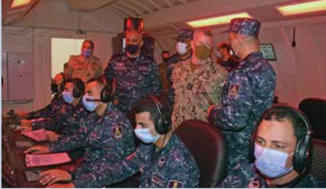
الفريق بحري آنذاك صمويل ببارو، قائد القوات البحرية الأمريكية، الأسطول الأمريكي الخامس، يتحدث مع رجال البحرية المصرية خلال زيارة إلى الإسكندرية في نيسان/أبريل 2021. البحرية المصرية

قال الفريق بحري آنذاك صمويل ببارو، قائد القوات البحرية الأمريكية، الأسطول الأمريكي الخامس: "تجسدت اليوم لحظة تاريخية بدخول مصر في تحالفنا الدائم؛ فمصر شريك مهم في ضمان الاستقرار في المنطقة، ويشرفنا الترحيب بشراكة مصر في مهمتنا التي تركز على جعل المنطقة والعالم أكثر أماناً." والقوات البحرية المختلطة عبارة عن شراكة بحرية متعددة الجنسيات تتكون من ثلاث قوات مهام، وغايتها تعزيز الأمن في قوس بحري يمتد من الخليج العربي إلى البحر الأحمر، وتعمل على مكافحة القرصنة وتهريب الأسلحة والمخدرات والإرهاب والجرائم الأخرى. المصادر: وزارة الدفاع المصرية، القوات البحرية المختلطة، الأهرام