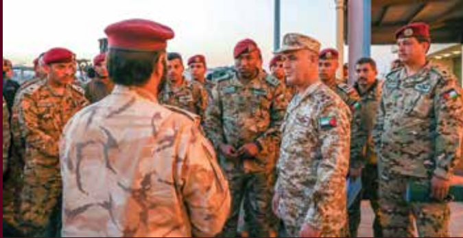
القوات القطرية والأردنية تتجمع خلال فعاليات التمرين.