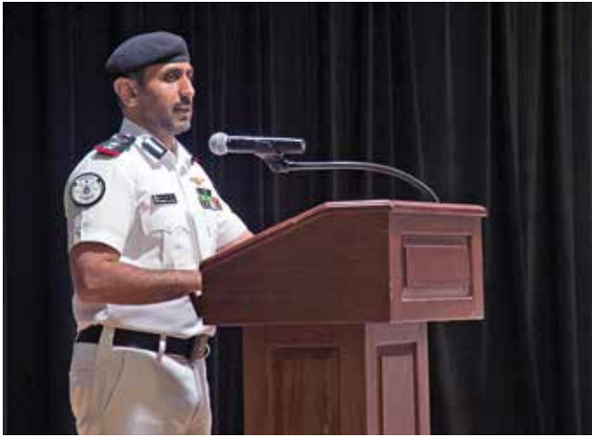
العقيد الركن بحري مبارك علي الصباح يلقي كلمته خلال حفل تغيير القيادة بعد فترة قيادة ناجحة لقوة الواجب المختلطة «152».

العقيد الركن بحري الشيخ مبارك علي الصباح، خفر السواحل الكويتي