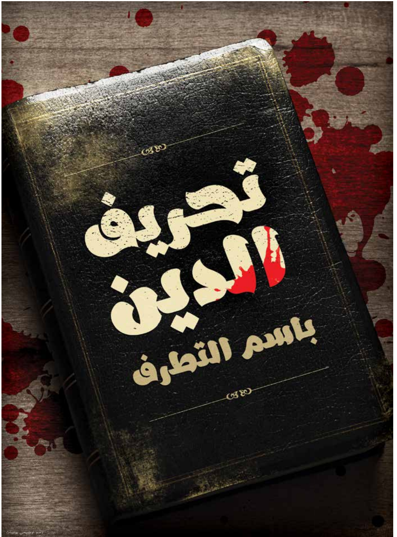
رسم توضيحي يونيبات