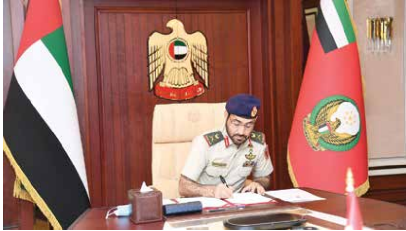
اللواء الإماراتي مبارك سعيد بن غافان الجابري يوقع اتفاقية مع الأردن في نيسان/أبريل 2021.