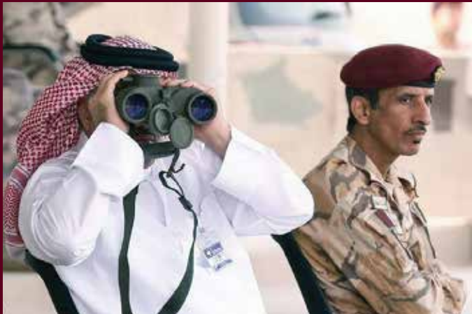
القادة القطريون يتابعون المرحلة الختامية من التمرين.