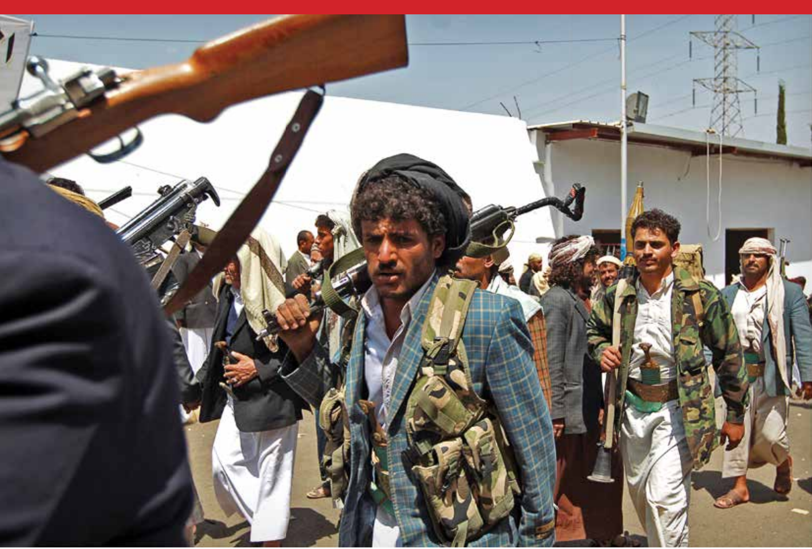
مسلمون من قبائل يمنية يتجمعون بالقرب من صنعاء. بناء الأوطان يقتضي تقديم الولاء للمواطنة على الولاء للقبيلة. جيني اميدجز