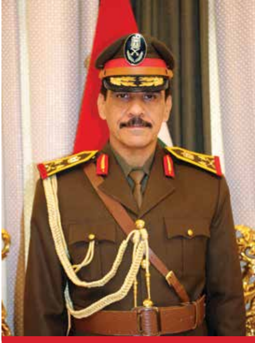
وزارة الدفاع العراقية

هدوء اللافت للنظر أثناء احتدام المعارك ينم عن حنكته القيادية، وثقة بالنفس تستحق الثناء بين القادة الميدانيين؛ تواضعه ورفعة أخلاقه جعلاه محط احترام الجنود والقادة. يتفقد قطاعات العمليات ويتابع شخصياً طلبات الضباط والمراتب؛ ذلك هو الفريق أول عبد الأمير رشيد يار الله، رئيس أركان الجيش العراقي.