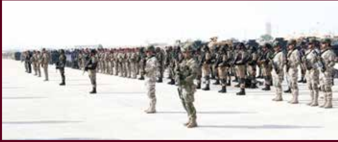
القوات المشاركة في تمرين «الحارس المنيع» تقف بالاستعداد.