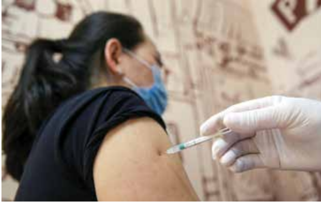
مواطنة تتلقى لقاح «كازفاك» الكازاخي في أحد مراكز التسوق بألماتي في نيسان/أبريل 2021.

في إطار حرصها على تقليل اعتمادها على بلدان كروسيا، باتت كازاخستان واحدة من البلدان القليلة في العالم التي تنجح في ابتكار لقاحها المضاد لفيروس كورونا (كوفيد-19).