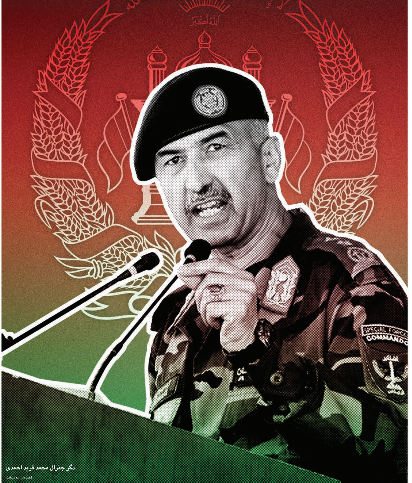
دگر جنرال محمد فرید احمدی تصاویر یونیناٹ