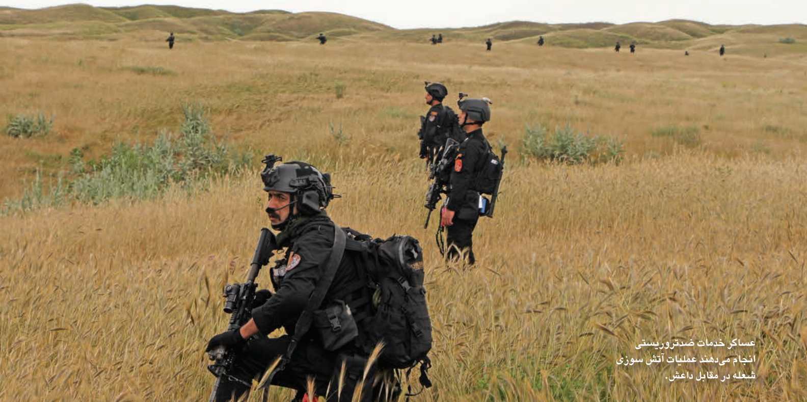
عساکر خدمات ضدتروریستی انجام می‌دهند عملیات آتش سوزی شعله در مقابل داعش.