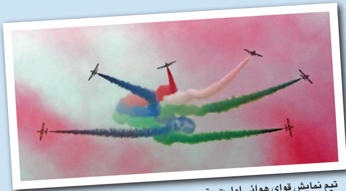
تیم نمایش قوای هوایی امارت متحده عرب الفرسان آسمان را در جریان نمایش هوایی کویت رنگ آمیزی.

این نمایش همچنین فرصتی را برای تولید کنندگان فراهم کرده تا بتوانند