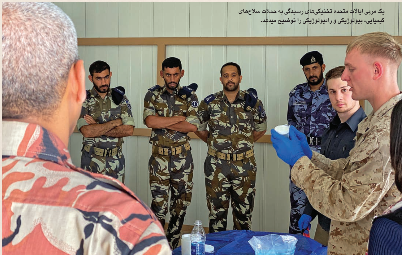
یک مربی ایالات متحده تکنیکی های رسیدگی به حملات سلاح های کیمیایی، بیولوژیکی و رادیولوژیکی را توضیح میدهد.