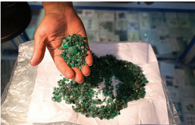
افغانستان ذخایر غنی معدنی دارد بشمول زمره، اما نیازمند شدید سرمایه گذاری خارجی است تا صنعت معادن خود را مدرن بسازد.

"این استراتژی جدید بر حمایت امریکا از خودمختاری و استقلال کشورهای آسیای تاکید میکند. این از رشد همکاری منطقوی میان آنها حمایت می‌کند و اقدامات مثبت برای اصلاح سیاسی و اقتصادی را تصدیق می‌کند. این همچنان از توسعه روابط میان دولت‌های آسیای میانه و افغانستان حمایت میکند. این بر اهمیت اشتراک با دولت‌های منطقه تاکید دارد تا پیشرفت در مورد موضوعات حساسی چون حقوق بشر و آزادی مذهبی بوجود آید."