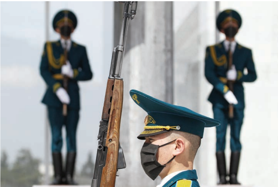
یک گارد تشریفاتی در قیرغیزستان اقدامات وقایوی برای جلوگیری از شیوع مرض می‌گیرد. روبرت

"کاری که شما امروز انجام می‌دهید، مایه وطن‌دوستی، تشویق و عزت همه ماست." وزیر اظهار نمود. "وزارت دفاع کویت در امر افزایش توانمندی‌های تخنیکی و بشری برای حمایت از تلاش‌های کشور ما کار می‌کند."