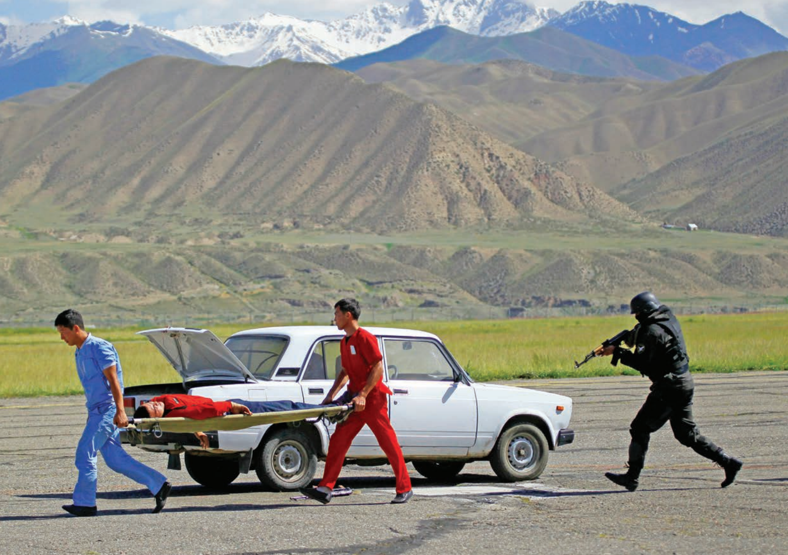
عساکر قیرغیز یک تمرین ضد تروریستی را در سال 2019 انجام می‌دهند.

فعالیت‌های اطلاع رسانی خود در مورد آموزه‌های مسالمت آمیز اسلام را افزایش داده است، از جمله آموزش مرزبانان درباره اصول مهم اسلام برای کمک به آنها در شناسایی افراط گرایان که از خارج از کشور می‌آیند.