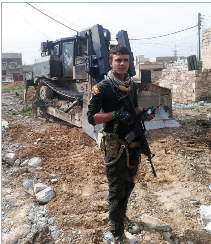
خدمات ضد تروریستی عراق