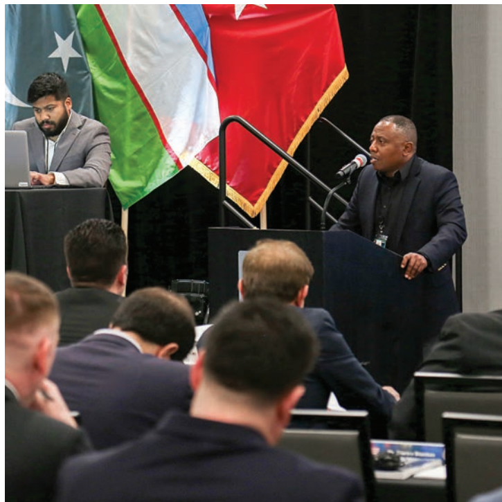
بریدجنرال دیمیتتری هنری از قوای بحریه ایالات متحده و رئیس استخبارات قوماندانی مرکزی ایالات متحده، در کنفرانس سخنرانی می کند.

وی تاکتیک‌های ترکیبی روسیه را به سه کتگوری تقسیم کرد: