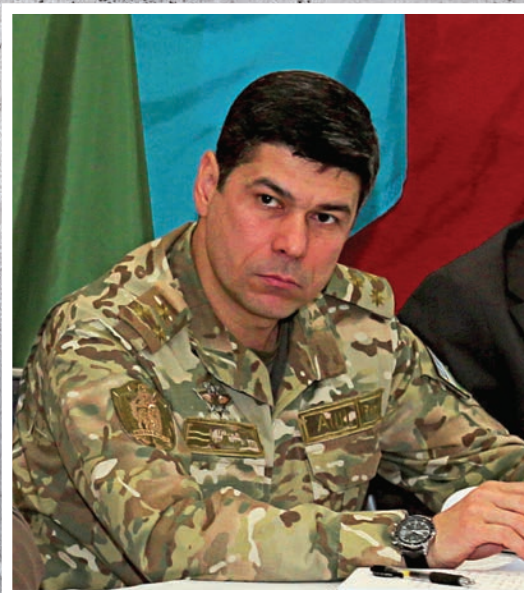
دگروال علیمجون ساماتوف، رئیس استخبارات نظامی، سردرستی قوای مسلح ازبکستان

سنگ بنای سیاست خارجی ما پایبندی ما به عدم مشارکت در هر بلوک نظامی-سیاسی، ممنوعیت استقرار پایگاه ها و واحدهای نظامی خارجی در خاک ملی، تحمل استفاده از قوای مسلح در عملیات پشتیبانی از صلح در خارج از کشور و حل مسالمت آمیز اختلافات و درگیری ها است.