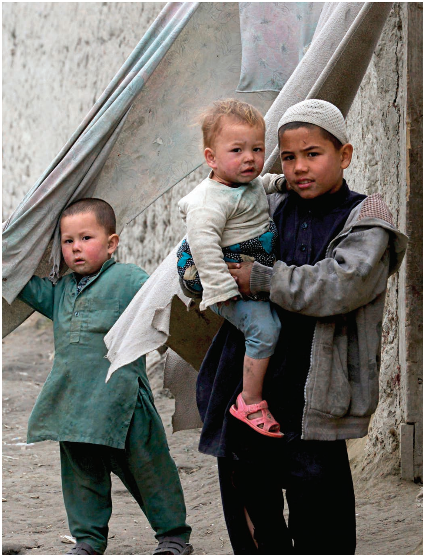
اطفال افغان در مقابل خانه شان در يك كمپ مهاجر در سال 2020 در پاكستان ايستاده اند. صلح در افغانستان كمك خواهد كرد بسياري از كسانيكه بدليل خشونت كشور اصلي خود را ترك کرده اند عودت نمايند.