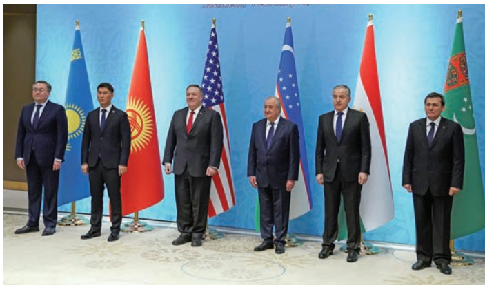
وزیر امور خارجه تاجیکستان ، سیروودجیدین مختردین ، دوم از راست ، در جلسه‌ای در تاشکند در فبروریس سال 2020 شرکت می کند که در آن ملل آسیای میانه متعهد شدند به ثبات در افغانستان کمک کنند.

منابع: Avesta.tj، SNG Today، Ozodi، آژانس تلگراف تاجیکستان، اخبار آسیای میانه