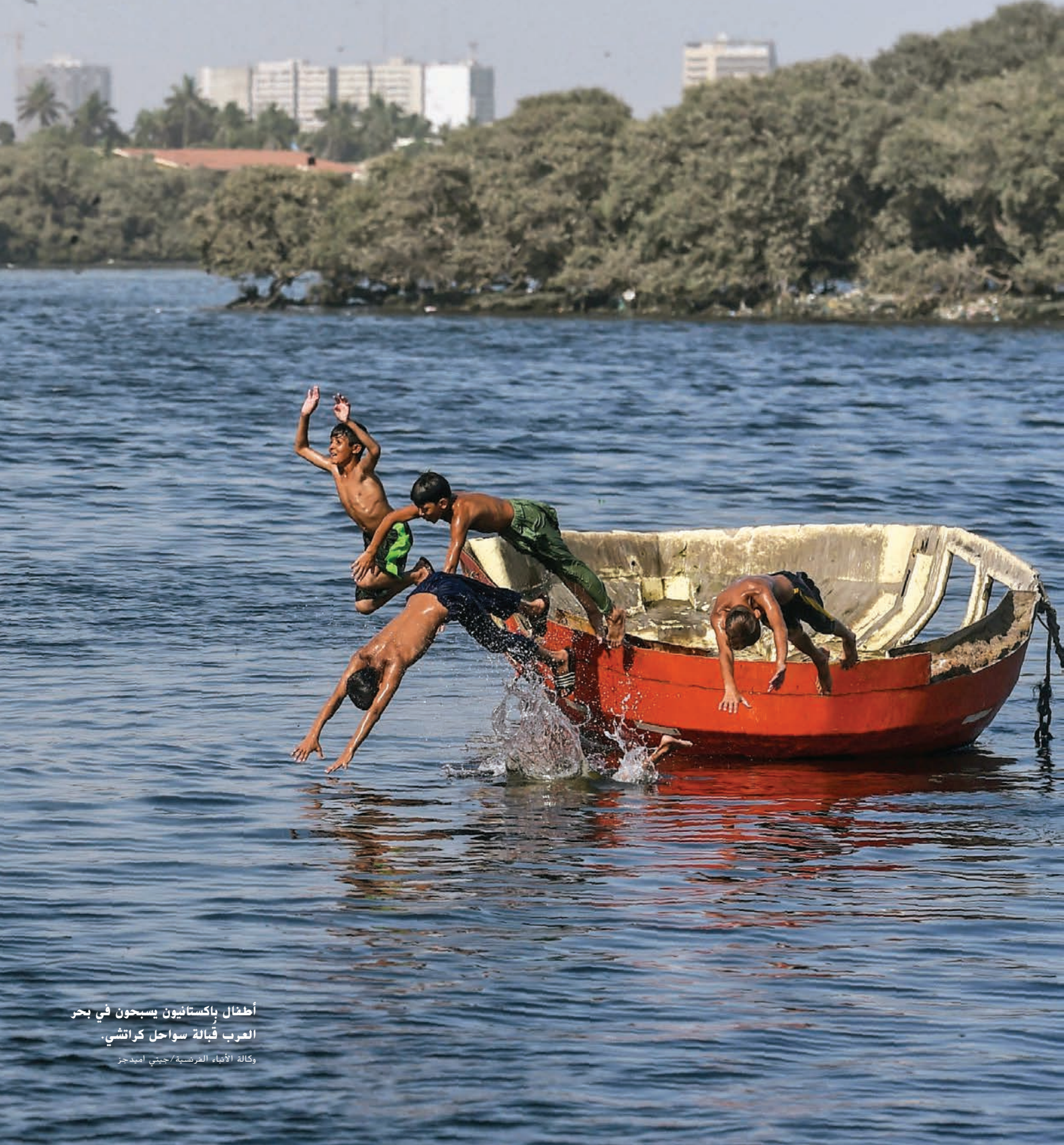
أطفال باكستانيون يسبحون في بحر العرب قبالة سواحل كراتشي.