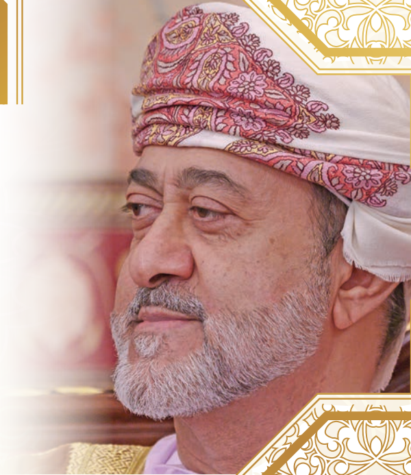
صاحب الجلالة السلطان العُماني الجديد هيثم بن طارق