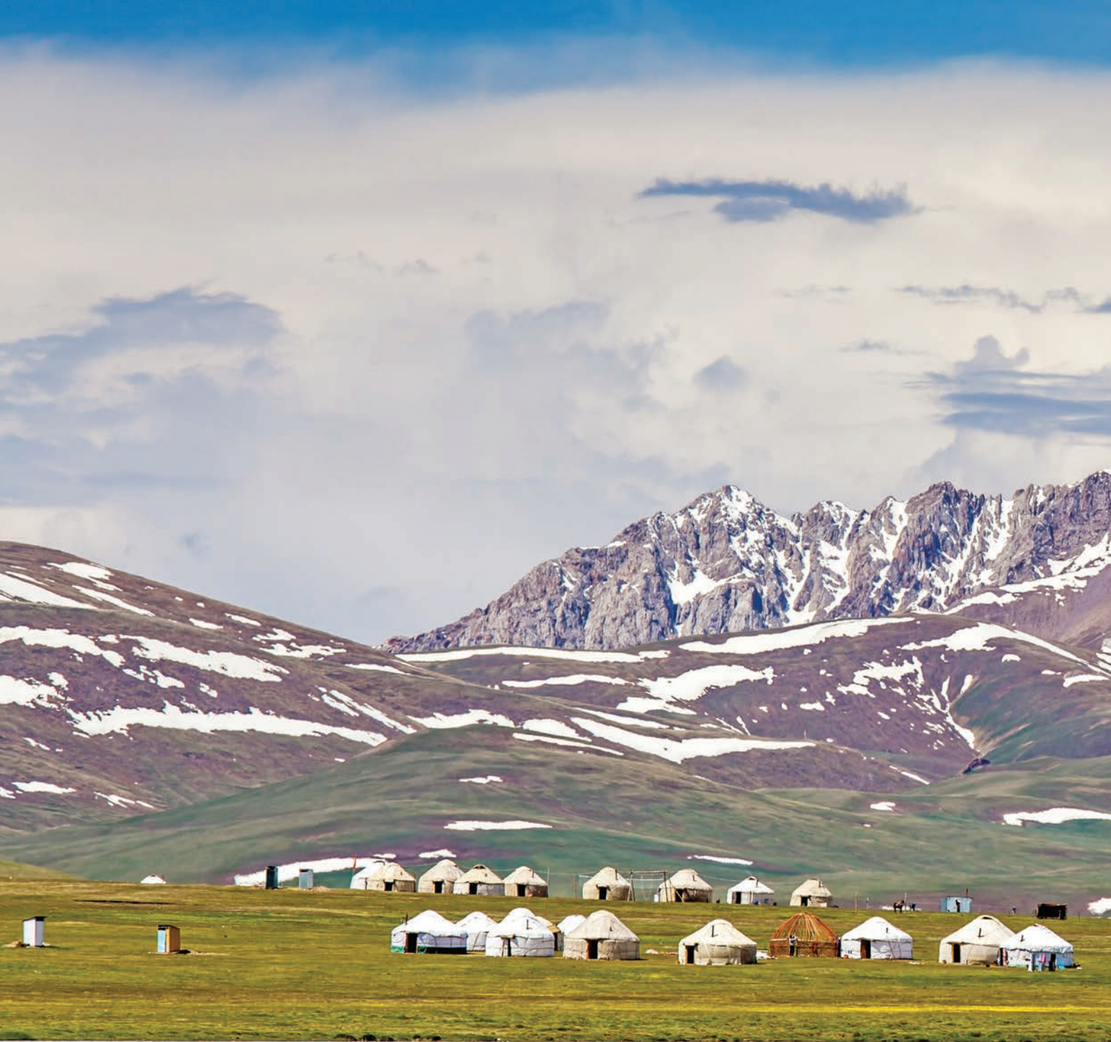
رعاة الماشية والأغنام القرغيزيون يعيشون في بيوت البيوت على سفوح إحدى السلاسل الجبلية.

اللجنة الوطنية للأمن القومي؛ وقد استخدم المتطرفون الإنترنت لتجنيد هؤلاء المواطنين البسطاء وأغروهم بالمال، ويتمثل التحدي الجديد لقرغيزستان في إعادة هؤلاء المواطنين ومن يعيلون إلى وطنهم وإعادة تأهيلهم وادماجهم في المجتمع.