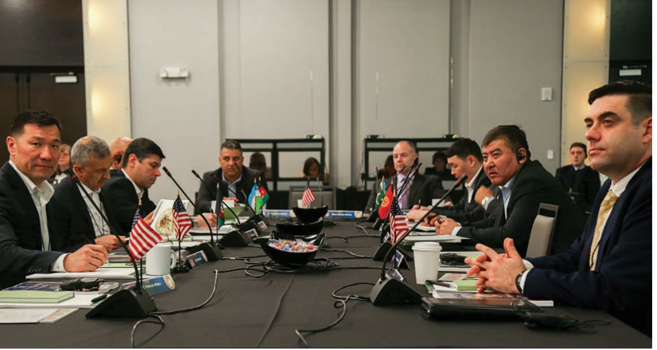
كبار القادة من أفغانستان، وقيرغيزستان، وباكستان، والولايات المتحدة، وأوزبكستان يحضرون مؤتمر مدبري الاستخبارات العسكرية لبلدان وسط وجنوب شرق آسيا.

ويرجع ذلك إلى أن بعض القوى الإقليمية ترغب في أن يكون لها نفوذ سياسي في أفغانستان؛ لأنهم يتوهمون أن وحدة الصف الأفغاني تمثل تهديداً لهم، ويرى الفريق أحمدي أن هذه الاستراتيجية إنما تأتي بنتائج عكسية. فيقول أحمدي: "إن دول الجوار تساعد نفسها في الواقع إن هي ساعدت أفغانستان".