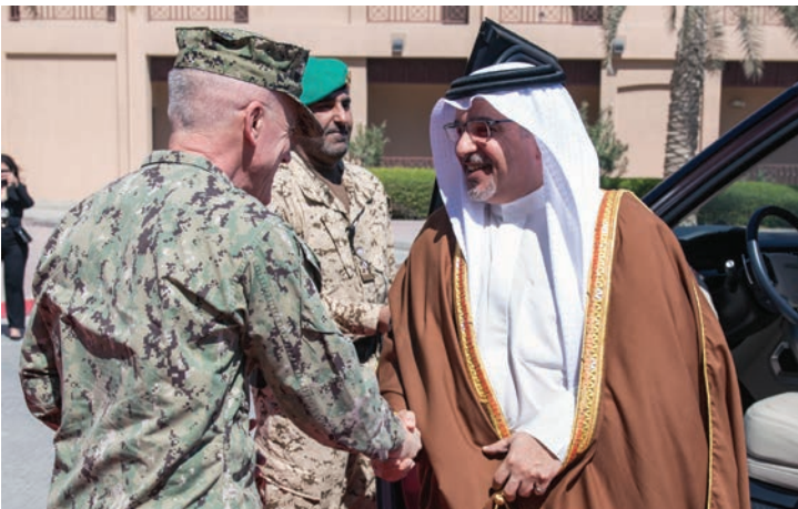
صاحب السمو الملكي الأمير سلمان بن حمد بن عيسى آل خليفة، ولي عهد البحرين، يحيي الفريق جيمس مالوي، قائد القيادة المركزية للقوات البحرية الأمريكية، في آذار/مارس 2020.