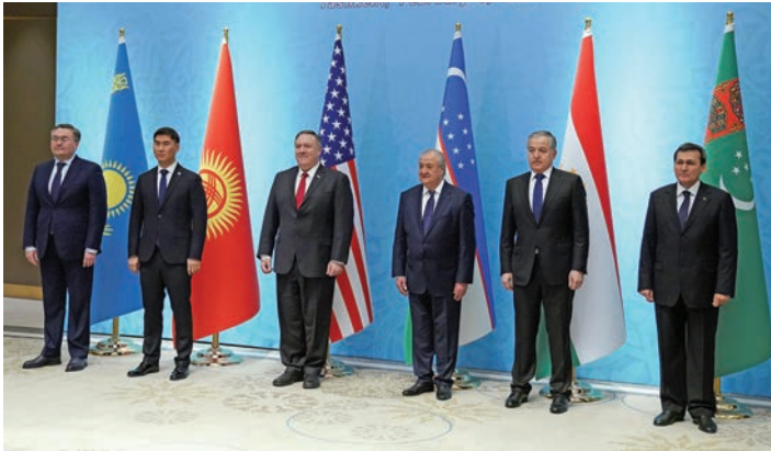
السيد سراج الدين موخريدين، وزير خارجية طاجيكستان، الثاني من جهة اليمين، يحضر اجتماع في طشقند في شباط/فبراير 2020، وقد تعهدت بلدان وسط آسيا في هذا الاجتماع بدعم استقرار أفغانستان.

المصادر: وكالة أنباء «أفيستا» الطاجيكية؛ موقع «اس ان جي توادي» الإخباري؛ وكالة التلفزيون الطاجيكية؛ وكالة أنباء وسط آسيا