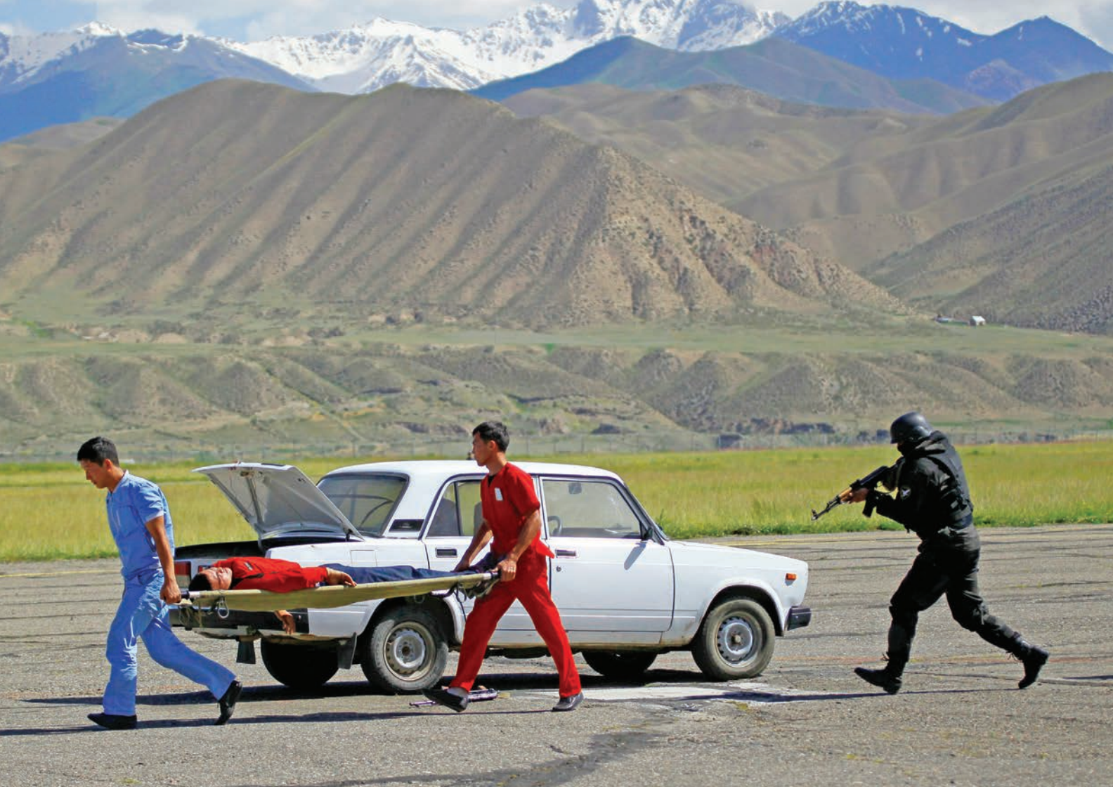
الجنود القيرغيزيون يجرون تهيئنا لمكافحة الإرهاب عام 2019.

الروحية للمسلمين دوراً تثقيفياً أكثر تأثيراً. وبالرغم من تباطؤ الإدارة الروحية في التغيير، فقد كثفت حملاتها التوعوية حول التعاليم السمحة للإسلام، ومنها تدريب قوات حرس الحدود على ثوابت الإسلام لمساعدتهم على التعرف على المتطرفين القادمين من الخارج.