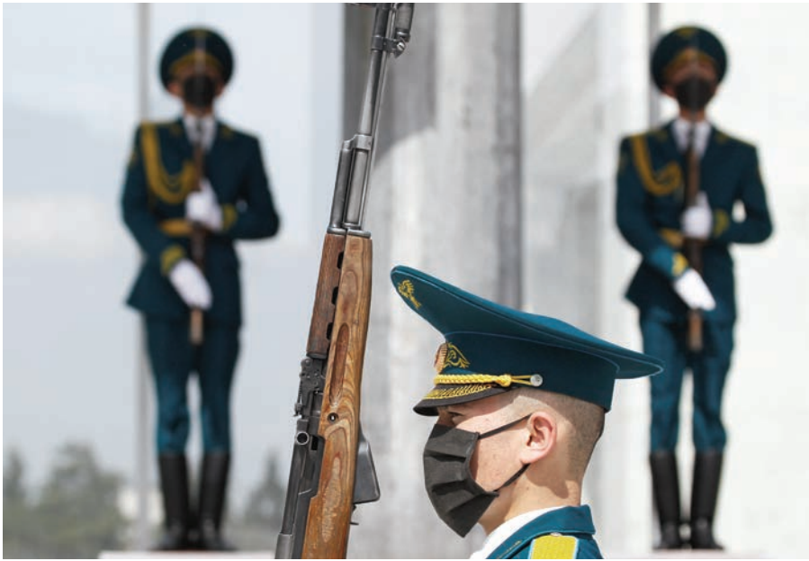
جندي من حرس الشرف في فيرغيزستان يتخذ الاحتياطات اللازمة للوقاية من انتشار المرض.

لم تختلف الكويت عن الكثير من بلدان منطقة الخليج العربي، إذ تسببت الأيدي العاملة متعددة الجنسيات في صعوبة احتواء الفيروس، كما تعرّض المواطنون الكويتيون الذين يعملون في الخارج لخطر نقل العدوى إلى وطنهم. ولذلك بادرت القوات المسلحة، والحرس الوطني، والشرطة، وأجهزة الدولة الأخرى بالكويت بالعمل للحد من تهديدات فيروس