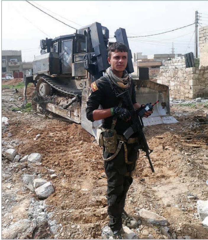
جهاز مكافحة الإرهاب - العراق

يواصلون مهمتهم مرة أخرى، ويتقدمون نحو النصر. ♦