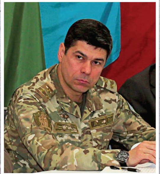
العقيد أوليجون ساماتوف مدير الاستخبارات العسكرية في الأركان العامة للقوات المسلحة الأوزبكية القوات المسلحة الأوزبكية