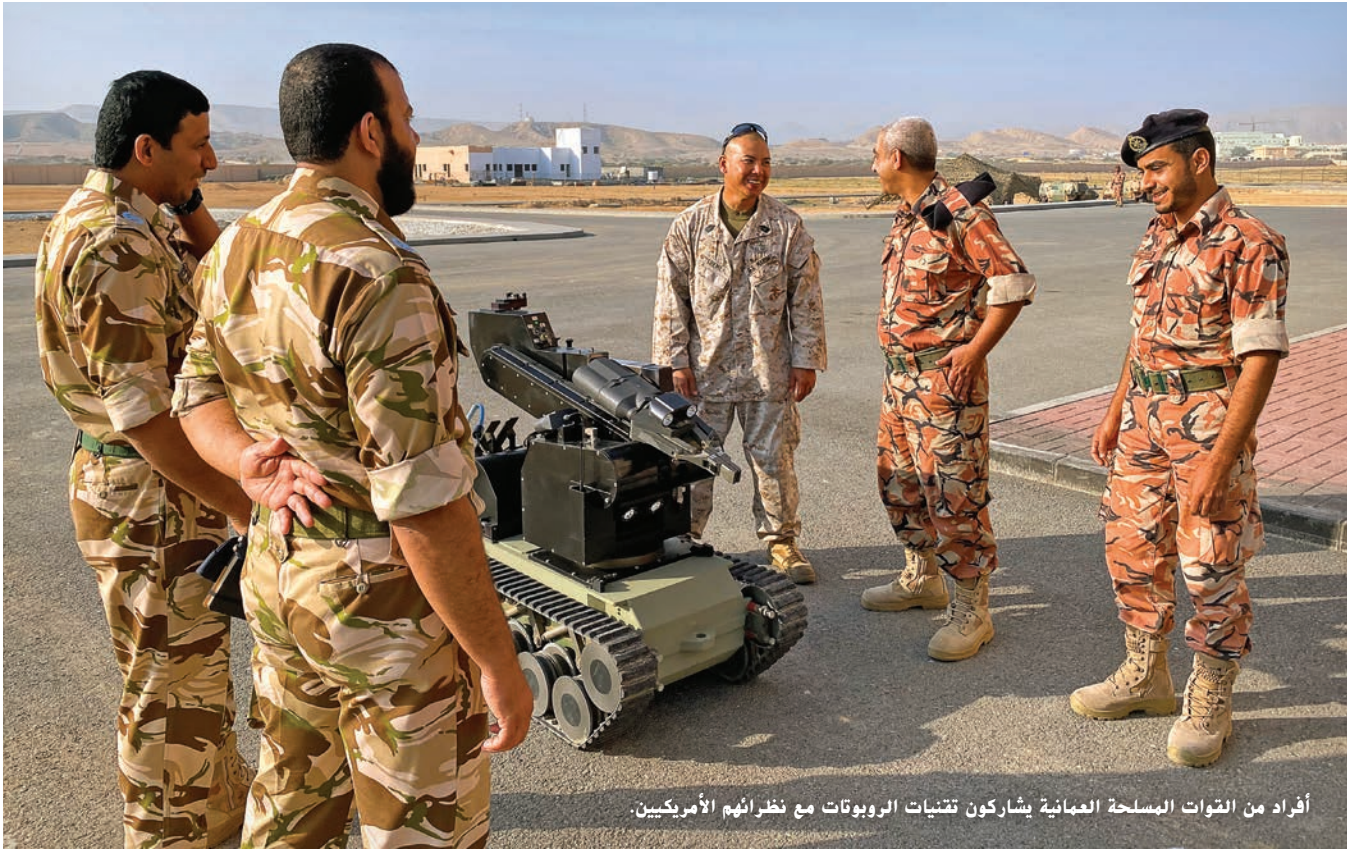
أفراد من القوات المسلحة العمانية يشاركون بتقنيات الروبوتات مع نظرائهم الأمريكيين.