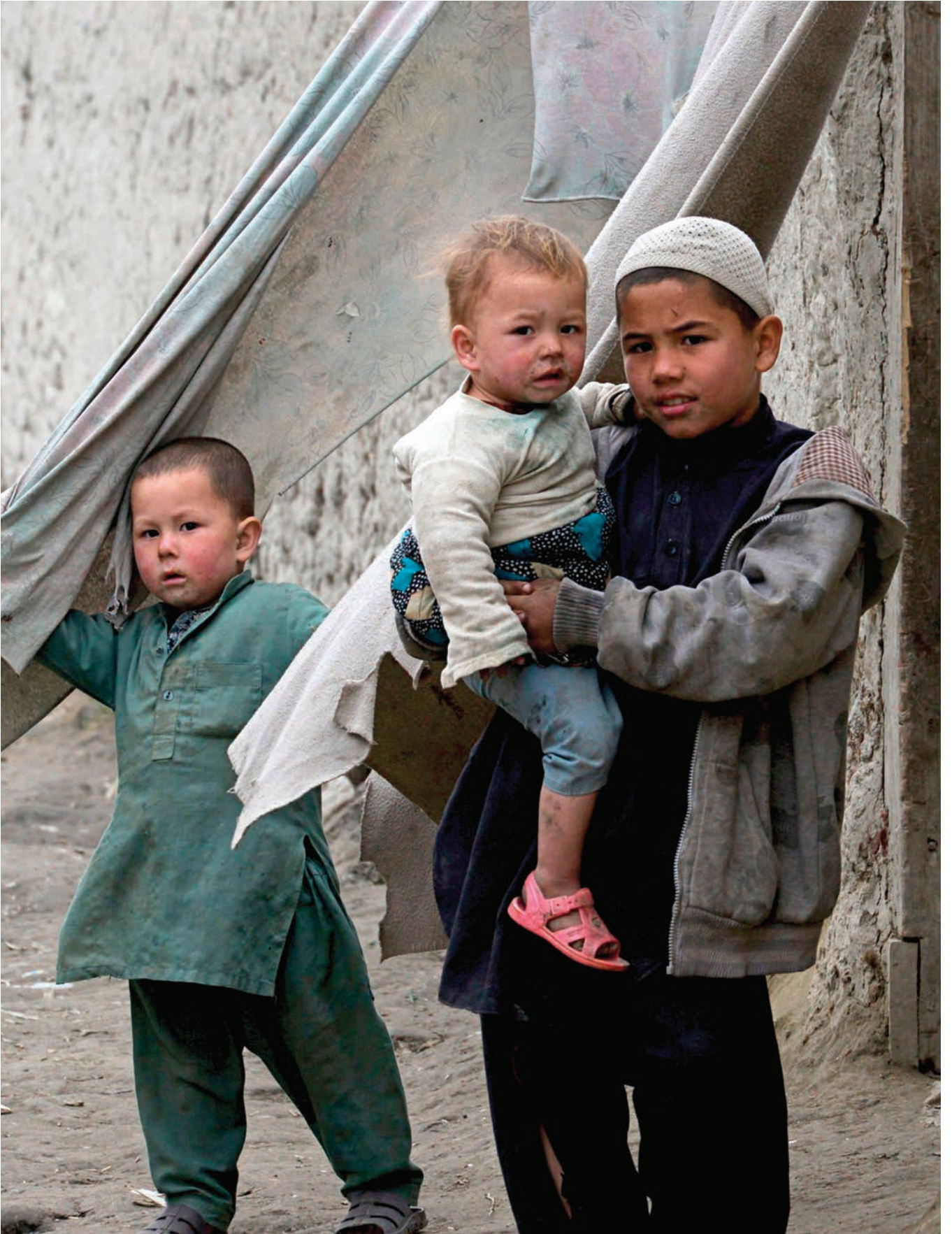
أطفال الأفغانيون يقنون أمام منزلهم في مخيم للاجئين في باكستان عام 2020، ومن شأن تحقيق السلام في أفغانستان أن يساهم في عودة الكثير من المواطنين الذين فروا من العنف في وطنهم.