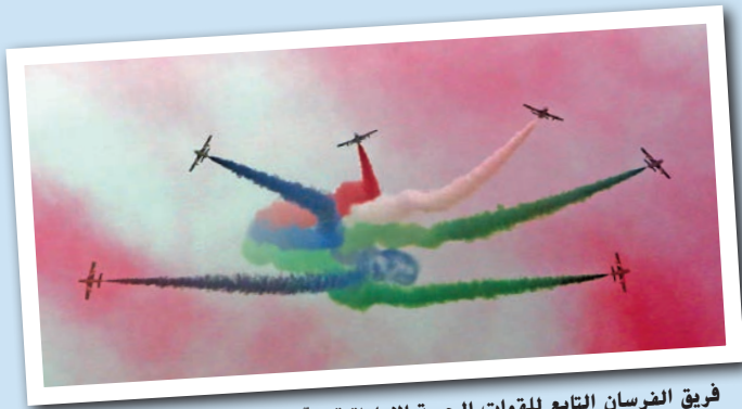
فريق الفرسان التابع للقوات الجوية الإماراتية يلون السماء أثناء فعاليات معرض الكويت للطيران.

وقال الشيخ سلمان صباح السالم الحمود الصباح، رئيس اللجنة العليا المنظمة للمعرض: "إن هذا الحدث الهام هو فرصة للالتقاء بين المسؤولين والمتخصصين في مجال الطيران المدني والعسكري، لما فيه التقدم والرفعة في مجالات الطيران بكافة قطاعاته وهو فرصة أيضاً للاطلاع على كل ما هو جديد في عالم الطيران." وتطمح الكويت لأن تصبح مركزاً للطيران في المنطقة ومحوراً رئيسياً بين أوروبا وآسيا، ويتجسّد هذا الطموح في "رؤية الكويت الجديدة 2035". وشارك في المعرض فريق صقور السعودية التابع للقوات الجوية الملكية السعودية، وفريق الفرسان التابع للقوات الجوية الإماراتية، وفريق القفز بالمظلات القطري، والسلاح الجوي الكويتي بطائرات اف/إيه-18. كما استعرض الطيارون الأمريكيون والإيطاليون والبريطانيون الإمكانيات العالية لطائراتهم.