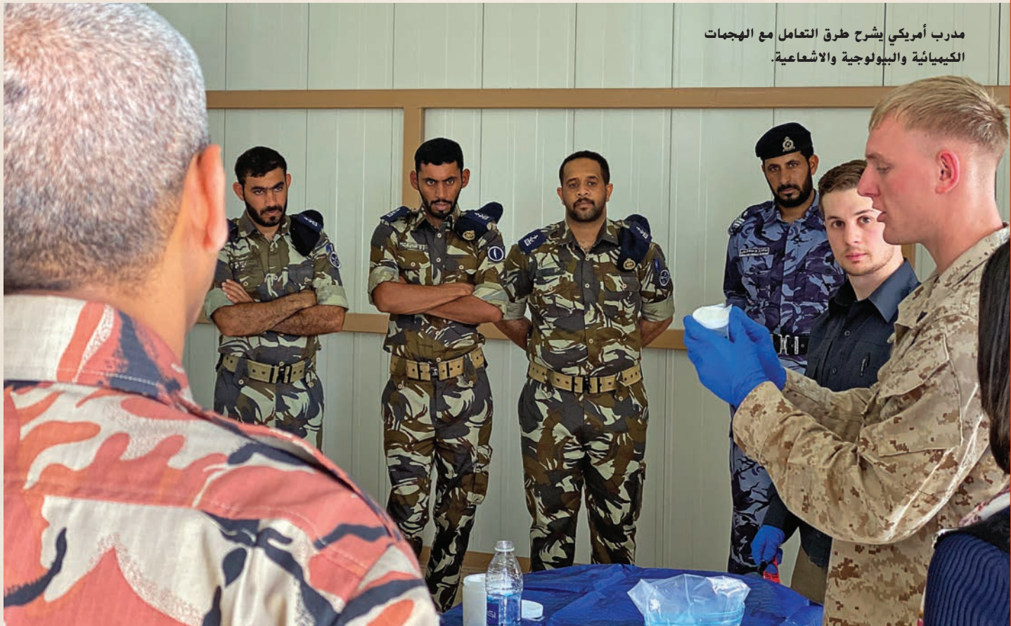
مدرب أمريكي يشرح طرق التعامل مع الهجمات الكيميائية والبيولوجية والإشعاعية.