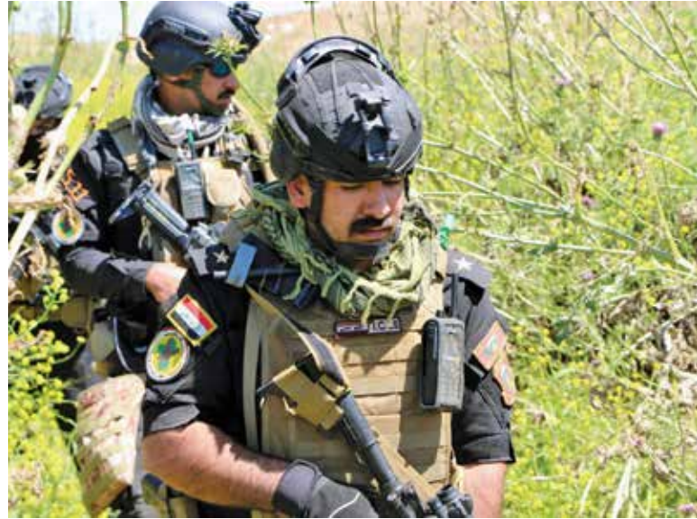
وحدات جهاز مكافحة الارهاب تنفذ عمليات ضد داعش عام 2019.