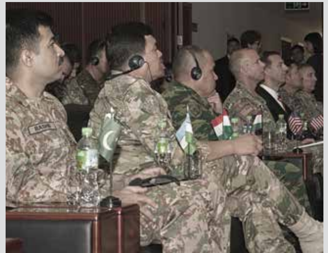
ضباط من باكستان وأوزباكستان وطاجيكستان والولايات المتحدة ومنغوليا يستمعون إلى إيجاز إعلامي في اليوم الأول لتمرين التعاون الإقليمي 2019.