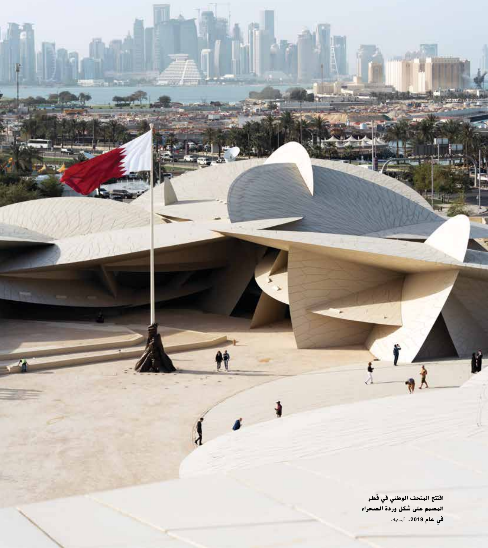
افتتح المتحف الوطني في قطر المصمم على شكل وردة الصحراء في عام 2019.