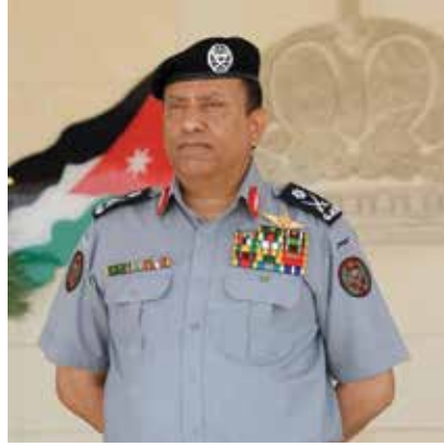
اللواء الركن حسين محمد الحواتمة

أسرة يونيبات عائدية الصور لمديرية قوات الدرك الأردنية