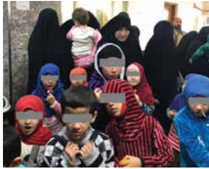
النساء والأطفال الطاجيك ينتظرون البت بمصيرهم أمام محكمة عراقية في عام 2019.

أودع الأطفال العائدون إلى أوطانهم مع أقاربهم الذين وافقوا على أن يكونوا الأوصياء القانونيين عليهم. تم تجنيد بعض العائدين الأكبر سنًا من قبل الحكومة الطاجيكية لتحذير المواطنين من الانضمام إلى الجماعات الإرهابية القاسية مثل داعش. وأعلن الاتحاد الأوروبي أنه سيقدم معونة مالية للبلدان التي تتعامل مع أعداد كبيرة من المقاتلين الأجانب وأسرتهم. ومن شأن هذه المعونة أن تستخدم لبرامج إعادة الإدماج وغيرها من الخدمات الاجتماعية. اعتبارًا من أيلول/سبتمبر 2019، أعادت كازاخستان حوالي 600 فرد من أفراد عوائل المنتمين لداعش وأعدت أوزبكستان حوالي 100 منهم، وفقًا لما ذكرته وزارة الخارجية الأمريكية. المصادر: لجنة مكافحة الإرهاب في كازاخستان. راديو أوزودي. منظمة تطوير المجتمع المدني لدول آسيا الوسطى. Sodrugestvo