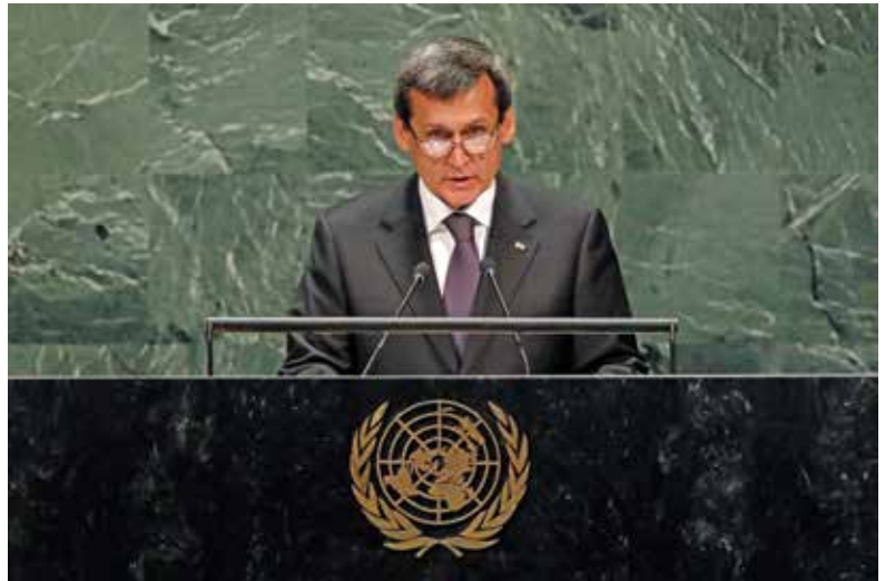
وزير خارجية تركمانستان رشيد ميريدوف يلقي خطاباً أمام الجمعية العامة للأمم

2020. المصادر: SNG Today .Turkmenportal .Kabar.kg