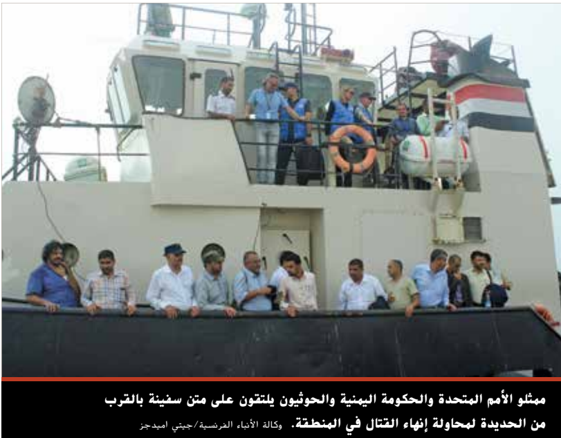
ممثلو الأمم المتحدة والحكومة اليمنية والحوثيون يلتقون على متن سفينة بالقرب من الحديدة لمحاولة إنهاء القتال في المنطقة.