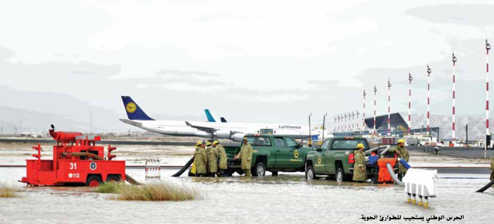
الحرس الوطني يستجيب للطوارئ الجوية.

كما اشتملت على عدد من المحاور، من بينها المحور الخاص في شؤون المهمة الحيوية والجاهزية، وتعزيز الجاهزية القتالية، وتطوير الآليات والمدركات والأسلحة والذخائر، ورفع مستويات التفيتش والرقابة والجودة، والارتقاء بالجاهزية الفنية، وتعزيز البني التحتية ومستلزماتها وتطوير المعسكرات والمستودعات، والارتقاء بجاهزية الخدمات الصحية وإنشاء عيادات طبية تخصصية في مجال احتياج الحرس الوطني. ومن المحاور الأخرى، المحور الخاص بتعزيز شؤون الاسناد الشامل والقدرات الجديدة، واستحداث وتطوير وحدة الطيران العامودي وتجهيز مستلزمات عملها بفاعلية، وتطوير منظومة التدريب والتأهيل التخصصي لوحدة الطيران العامودي، وتفعيل مركز الدفاع الكيماوي والرصد الإشعاعي، وتوسيع نطاق البحوث والدراسات العسكرية والفنية المعنية بالطاقة وغيرها، وتطوير وتدريب كئائب مكافحة الإرهاب وقض الشغب.