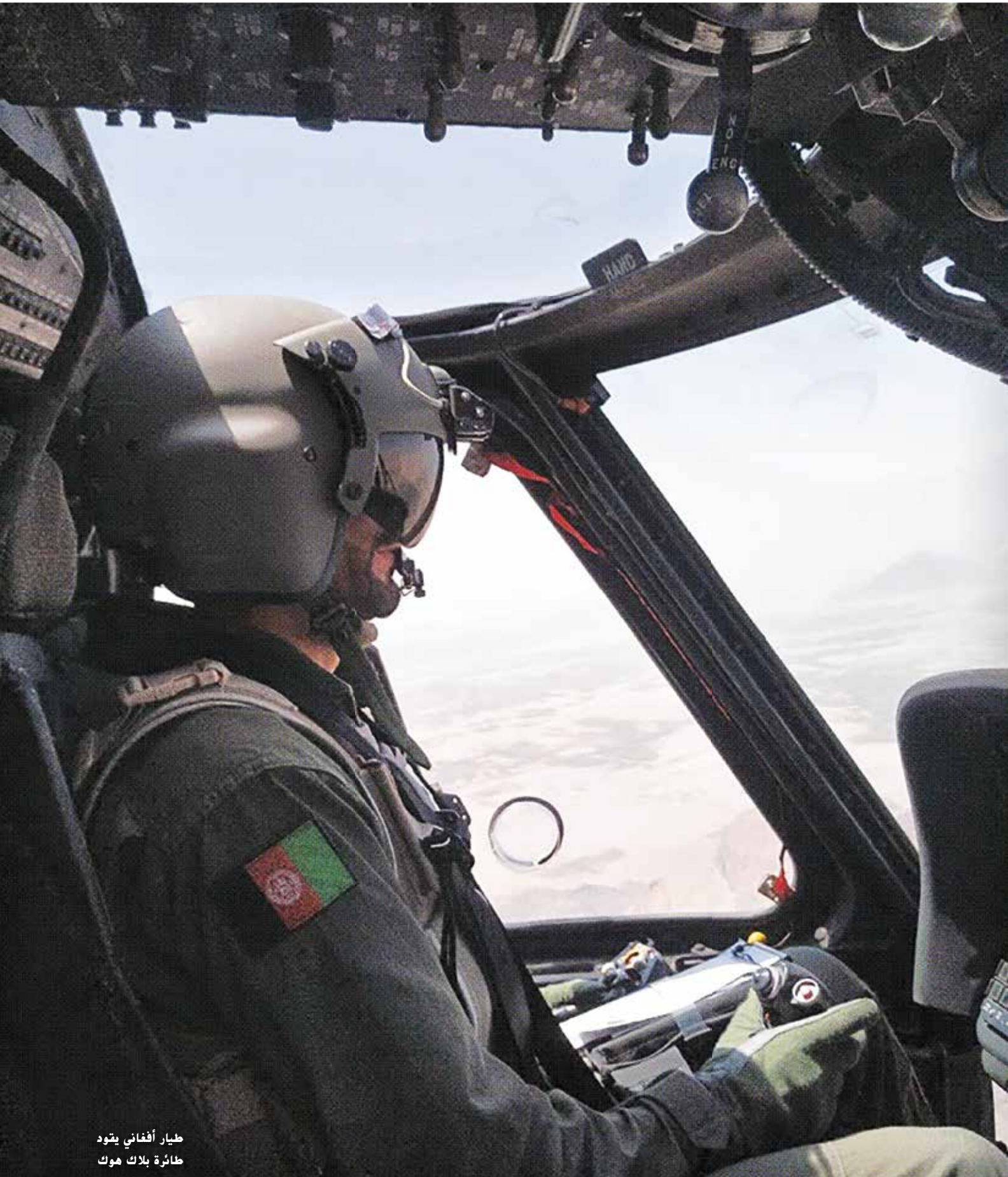
طيار أفغاني يقود طائرة بلاك هوك