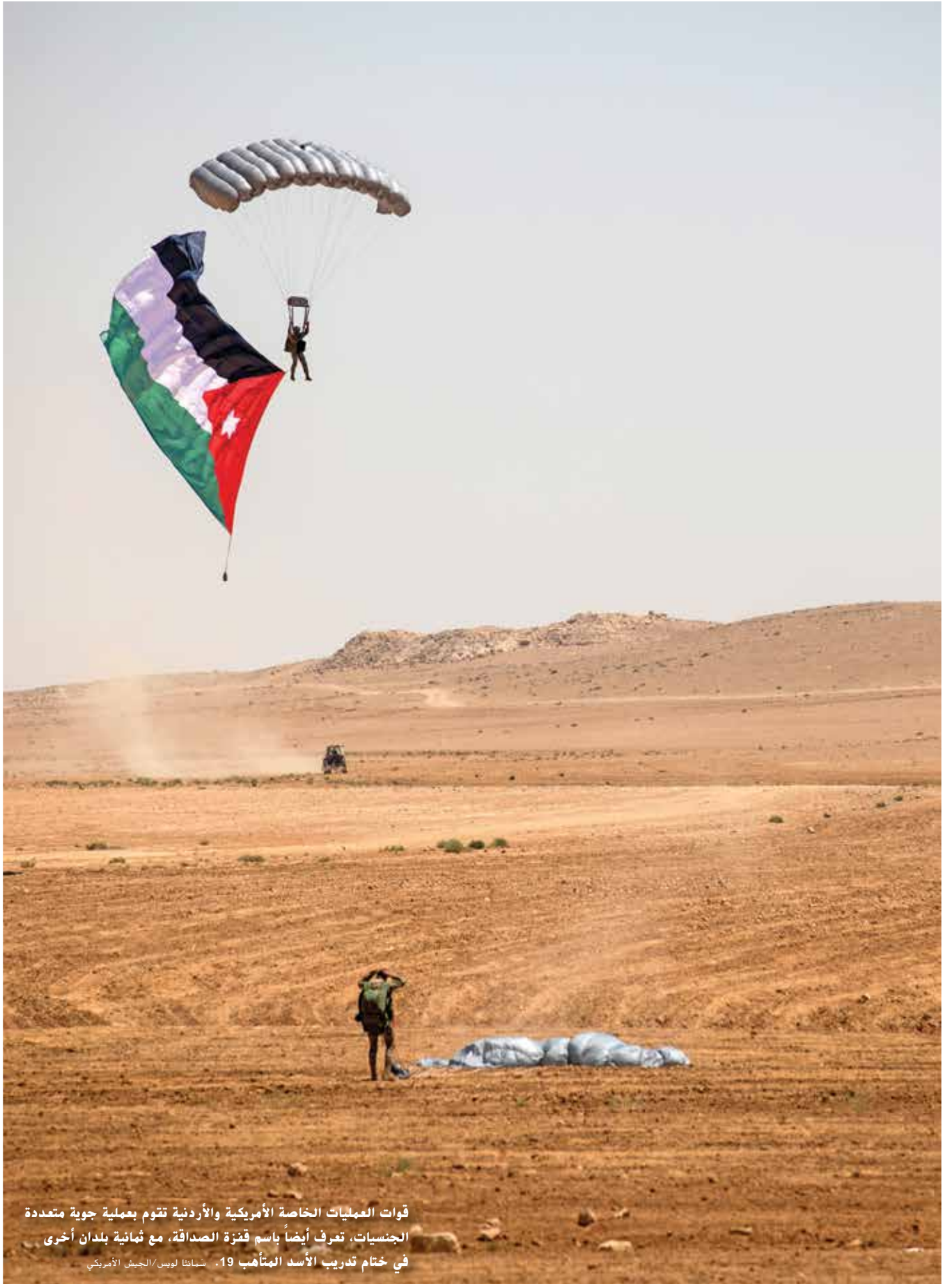
قوات العمليات الخاصة الأمريكية والأردنية تقوم بعملية جوية متعددة الجنسيات، تعرف أيضاً باسم فنزة الصداقة، مع ثمانية بلدان أخرى في ختام تدريب الأسد المتأهب 19.