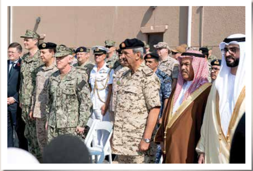
قائد قوة الدفاع البحرينية المشير الشيخ خليفة بن أحمد آل خليفة، يمين الوسط، يحضر حفل إطلاق عملية الحارس مع الفريق البحري الأمريكي جيمس مالوي، وسط اليسار.

أدت الهجمات على الشحن في الخليج العربي إلى رد دفاعي من قبل تحالف بحري يتكون من الولايات المتحدة والمملكة المتحدة وأستراليا والبحرين والسعودية والإمارات العربية المتحدة وألبانيا. واستغل هؤلاء الشركاء في التحالف فرصة انعقاد التمارين البحرية الدولية في البحرين لإطلاق عملية الحارس في تشرين الثاني/نوفمبر 2019. شارك في عملية الحارس العشرات من سفن البحرية وتمثل مهمتها في حماية السفن التجارية من التهديدات الأمنية بالقرب من الممرات المائية الاستراتيجية مثل مضيق هرمز.