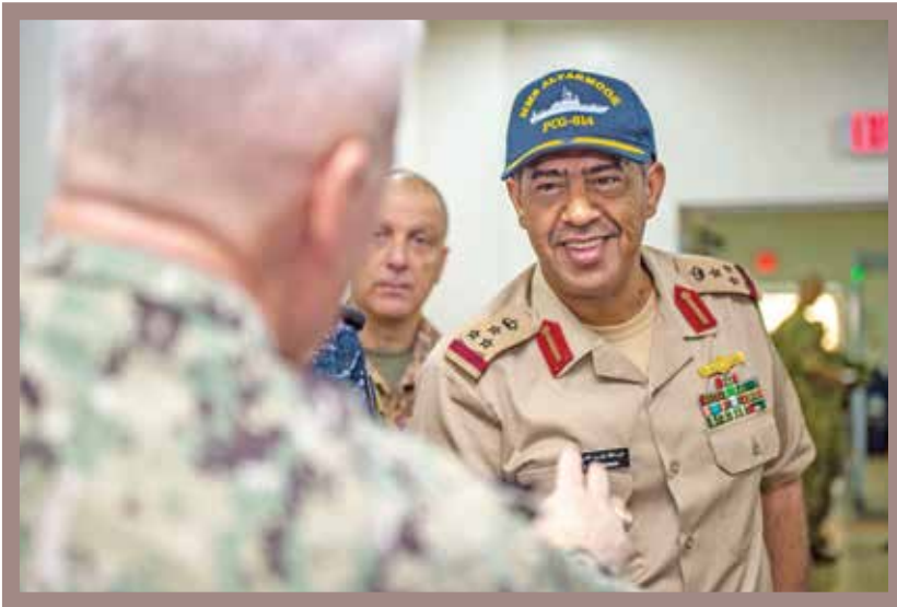
العميد البحري السعودي عبد الله الشمري، نائب قائد تمرين IMX 19، يرحب بالفريق بحري جيمس مالوي، قائد القوات البحرية في القيادة المركزية الأمريكية.

حشد تمرين IMX 19 الذي يعرف بأنه أحد أكبر التمارين البحرية في العالم، حيث يأتي في المرتبة الثانية بعد مناورة حافة المحيط الهادئ بالقرب من هاواي، القوات البحرية التي امتدت سفنها من شمال الخليج العربي بالقرب من الكويت، والتفت حول شبه الجزيرة العربية، وحاذت القرن الأفريقي في البحر الأحمر وانتهت في ميناء العقبة الأردني. وقد وحدت البلدان ذات الوجود البحري الكبير في المنطقة، بقيادة الولايات المتحدة الأمريكية والمملكة المتحدة، قواتها مع القوات البحرية الإقليمية لإظهار التصميم العالمي على الحفاظ على حرية الملاحة في بعض الممرات البحرية الأكثر أهمية من الناحية الاستراتيجية في العالم. وقد بدأ هذا التعاون على أعلى المستويات. أحد قادة الأسطول الشرقي للمملكة العربية السعودية هو العميد البحري عبد الله الشمري الذي شغل منصب نائب قائد تمرين IMX 19. وتولى ضابطان بحريان إقليميان كبيران آخرا قيادة فرقتي عمل من فرق العمل الثلاثة خلال التمرين: العميد البحري العماني علي موسى البلوشي من فرقة العمل الجنوبية والعقيد الإماراتي مصباح راشد المهيري من فرقة العمل الشمالية. بحسب ما قاله العميد البحري عبد الله، فإن تمرين IMX 19 أفاد المشاركين على مرحلتين، بدءاً بالتدريب الأكاديمي على الشاطئ ومن ثم التقدم نحو التدريبات العملية في البحر. استمر التمرين الشامل من 21 تشرين الأول/أكتوبر إلى 12 نوفمبر/تشرين الثاني 2019. وأضاف العميد البحري عبد الله "لمثل هذه التمارين تداعيات إيجابية على قواتنا البحرية حيث توائم المفاهيم التكتيكية للقيادة والسيطرة مع بقية القوات البحرية في العالم وكذلك ترفع مستوى القدرة القتالية للبحرية الملكية السعودية."