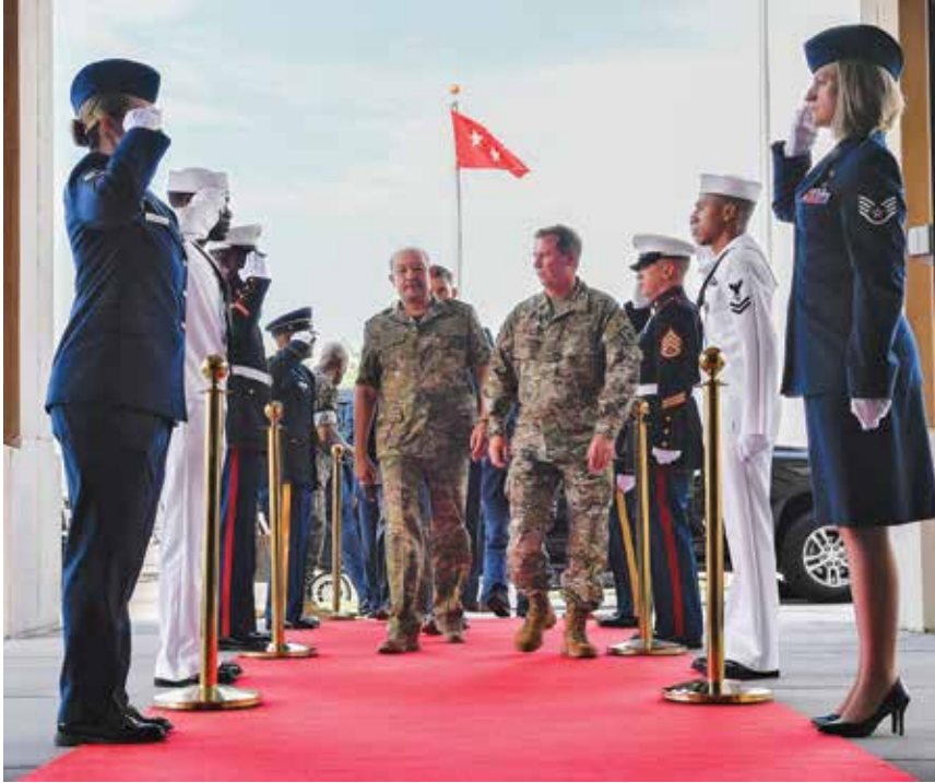
الفريق توماس بيرجسون، نائب قائد القيادة المركزية الأمريكية، يمين الوسط، يرحب باللواء بخدير نظاموفيتش قربانوف، وزير الدفاع في أوزبكستان، في مقر القيادة المركزية الأمريكية في توموز/يوليو 2019.

في عام 2014، بدأت الولايات المتحدة بيع مركبات مقاومة للكمان والألغام إلى أوزبكستان، بما في ذلك قطع الغيار والصيانة اللازمة لها. وبالنظر إلى مرونة هذه المركبات وقدرتها على مقاومة الألغام والعبوات الناسفة محلية الصنع، فإنها ستعزز إلى حد كبير قوة القوات المسلحة الأوزبكية. في غضون عامين، تلقت طشقند 308 من المركبات المقاومة للكمان والألغام و 20 قطعة غيار تبلغ قيمتها حوالي 150 مليون دولار.