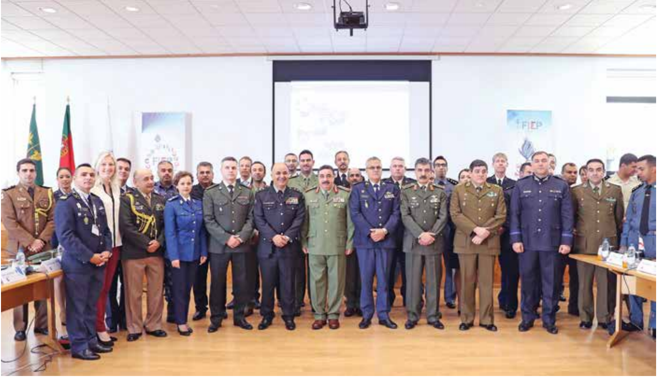
الفريق الركن هاشم الرفاعي يقف مع الشركاء الدوليين عند انضمام الحرس الوطني الكويتي للمنظمة الدولية لقوات الدرك والشرطة في عام 2019.

ومن الإنجازات التي تحققت في الفترة الأخيرة للحرس الوطني، وللكويت عامة، انضمام الحرس الوطني الكويتي إلى المنظمة الدولية لاتحاد الشرطة والدرك ذات الطابع العسكري (FIEP) ما يتيح لنا تبادل الخبرات مع دول عريقة في مجال حفظ الأمن ومكافحة الإرهاب وإدارة الأزمات.