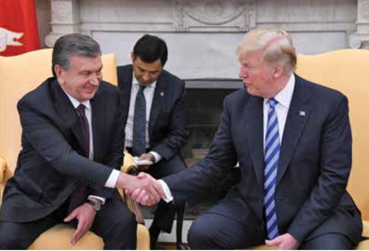
الرئيس الأمريكي دونالد ترامب يصافح الرئيس الأوزبكي شوكت ميرزوييف في واشنطن العاصمة.

واقتناء أنواع جديدة من الأسلحة والذخائر للقوات الخاصة ولجنود دوريات الحدود في البلد، وتزويد القوات المسلحة بمركبات مصفحة. وأفادت التقارير أيضاً أن البلدين ناقشا تعليم الطلبة العسكريين الأوزبكيين في المدارس العسكرية الأمريكية.