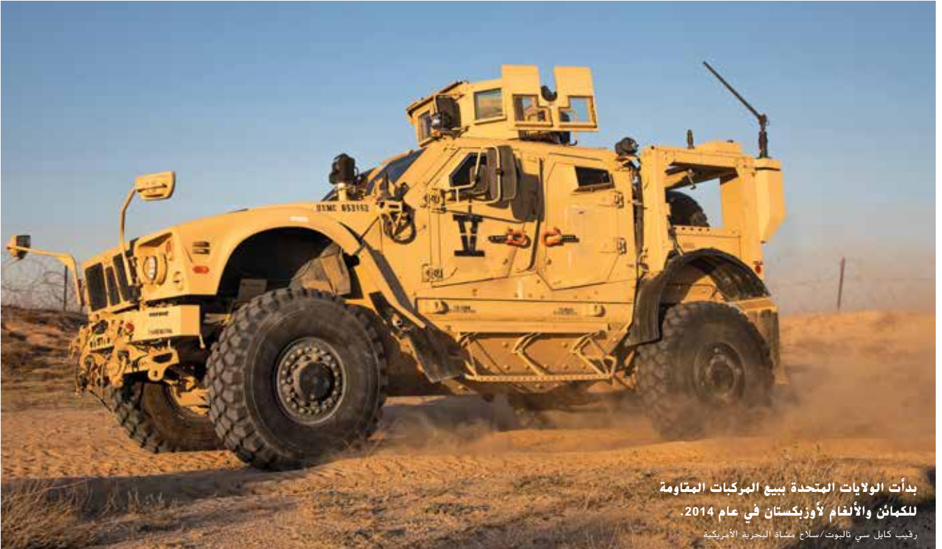
بدأت الولايات المتحدة ببيع المركبات المقاومة للكائن والألغام لأوزبكستان في عام 2014. رقيب كابل سي فالوت/سلاح مشاة البحرية الأمريكية

وفقاً لأليس ويلز، نائبة مساعد وزير الخارجية الأمريكي لجنوب ووسط آسيا، ضاعفت الولايات المتحدة بمقدار ثلاثة أضعاف مبلغ المساعدة المالية لأوزبكستان من 10.1 مليون دولار في عام 2016 إلى 28.1 مليون دولار في عام 2018. وأشارت السلطات الأوزبكية إلى أن أكثر من 160 شركة أمريكية استثمرت 600 مليون دولار في البلد على مدى السنوات القليلة الماضية. وفي المقابل، أعربت أوزبكستان عن استعدادها للمساهمة في الاقتصاد الأمريكي من خلال