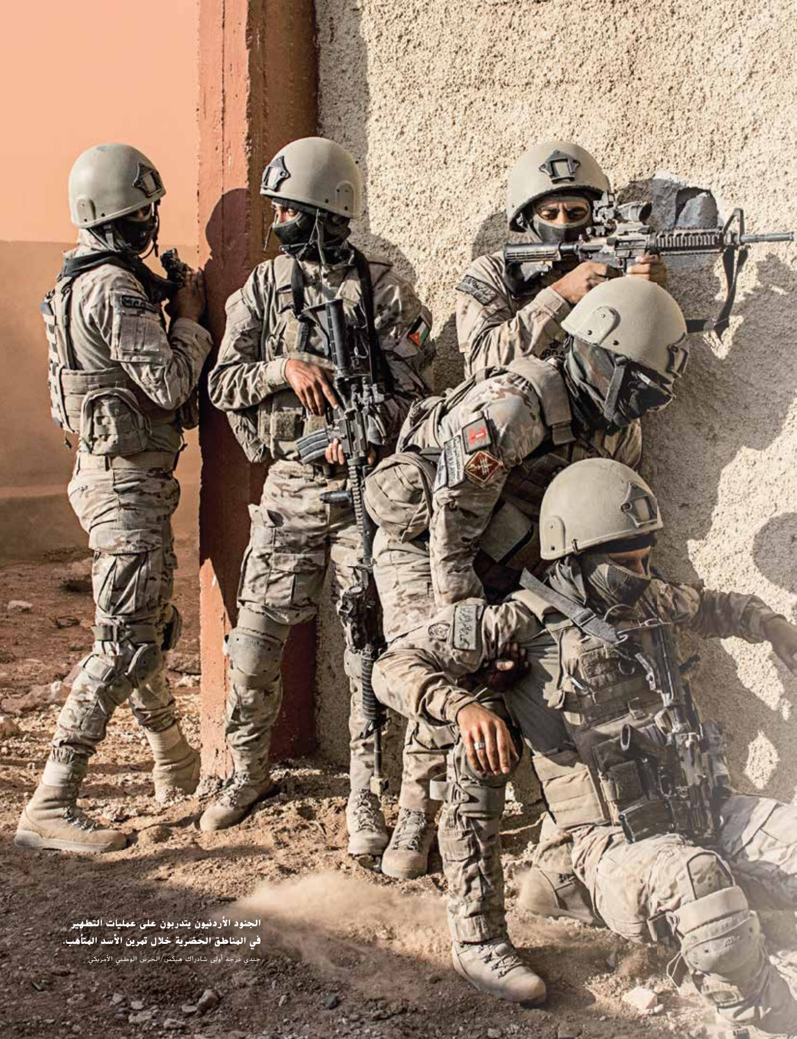
الجنود الأردنيون يتدربون على عمليات التطهير في المناطق الحضرية خلال تمرين الأسد المتأهب.