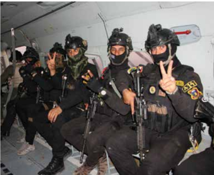
قوات جهاز مكافحة الإرهاب تنفذ مهام خلال عملية المهيب الحارق.