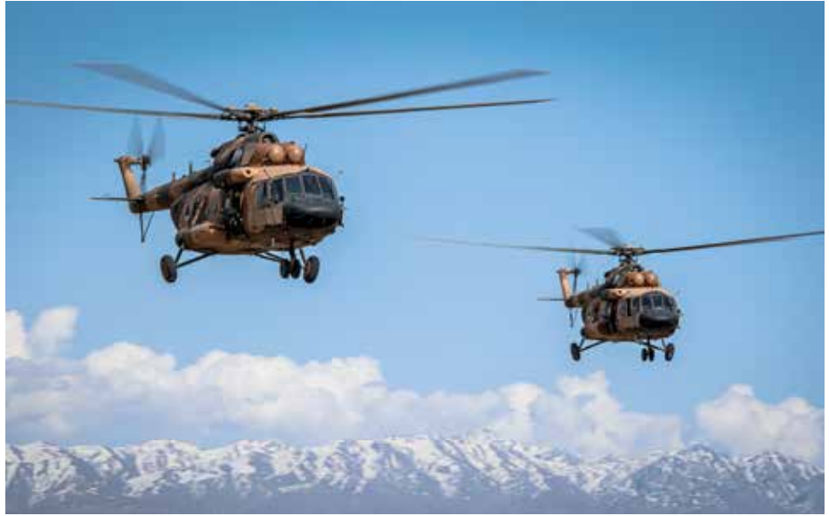
طائرتان من طراز أم آي 17 تابعتان لجناح المهمة الخاصة تقتربان من منطقة الهبوط. الشؤون العامة لجناح المهمة الخاصة الأفغاني

أهداف المستشارين الأمريكيين، لذلك تم في عام 2017 اختياري للعمل كرئيس لقسم الأرساد الجوية في جناح المهمة الخاصة 777. تلقيت تدريباً أساسياً في مجال الأرساد الجوية في الهند، وتدريباً متقدماً من خبراء أمريكيين في معسكر كامب ايجيل في أفغانستان. قبل أن أقبل بالوظيفة في العمليات الخاصة، كنت أخدم في القوات الجوية الأفغانية العادية. وبفضل زملائي الأمريكيين، حصلت مؤخراً على درجة الماجستير في الأرساد الجوية. قدم مستشارو الولايات المتحدة معلومات أرساد جوية دقيقة وشاركوا بمهاراتهم زملائهم الأفغان، وقدموا التدريب على استخدام رادارات الأرساد الجوية ومواقع الإنترنت المتقدمة.