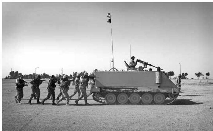
نیروهای چندملیتی در مارچ 2015 و در پایان مانور در ساحل فیلکه کویت پیشروی میکنند.

هنگام که نیروهای خاص مطلع میشوند که گروگان گیران در حال آماده کردن مواد کیمیاوی زهری در یک لابراتوار مخفی نیز هستند، تیم های طبی از امارات متحده عربی و عربستان سعودی و دلگی های ضد عفونت سازی اردن، کویت و قطر با امبولانس ها و لابراتوارهای سیار خود وارد صحنه میشوند.