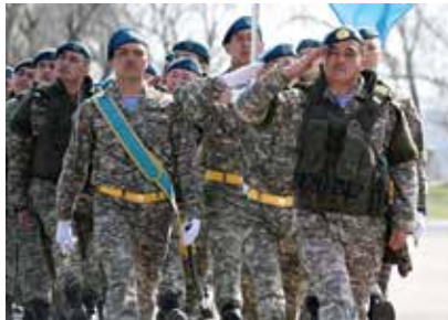
سربازان قزاقستان در مراسم افتتاحیه تمرین عقاب صحرا 2015 رژه نظامی اجرا میکنند.

بریر گفت: "همه شرکا در عقاب صحرا یک هدف مشترک کمک به صلح و ثبات در سراسر جهان، و کمتر کردن درد و رنج کسان را دارند که از بخت بد با چنین شرایط مواجه شده اند. این تعهد مشترک به اصول سازمان ملل متحد است که باعث میشود تا تمرین عقاب صحرا به عنوان یک رویداد منحصر به فرد برای همکاری از دیگر رویدادها متمایز شود".