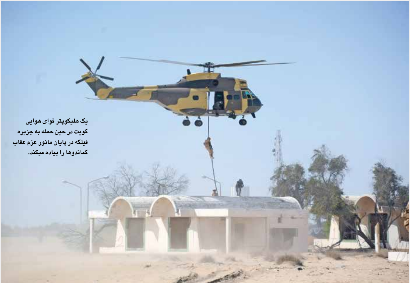
یک هلیکوپتر قوای هوایی کویت در حین حمله به جزیره فیلکه در پایان مانور عزم عقاب کماندوها را پیاده میکند.

شد و به عنوان یک معیار برای بهبود دادن چگونگی انجام مانورهای معالجه طبی تلقی گردید.