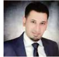
عامر اس. مصطفی

تا در پیوستن به کنوانسیونهای بین المللی مربوط به مبارزه با جرایم سایبر و هماهنگ شدن با نهادهای بین المللی مربوطه در زمینه مقابله با جرایم سایبر تلاش کند. با توجه به اعتقاد به نیاز ایجاد امنیت فراگیر و مقابله با تمام تلاشهای که قصد برهم زدن آن را دارند، و در یک تغییر کیفی در حوزه مبارزه با جرایم تکنالوژی معلوماتی، فرمان شماره 60 سال 2014 توسط پادشاه بحرین اعلیحضرت پادشاه حمد بن عیسی آل خلیفه درمورد جرایم تکنالوژی معلوماتی صادر شد. این حکم شامل مقررات قانونی زیاد بود که مجازات را برای مرتکبین جرایم سایبر تعیین میکرد و به کنترل وظایف محول شده به مراجع قانونی میپرداخت. مجازات مربوط به استفاده جنسی از کودکان نیز سخت گیرانه تر شده است؛ چنانکه این مسئله مدتهای زیاد است که یکی از مهمترین نکات مورد تأکید قانون بحرین به شمار میرود.