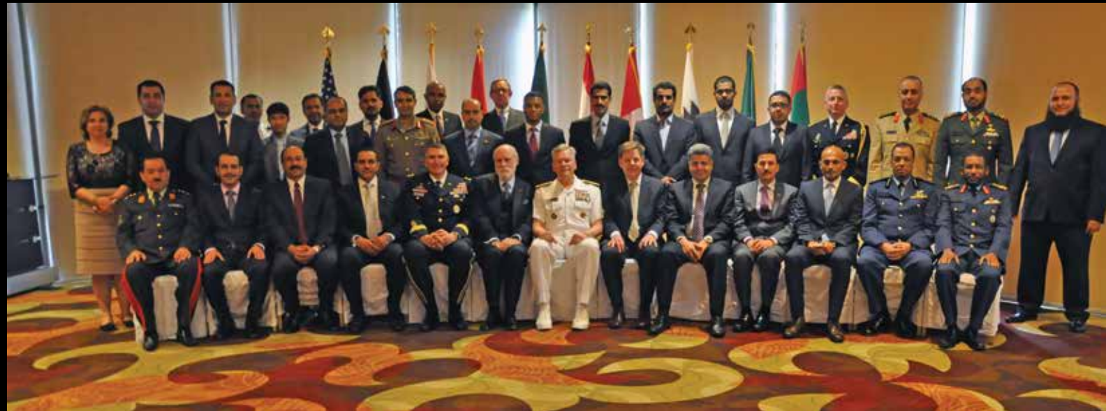
شرکت کننده گان کنفرانس ارتباطات منطقه مرکزی در می 2015 در واشنگتن گرد هم آمده اند.

تسخیر کنند. او گفت بهترین راه حل ایجاد یک معماری سایر مجازی است که شاخه های مختلف تکنالوژی معلوماتی، مانند ایمیل و وب سایتها را به پایگاه های دفاعی مجزا و بیشتر قابل دفاع تفکیک میکند. به این ترتیب، شکسته شدن فایروال به معنی تسلیم کل سیستم نیست.