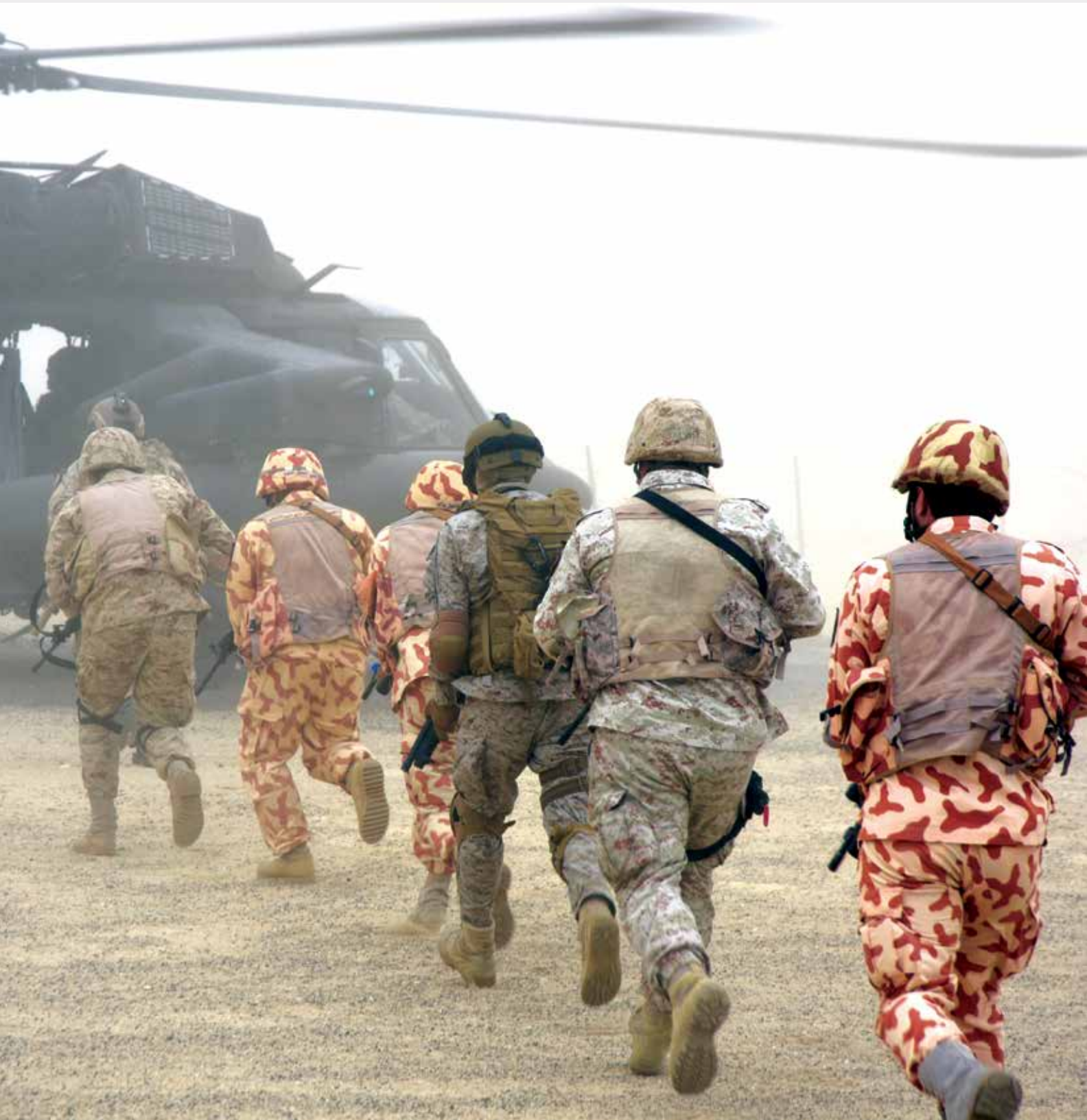
نیروهای خاص چندملیتی مأموریت نجات گروگان ها را در مانور عزم عقاب 2015 به پایان می‌رسانند.