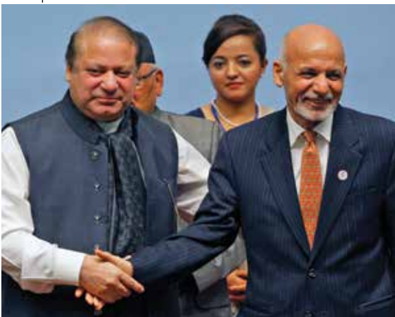
محمد نواز شریف، صدراعظم پاکستان، سمت چپ و اشرف غنی، رئیس جمهور افغانستان در انجمن جنوب آسیا برای اجلاس همکاری های همکاری های در نیپال در نومبر 2014 با یکدیگر دست میدهند.

مقامات افغانستان و پاکستان در حال همکاری برای دستیابی به هدف مشترک ریشه کن کردن تروریسم در منطقه و ایجاد ارتباط مبتنی بر اعتماد هستند.