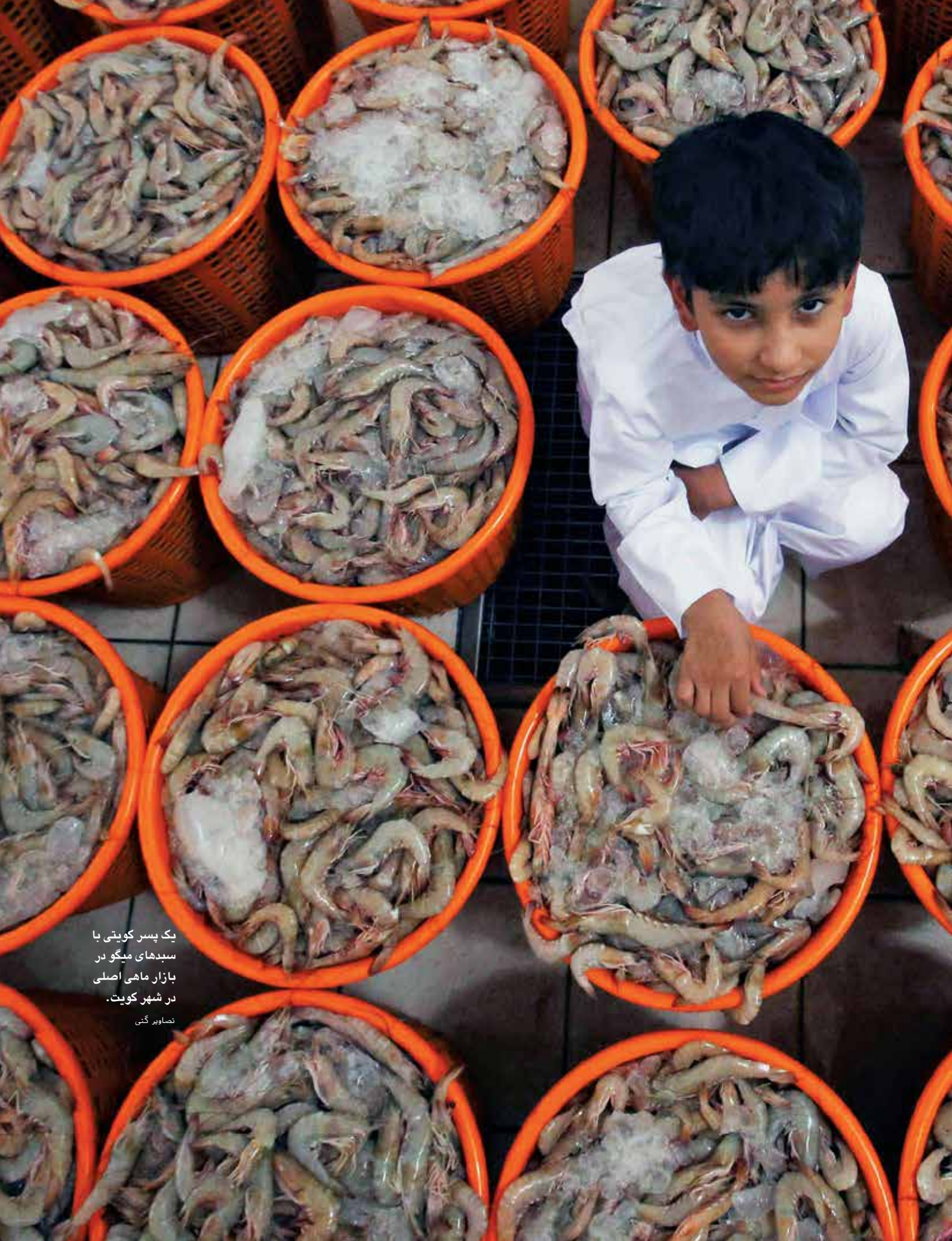
یک پسر کویتی با سبدهای میگو در بازار ماهی اصلی در شهر کویت.