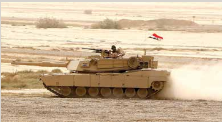
یک تانک آبرامز در یک مانور نظامی از روی ریگ عبور میکند.

تیم انترنیت عراق در حوزه های نظامی بسیار متخصص است - نظریات و پاسخ های اعضا حاکی از مسلکی بودن و تخصص آنها است. مثلاً، این تیم به انتشار مقایسه فنی بر اساس تحقیقات علمی در زمینه مقایسه هلیکوپتر آپاچی امریکایی، تانک آبرامز و جت جنگی F-16 با هلیکوپتر روسی Mi-28، تانک T-90 و جت جنگی MiG-35 پرداخته است.