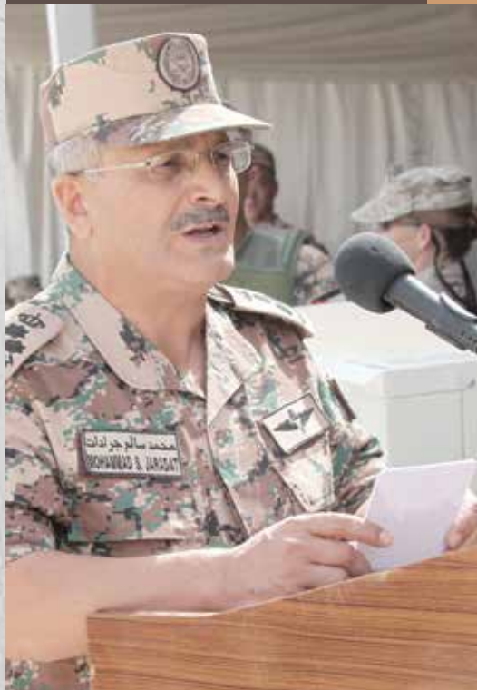
برید جنرال اردنی، محمد سالم جرادت قوای مسلح اردن

جدا از مانور نظامی شیر در کمین، تعلیم و تربیه دائم یک بخش بزرگ از فعالیت های قوای مسلح اردن (JAF) را تشکیل میدهد. برید جنرال محمد سالم جرادت، رئیس ارکان تعلیم و تربیه قوای مسلح اردن گفت دلیل این مسئله این است که تهدیدات جنگی غیرمتعارف و نامتوازن مستلزم آن است که نیروها هوشیار بوده و برای هر وضعیت آماده گی کامل داشته باشند. جرادت گفت: "ما در منطقه زنده گی میکنیم که میتوانیم همه این مشکلات را مشاهده کنیم. سراعلی قوماندان قوای مسلح ما، اعلیحضرت پادشاه تشخیص داده است که ما در خط مقدم مبارزه با داعش هستیم. ما در حال آغاز جنگ علیه آنها هستیم. این یک تهدید عمده است. آنها کودکان را میکشند. زنان را میکشند. مردم را آواره میکنند. آنها ارزش های انسانی را از بین میبرند. آنها چیز نیستند بجز قاتل. ما تلاش میکنیم آینده خود را از دست آنها نجات دهیم، از نسل ها و از تمام بشریت محافظت کنیم." تهدیدات چون آن چیز که داعش ایجاد کرده است نیاز آموزش و مشارکت مداوم را تقویت