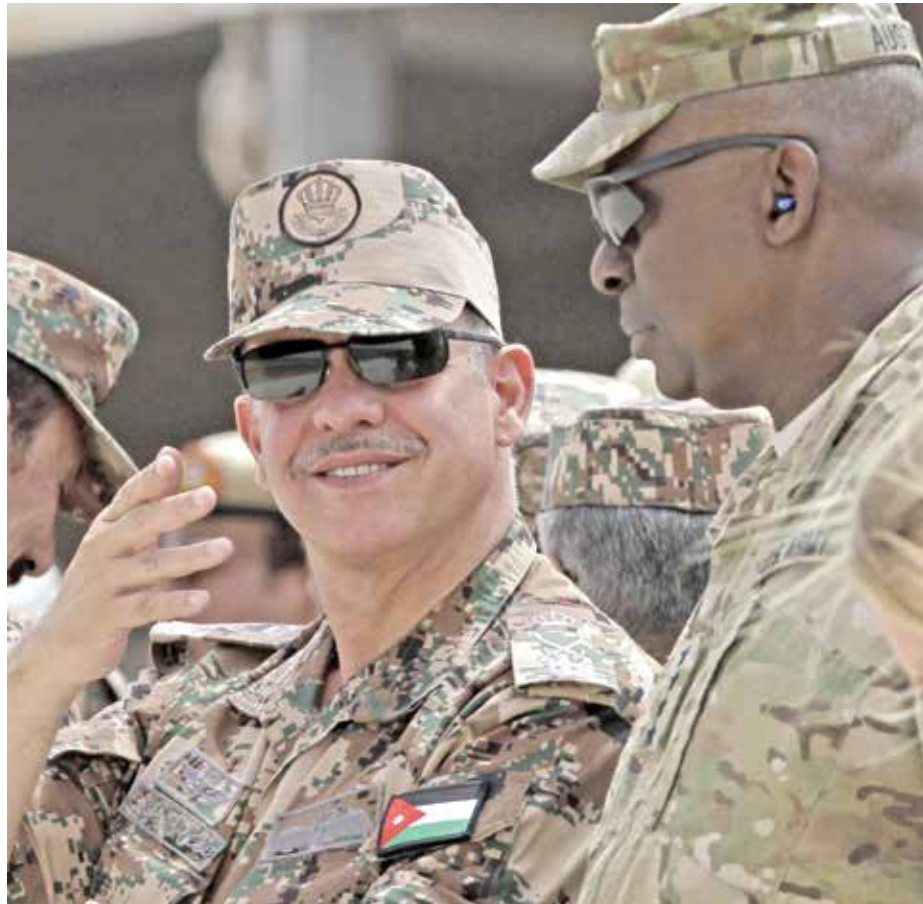
جلالت مآب شاهزاده اردنی فیصل بن حسین، سمت چپ و جنرال امریکایی لوید اوستین، قوماندان قومانده مرکزی ایالات متحده، تمرینات نظامی شیر در کمین را مشاهده می کنند. تمرین نظامی امسال 10000 عسکر را از 18 کشور را گرد هم آورد.

سطوح استراتژیک، عملیاتی و تکتیکی بود. اهمیت این مانور به دلیل تجربه ظهور گروه های افراطی در منطقه و جهان است که هیچ حس از ارزش های انسانی ندارند و در حال ارتکاب جنایت وحشتناک علیه پیروان تمام ادیان هستند. این امر باعث میشود تا همکاری مشترک و تبادل تخصص به منظور مبارزه با تمام جنبه ها و انواع تروریسم الزامی گردد. تورن جزال ایالات متحده ریک بی. ماتسون، ریس تمرینات و تعلیم و تربیه قوماندانی مرکزی ایالات متحده میگوید این تمرین فوقالعاده موفقیت آمیز بوده و چنین موفقیت تنها بر