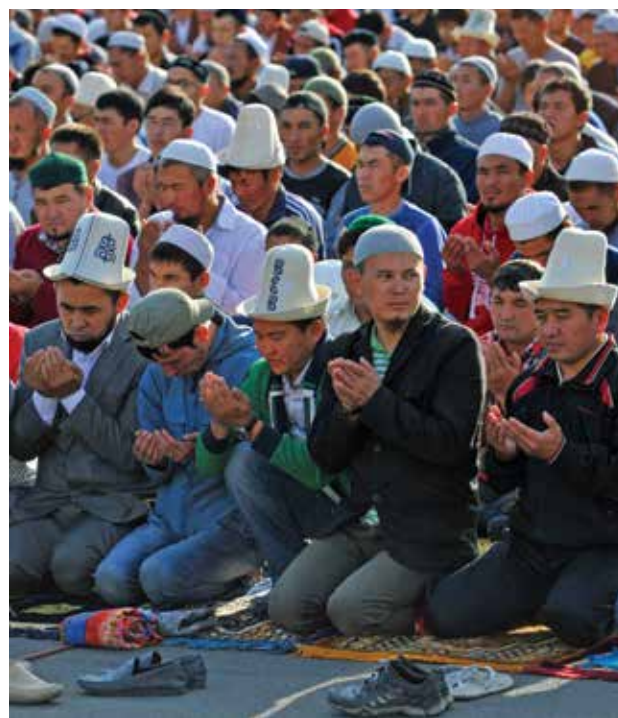
هزاران نفر از مسلمانان نماز عید فطر را در بیشکک، قرغیزستان بجا می آورند. رهبران در حال پیشرفت در زمینه توقف افراطگرایی هستند که اسلام را تحریف میکنند تا بتوانند افراد را برای مبارزه در مکان های مانند سوریه استخدام نمایند.