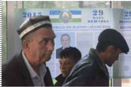
ازبکها در حالی که پوسترهای تبلیغاتی انتخابات را در دست دارند در مارچ 2015 در تاشکند قدم میزنند. مقامات یک توطئه تروریستی را برای اخلال در انتخابات کشف کردند. روبرز

عبدالعزیز منصور، معاون رئیس هیئت مسلمانان ازبکستان نیز از ازبکها خواست کرد با نوشتن کتاب و مقالات ماهیت داعش را به عنوان یک گروه قاتل و جنایتکار افشا کنند تا محبوبیت این گروه تروریستی را نزد جوانان تضعیف نمایند. در اوایل سال 2015 شواهد روزافزون وجود داشت که نشان میداد ممکن است داعش به افغانستان رخنه کرده و کشورهای همسایه در آسیای مرکزی را