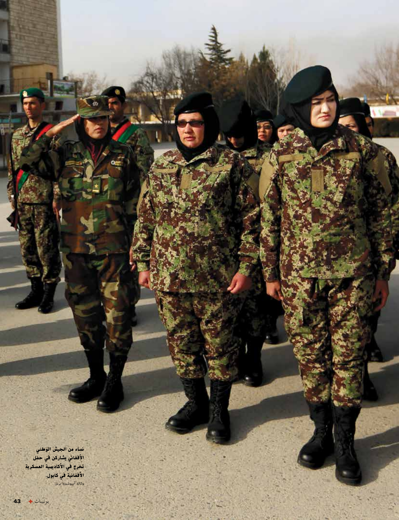
نساء من الجيش الوطني الأفغاني يشاركن في حفل تخرج في الأكاديمية العسكرية الأفغانية في كابول.