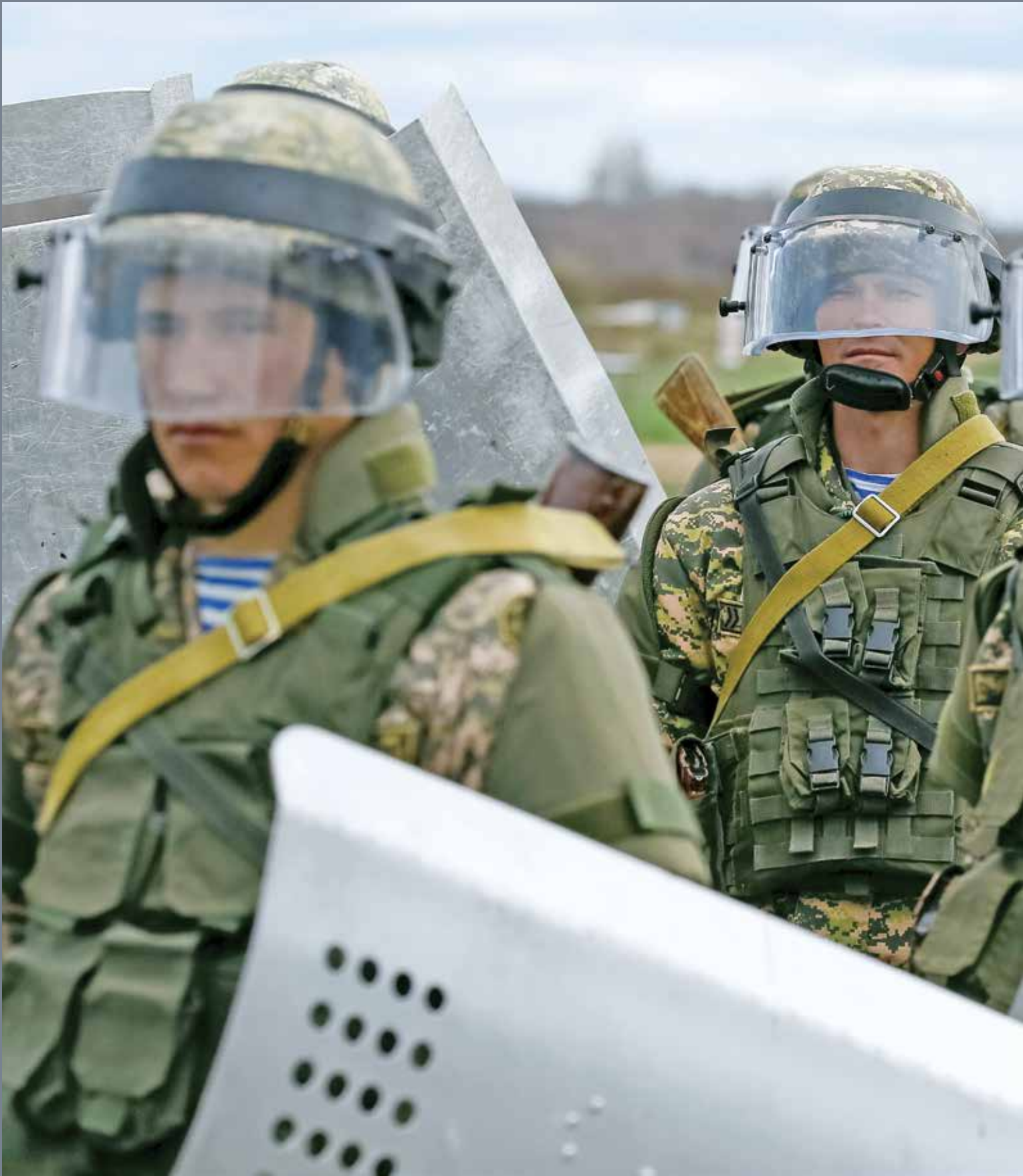
الجنود الكازاخستانيون يتدربون على مكافحة الشغب خلال تمرين عقاب السهوب الذي رعته الولايات المتحدة الأمريكية في أبريل 2017.