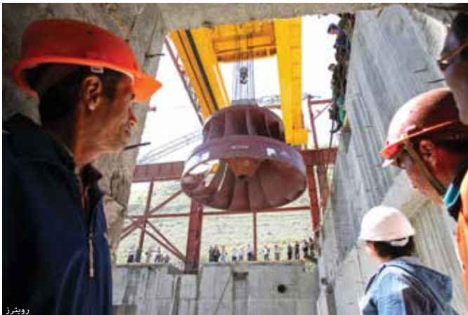
عمال في قيرغيزستان أثناء تركيب توربين في محطة لتوليد الطاقة الكهرمائية كجزء من شبكة من محطات توليد الطاقة التي تحظى بحماية متزايدة في البلد.