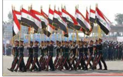
القوات المسلحة العراقية تقيم استعراضاً

تم تحرير ما يقرب من 8 ملايين عراقي وسوري من طغيان داعش الذي خضعوا له منذ