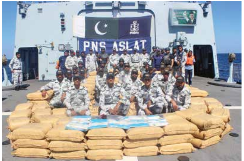
حشيش ضبطته فرقة العمل المشتركة 150