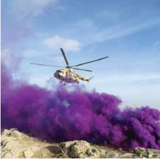
طائرة هليكوبتر في جناح المهمات الخاصة الأفغاني تقترب من منطقة الهبوط أثناء التدريب في قندهار في يناير 2018.