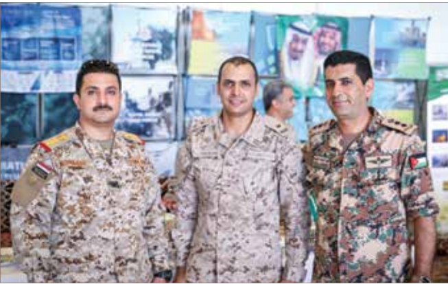
كبار المسؤولين الوطنيين لدى القيادة المركزية الأمريكية من اليمن، يسارا، ومن الأردن، يميناً، ينضمون إلى مسؤول من مكتب التنسيق لدى المملكة العربية السعودية، في الوسط، في الأمسية الدولية