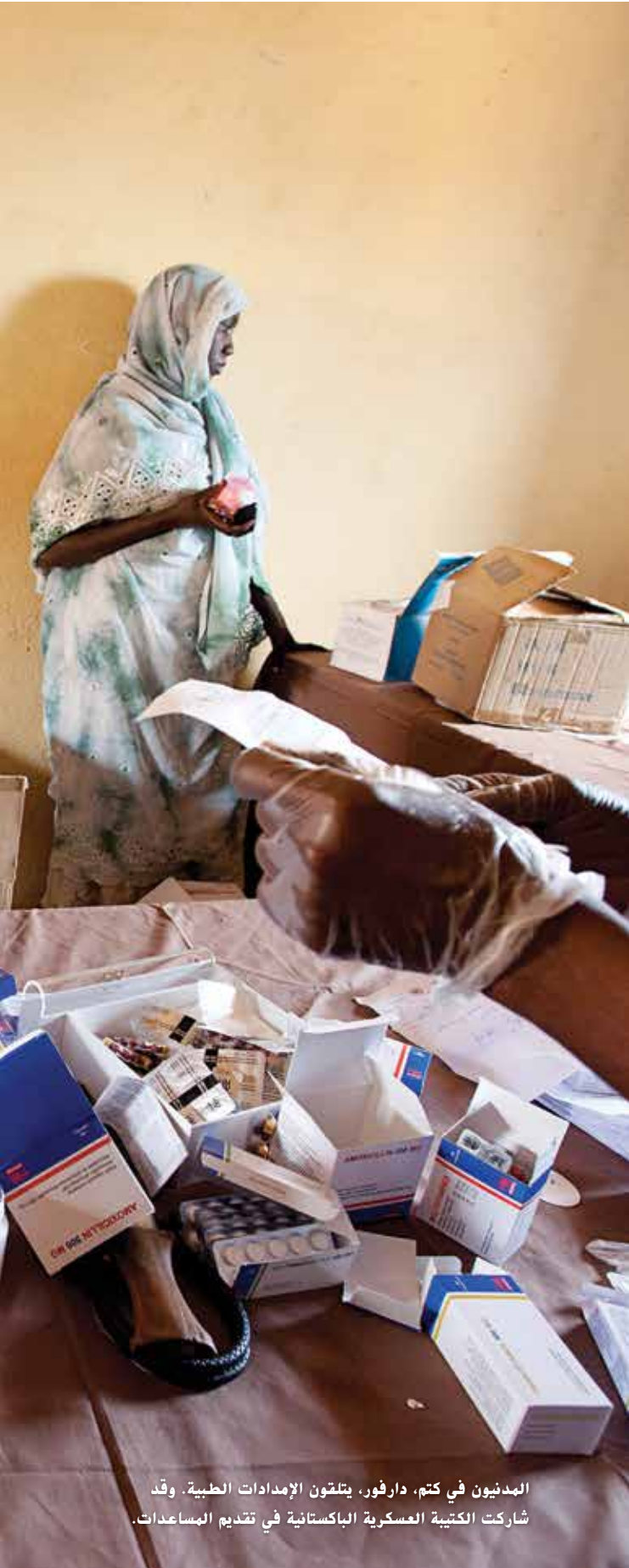
المدنيون في كتم، دارفور، يتلقون الإمدادات الطبية. وقد شاركت الكتيبة العسكرية الباكستانية في تقديم المساعدات.

اعتبر قطاع كتم الفرعي أكثر المناطق المعادية في دارفور بسبب أنشطة المتمردين فيه. ولم يقم أي وفد رسمي رفيع المستوى من بعثة الأمم المتحدة والاتحاد الأفريقي في دارفور أو حكومة السودان بزيارة المنطقة منذ سنوات. بعد وصول الكتيبة الباكستانية واستعادتها للسلام، قام عدد من المسؤولين/الوفود رفيعي المستوى من بعثة الأمم المتحدة والاتحاد الأفريقي في دارفور والسودان والمنظمات غير الحكومية الدولية بزيارة كتم. وكان من هؤلاء سفراء ألمانيا