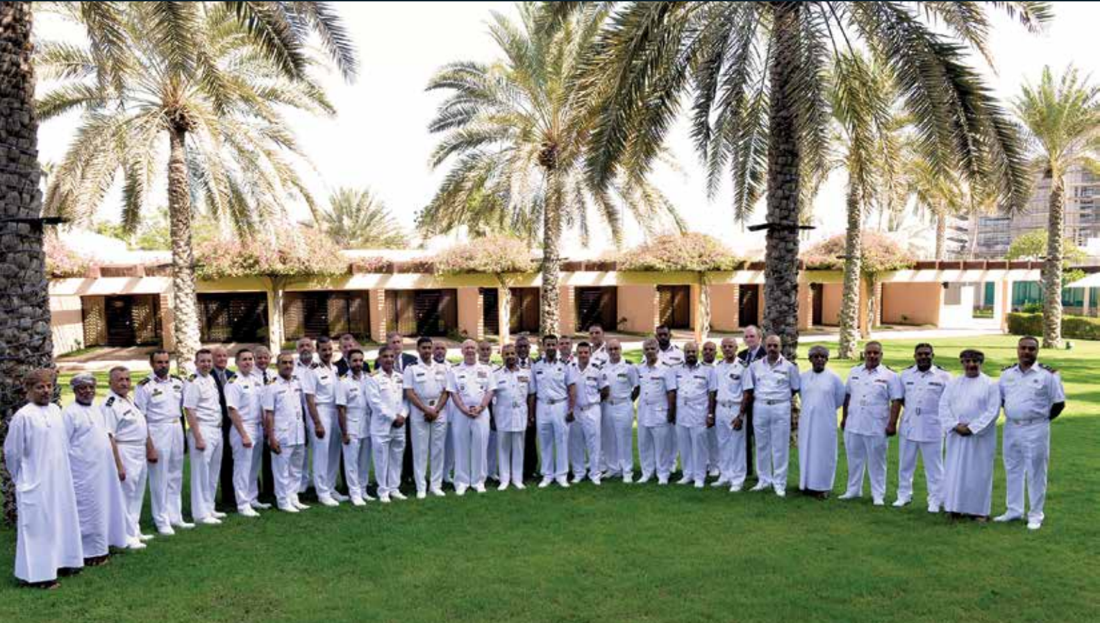
حضور الندوة الإقليمية الخامسة عشر للخريجين في مستط في أكتوبر 2017