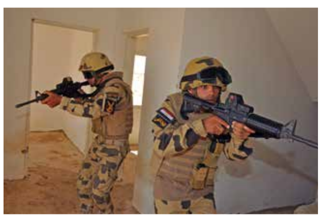
القوات المصرية تتدرب على سيناريو لمكافحة الإرهاب أثناء مناورات النجم الساطع في سبتمبر 2017.

كما جدد القرار التزام الجامعة العربية بإستراتيجية الأمم المتحدة العالمية لمكافحة الإرهاب وقرارات مجلس الأمن لمواجهة الرؤى المتطرفة.