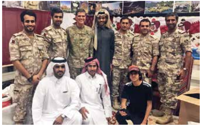
الوفد القطري إلى القيادة المركزية الأمريكية يستضيف الفريق أول فوتيل.