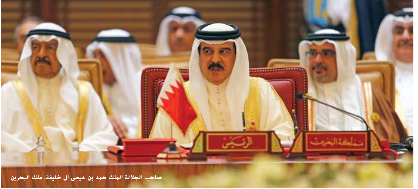
صاحب الجلالة الملك حمد بن عيسى آل خليفة، ملك البحرين