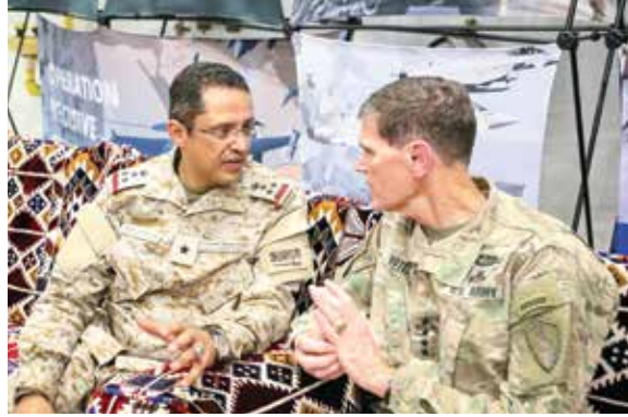
العميد السعودي، فواز الفوزان، إلى اليسار، يتحدث مع قائد القيادة المركزية الفريق أول جوزيف فوتيل.

الضباط وطلاب قطريين يعيشون في فلوريدا. وقدم العميد المهندس يوسف المالكي لمحة موجزة عن ماضي قطر وحاضرها، وبعد ذلك قدم الجناح القطري الشاي والقهوة والتمور في العرض الذي تضمن صوراً لملاعب كأس العالم 2022 الذي تحتضنه قطر، وهي قيد الإنشاء ووصفا لخطة التنمية الاقتصادية للبلاد المسماة رؤية قطر 2030. وأشار العميد المالكي قائلاً "جذب الجناح عدداً كبيراً من الزوار، وكبار الشخصيات، وكبار القادة في القيادة المركزية الأمريكية".