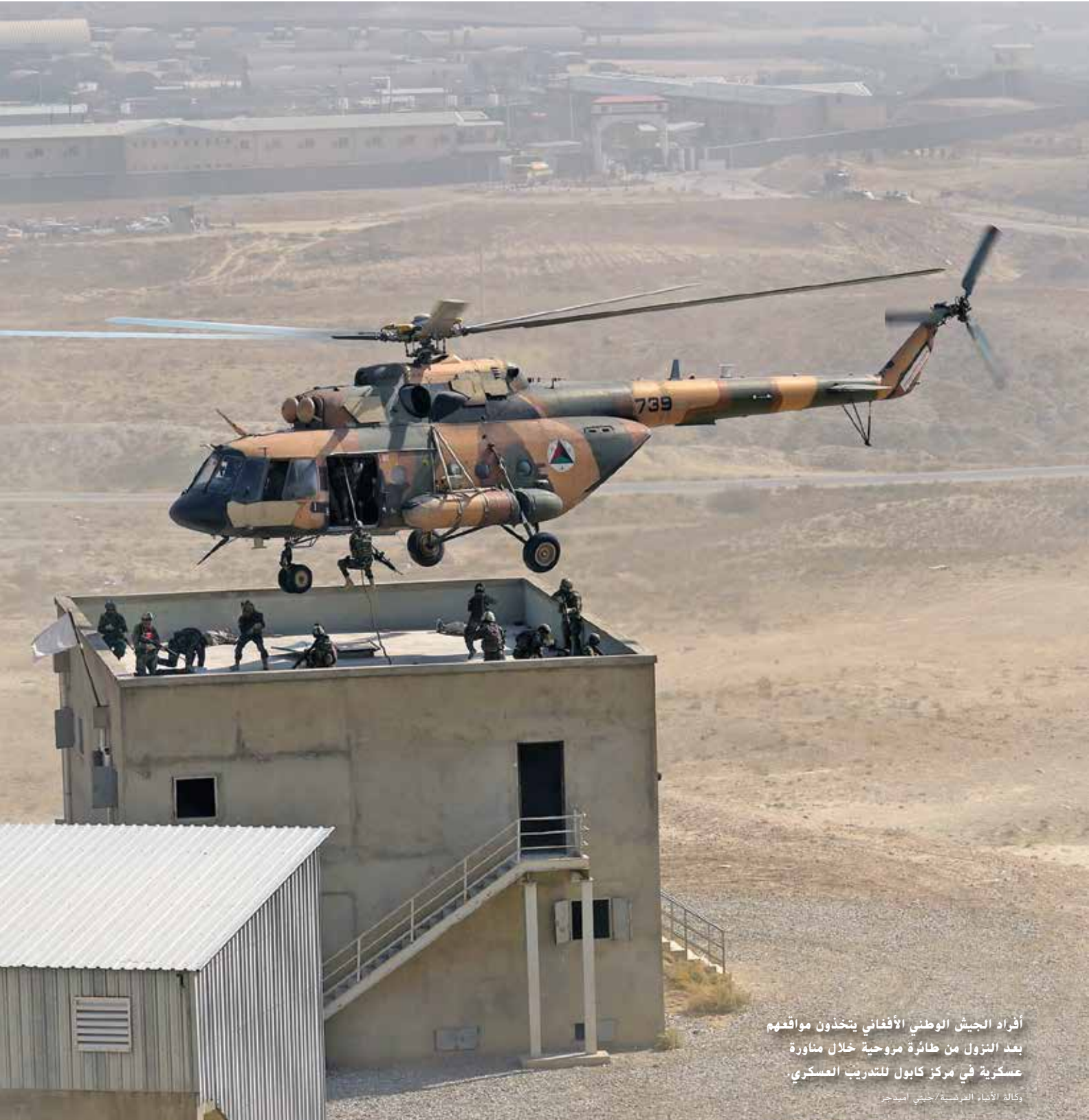
أفراد الجيش الوطني الأفغاني يتخذون مواقعهم بعد النزول من طائرة مروحية خلال مناورة عسكرية في مركز كابول للتدريب العسكري