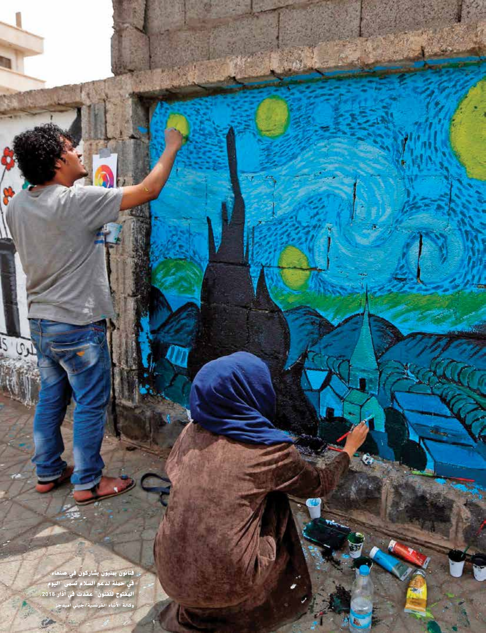
فنانون يمنيون يشاركون في صنعاء في حملة لدعم السلام تسمى "اليوم المفتوح للفنون" عقدت في آذار 2018.