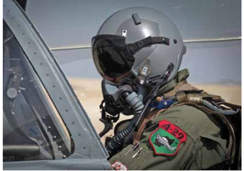
طيار أفغاني يستعد للطيران بطائرة من طراز سوبر توكانو أ-29، وهي طائرة موثوقة وسهلة الطيران يتم استخدامها ضد الإرهابيين.