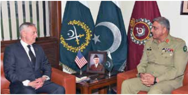
الفريق أول قمر جاويد باجوا، إلى اليمين، خلال اجتماع مع وزير الدفاع الأمريكي، جيمس ماتيس، في ديسمبر 2017.

باكستان الغربي. ففي 2 أغسطس 2017، استضاف الفريق أول باجوا المبعوث الأفغاني الدكتور عمر زخلوال في مقر قيادة الجيش لمناقشة الأمن. وفي فبراير 2018، حضر مؤتمرًا متعدد الجنسيات لقيادة الدفاع في كابول. واعتبرت هذه الاجتماعات بمثابة خطوات أولى لزيادة التعاون بين باكستان وأفغانستان. ووصفه الفريق أول السادس عشر الذي يتولى قيادة الجيش الباكستاني منذ تأسيس باكستان في عام 1947، يحظى الفريق أول باجوا بإشادة زملائه العسكريين الذين يرونه متواضعًا ومتعاطفًا. وقد عززت الزيارة التي قام بها في أغسطس عام 2017 إلى مستشفى كويتا العسكري للاطمئنان على جنود جرحوا في هجوم إرهابي هذا الانطباع. والأمر ذاته ينطبق على زيارته الأخيرة لفوجه القديم لوضع إكليل من الزهور على نصب تذكاري للجنود الذين لاقوا حتفهم من أجل باكستان.