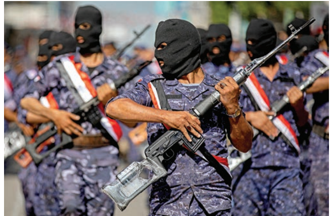
له‌مانگی ئه‌یلوولی 2022، هێزه‌کانی ئاسایشی یه‌مه‌ن به‌شداری نمایشی سه‌ربازی ده‌که‌ن له‌شاری ته‌یز له‌سالیادی شو‌رشی سالی 1962 که‌تێیدا کۆماری یه‌مه‌ن دامه‌زرێنرا.

وه‌كو سه‌بازیک، ساغیر بن‌عزیز سه‌ره‌پرشتیی چهن‌دین ئه‌ركی كر‌دوو و به‌ په‌یژه‌ی په‌له‌ی سه‌ربازیدا سه‌ركه‌وت. ئه‌و چهن‌دین پێكهاته‌ی سه‌ربازی به‌پۆه‌بر‌دوووه و جیگری سه‌رۆکی راهێنهر بووه له‌كه‌مپی سه‌ربازیی تارق بن‌زیدی پاسه‌وانی كۆماریی یه‌مه‌ن.