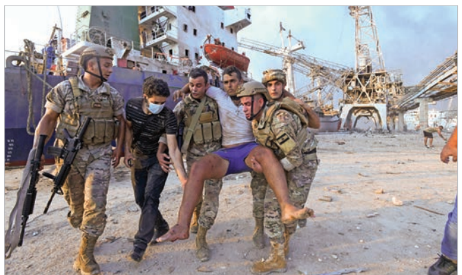
سوپای لوبنان یارمه تی دانیشتوویه کی برینداری به یروت ده دن له ته قینه وه ی به ندره که.