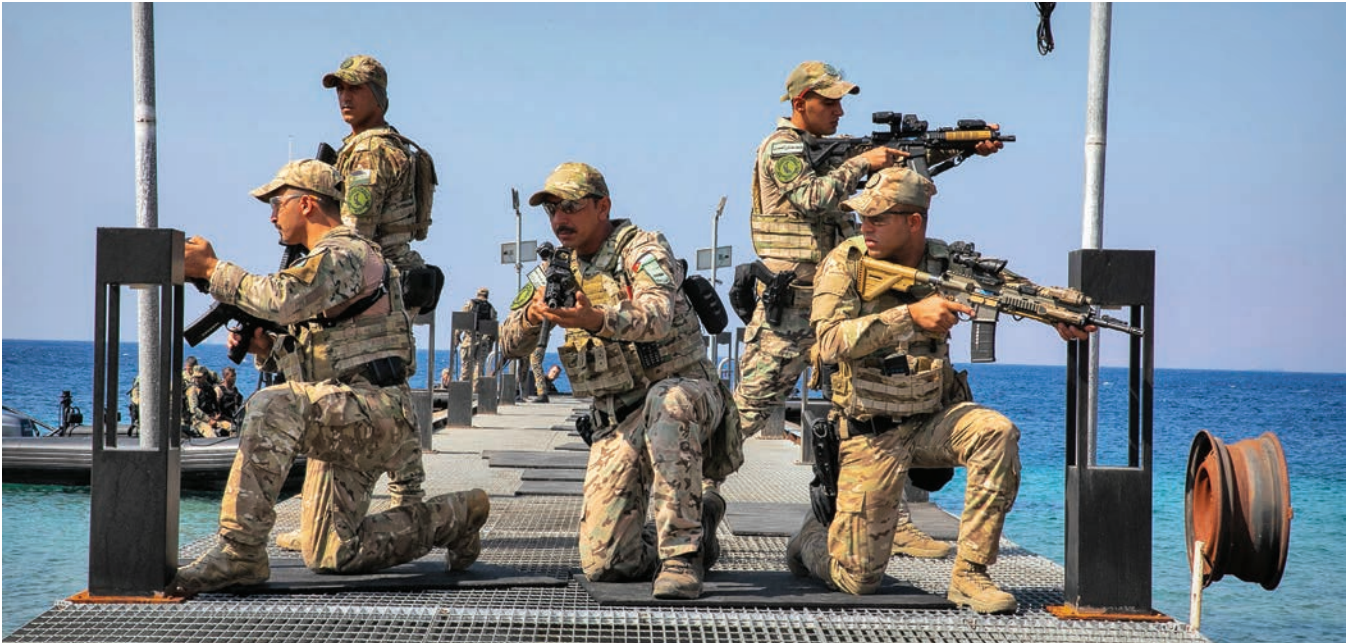
سەربازانی ئەرەدن لە بەکەمی بەرەنگار بوونەوهی تیرۆر پارێزگاری لە دەریاچە بەک دەکەن لە عەقەبە. سەرۆک عەریفی دەستە جۆسی پێس/سویای ئەمریکا

لە یەمەنەوه ھاوێژراون، سنوری ئاسمانی ئەنجومەنی ھاوکاری کەنداویان بەزاندوو. زۆربەیان خراونەتە خوارەوه، بەلام هەندێکیان بەر پلاوتگەکانی نەوت، فرۆکەخانەکان و ویستگەکانی کارەبا کەوتون. بەرنامە بەکەمی پاککردنەوه لە مین لە ولاتی یەمەن کە ناسراوه بە مەسام و سپۆنسەرکراوه لە لاین ولاتی سعودیەوه، زیاتر لە 345,000 بۆمی نەتەقیوی هەلگر توووتەوه.