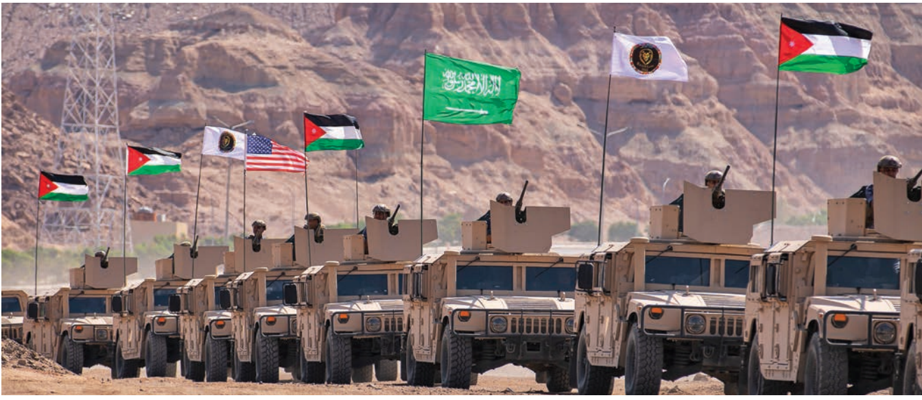
نوؤمېيله سهربازيه كان كه نو ئنه رايه تې هېزى ئه رده ن، سعوديه و ئەمريكا ده كن، له مانگى ئه يلولى سالى 2022 دا به شدارى له مانؤرى سهربازى 'شېرى تامه زرو' دا ده كن. سهرؤك عه ريف بېنجامين مه كدؤنال/ به كه كانى هېزى ده رپاى ئەمريكا

سيناريو كانى 'شېرى تامه زرو 22' له سهر ژېنگه ي ستراتېژى تېستا و به رپه رچانده وى هېرشه كانى ناو ته و ژېنگه يه دروستكرا بوون، له دوخېكدا ته گه ر هه ره شه ي ئاسايى يان نا ئاسايى بن له ولاتانى كېشوه ريه وه يا خود گروپه تېرورستيه كانه وه. "عه مېدى هېزه چه كداره كانى ئه رده ن موحه مه د بن سه مه دى ئەمى پراگه ياند، كه سهرؤكى فه رمان و به رپوه بردنى به شداربووانى ناوه ندى مه شقه كه بوو. "له رېگه ي ته و سيناريو يانه كى به بو ئەم مه به سته دا هېنرابوون، ئەم هه ره شانه له نو پراسيؤنېكى ژېنگه ي پېكه وه يى هاوبه شى چه ندين ولات و گروپى سهربازى به رپه رچانده وه كه گوچا بوون له گه ل بنه ما سهربازيه به كارها تووه كان له لايه ن ولاتانى به شداربووه وه. هه نديك ولات به شيوه يه كى راسته خو و چالاك به شداريان له نو پراسيؤنه كاندا كړد، وه كو ئه رده ن، وىلايه ته يه كگرتووه كانى ئەمريكا، سعوديه و عىراق، له كاتېكدا ته وانى تر وه كو چاودېر به شداريان كړد له مه شقه كه دا كړد بو به ده سخته ستنى ئەمومون له بارودوخى گشتيه مه شقه كه. " له ناوه راستى مه شقه كه، سهر كرده يه كى بالاي سيميناره كه سهرنجى فه رمانده