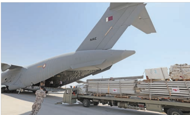
فرۆکه یه کی سه ربازی قه ته ری پیکه اته کانی نه خۆشخانه ی کاتی و پۆبوستیه ته ندروستیه کان ده که یه نیتته لوبنان دوا ی رودانی کاره ساتی به ندره که.

زیاتر له 6,000 لیتر له شله ی سوتینه ر له تانکیه کانه وه ده زه یان کرد بوو، و سه ربازه کان و هاو لاتیانی مه ده نی درزه کانیا ن چاره سه ر کرد و پڑانه که یان وه ستاند. مانگی که له دوا ی کاره ساته سه ره تاییه که، که و ته وه ی ناگر له کۆگایه کی تایه ی به ندره که مه ترسیی دروستکرد له سه ر گرگرتنی هه زاران لیتر له سوته مه نی عه مبارکراوی قورسی نزیک به روداوه که. هه ولێکی هه ما هه نگیی پیکه وه یی له سه ربازه کان، کارمه ندانی ناگرکوژینه وه و هیزی ئاسمانی لوبنانی پۆبوست بوو بۆ کۆنترۆلکردنی ناگره که.