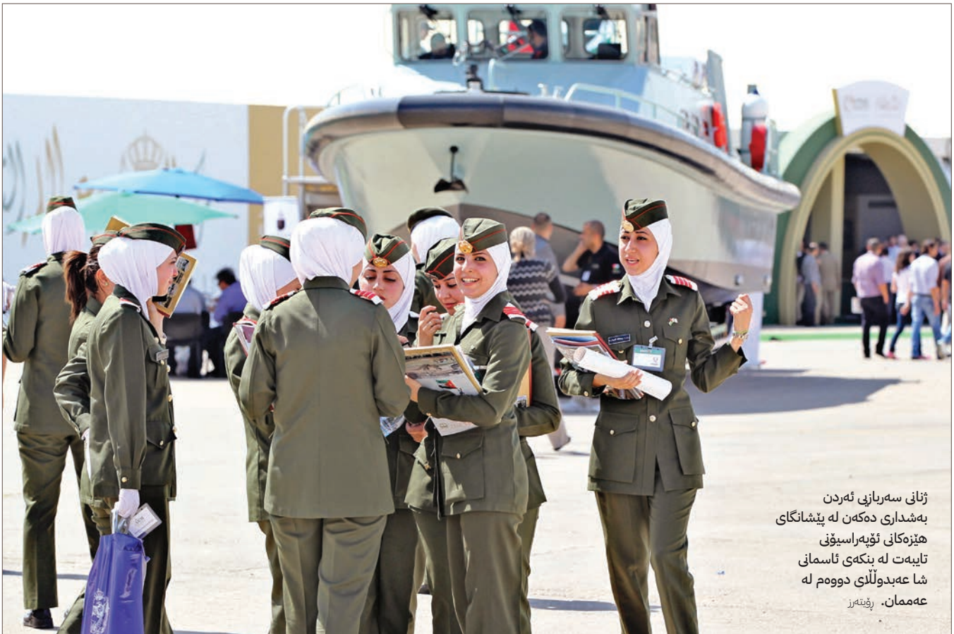
ژنانى سەربازى ئەردەن بەشدارى دەكەن لە پيشانگاي هەيزەكانى ئۆپەراسيۆنى تايبەت لە بنكەى ئاسمانى شا عەبدوللى دووهم لە عەممان. رپنەر

لە مانگى نيسانى سالى 2022، ناوئەندى مەشقرى سەربازى ژنان لە ئوردن ئاھەنگى دەرچوونى خولى ژمارە 2022/1 بۆ ئەفسەرانى پەلدار و بپپەلدارى ژن رپكخست. دەرچووان پەيوەندى دەكەن بە يەكە تايبەتەكانى ئاسايش. خولى شەس هەفتەيەكە تواناي جەستەى، فرياوگوزارى سەرەتايى، نيشانەگرتن، ليهاوووى جەنگ، شەرى مەودا نزيك، و ليهاوووى شاخەوانى لەخۆدەگرت بۆ ئەو ئەركانەى لە ناوچە نارپكەكاندا ئەنجام دەدرين. ”هەيزە چەكدارەكان هەولئى برەودان بە سەربازى ژن و فراوانكردنى توانا سەربازبەكارەكان دەدەن لە رپگەى خولى تايبەمەندكاراوەكان بۆ ئەووى بيانگەيەننە ئاستىكى بەرزى پيشەى تا بتوانن