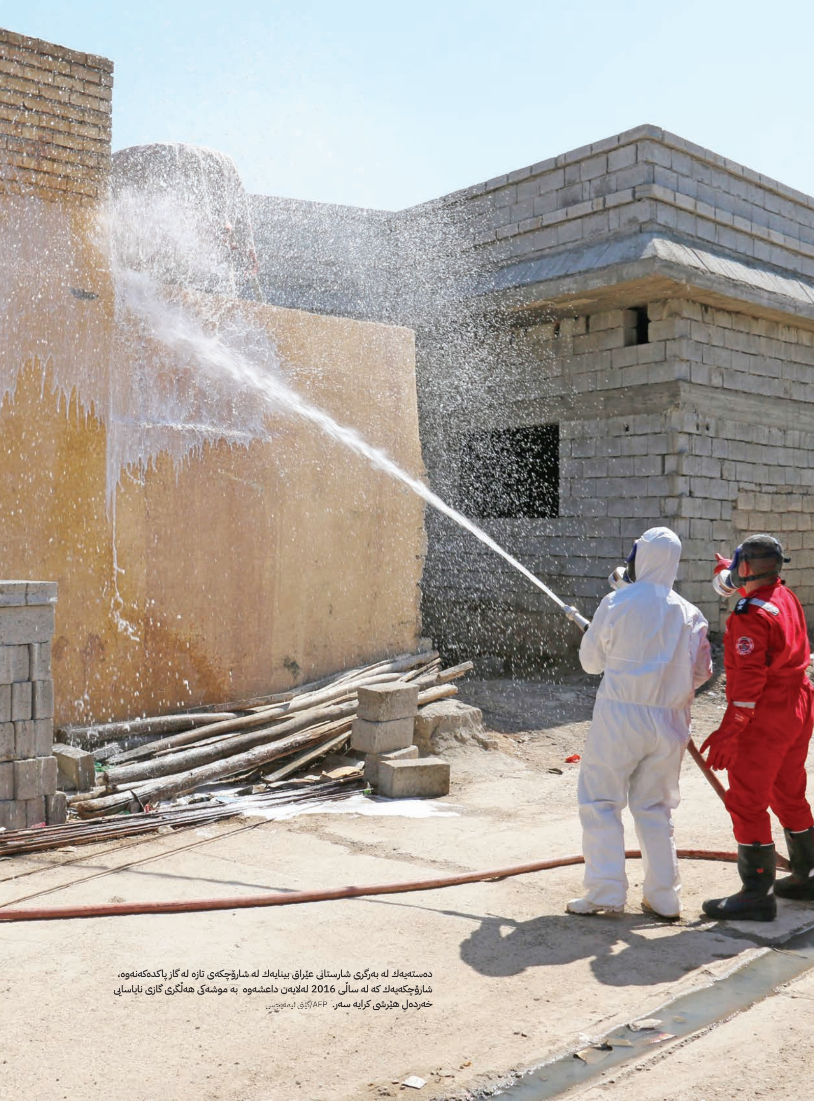
دهسته به كه له بهرگري شارستانى عىراق بينايه كه له شاروچكهى تازه له گاز پاكده كه نه وه، شاروچكه به كه له سالى 2016 له لايهن داعشه وه به موشه كه هه لگري گازى ناپاسايى خهردهل هيرشى كرايه سهه.