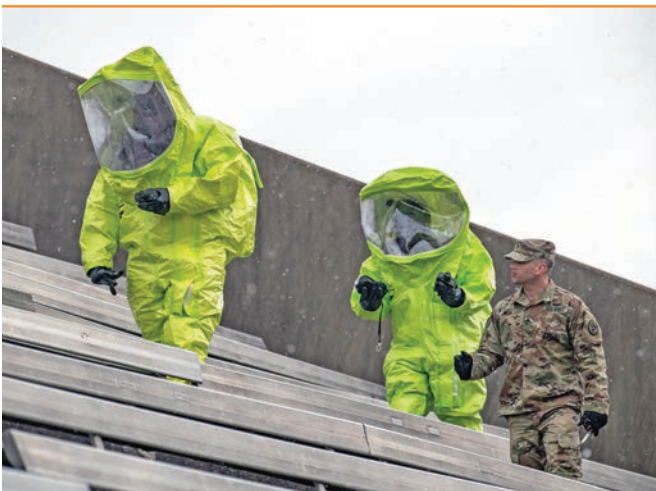
سه رباران له گه ل یه که ی خزمه تگوزاری ته ندروستی سه رباری قهتەر و یه که ی چه کی کومه لکوژ له گه ل هیزه کانی ویلبایه ته به کگرتووه کانی ئه مریکا له سالی 2022 راهینان ده که ن. قهتەر شانازی به هاوبه شییه فره ته وه ییه کانی خۆبه وه ده کات بۆ به رنه رگاریبوونه وه ی هه ره شه ئه منیه کان. لیدوون، ریتسون/پاسه وان سوبانی نیشتمانی ئه مریکا

ئه گه ر هه ر ئومیدیک له ئارادابیت بۆ دۆزینه وه ی شیوازه داهینراوه کان له پیتا و سه قامگیرکردنی ئاسایشی جیهان و شیوازه کانی تری هاوکاری، ئه واپپوسته سه رته سیسته میکی دادپه روهرانه ی هاوکاری بچه سپیندریت. زیاتر ده رباره ی سیاسه تی هاوسه نگیی قهتەر پرسیارم لیده کریت. ئایا ئیمه چون ده توانین په یوه ندیه کانی وه ک به رگری، سیاسی یاخود ئابووری یاریزین له گه ل هاوبه شه فره ته وه ییه کانمان که به ژه وه ندی جیاوازیان هه یه؟ من ده مه ویت زور ئاسان جه خت له سه ر ئه وه بکه مه وه که قهتەر هیه چ یاریه ک ناکات. ئیمه ده زانین خومان کیین، که موکوپیه کانمان و هه موو شتیک ده زانین؛ باش ده زانین که له پیتاوی چی ده جه نگی و نه خشه ریگی تايهت به خومان په یرو ده که یں له دیدگای نیشتمانیی قهتهری 2030. که سایه تی ئیمه بۆ هه مووان ئاشنایه. کانتیک تۆ مامه له له گه ل دولهتی قهتهدا ده که ی، ئه و تۆ به راستی ده زانیت له گه ل کیدا مامه له ده که ی: دۆستیکی راستکو و متمانه پیکراو که هه رگیز پارا نابیت له وتی راستیه کان.