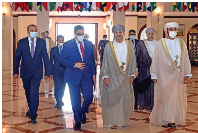
وهزیری کاروباری دهره وهی عومان سه یید به در ئین جهمه د بن جهمود بوسه یدی، له ناوه رپاست، پښشوازی له هاوتا یه مه نیبه که ی ئه حمده عه واد بن موباره ک، له لای چه پ، دهکات له مه سقه ت له مانگی جوزهرانی سالی 2021.

له وه لآمی داواکاری حکومه ته کانی شانشین بهریتانیا، ئیندونسیا، هندستان و فلیپین، سوئلتانی عومان له مانگی نیسانی سالی 2022، ئاسانکاری کرد بۆ ئازادکردنی 14 هاوالاتی به بارمه تگیروای بیانی له یه مهن.