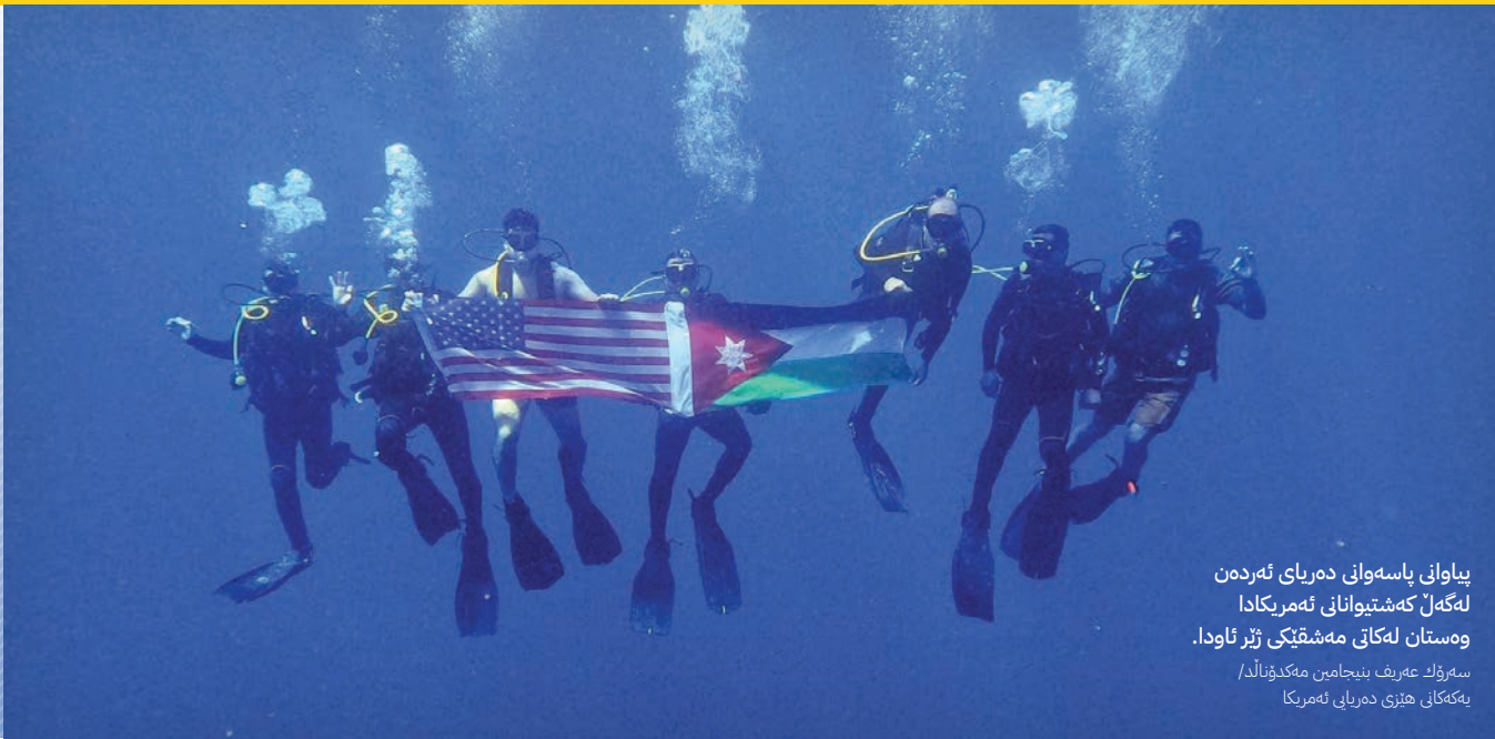
پیاوانی پاسهوانی دەریای ئەردەن لەگەڵ کەشتیوانانی ئەمریکادا وەستان لەکاتی مەشقێکی ژۆر ئاودا.

کە دەوڵەتانی دراوسێ و ناوچەکە پووبەرووی بپوونەوێت بێت نرابوون، تێمە لە ھێزە چەکدارەکانی ئەردەن، سوپای عەرەب، ھەمیشە ھەول دەدەین پێشکەوی بە ئامادەیی جەنگدا بۆ پووبەرووونەوێت گۆرانکارییەکان و ھەرەشەکان لەسەر زەوی، دەریا و ئاسمان.