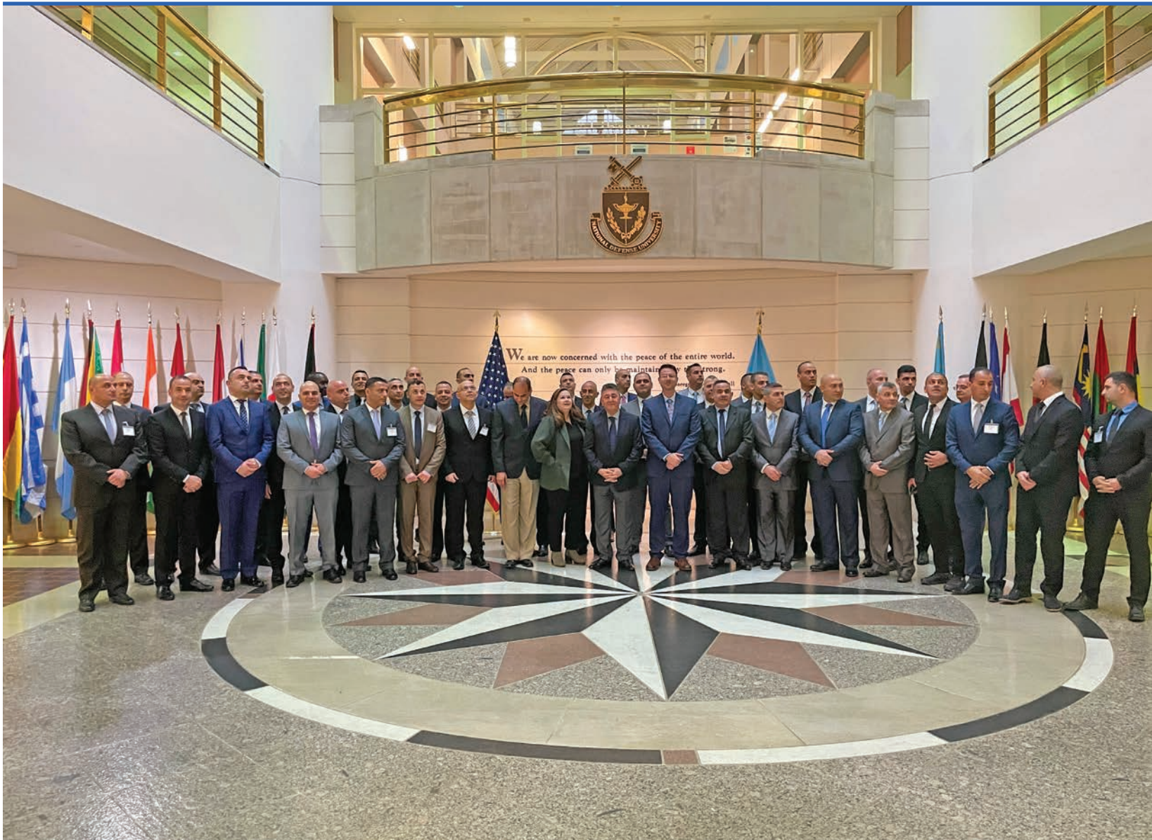
ئەفسەرانى لوبنانى لە كۆلېژى فەرماندەي و دەستەي فواد شەھاب لە سالى 2022 لە وانەكانى زانكۆي بەرگري نىشتمانى ئەمريكى بەشدارى دەكەن.

ئامانجى مەنەھجى خولى دەستە لە كۆلېژدا برىتتېيە لە پەرەپېدانى ئەفسەرانى فەرماندە و ئامادەكردنىان بۇ سەرپەرشتىكردنى يەكە سەربازىيە گەورەكان يان كارکردن وەكو ئەندامىكى دەستە. مەنەھجەكە ھەموو تەكنىكەكان و مىكانىزمەكانى بېراردانى سەربازى لە سەر ئاستى تەكتىكى و كردارى لەخوگرتبوو وە لەلايەن فەرماندەو بۇدانانى پلان و ھەلسەنگاندنى دۆخەكە لە ھەموو ئاست و پلەيەكدا بۇ ئەوھى بېرارىكى گونجاو بدرىت بۇ چارەسەرکردنى ھەر كېشەيەكى تەكنىكى يان كردارى، چارەسەرکردنى ئالەنگارىيەكانى ئاسايش و بەرەنگاربوونەوھى تىرۆر، يان بەرپۆھەردنى قەيرانە گەورەكان.