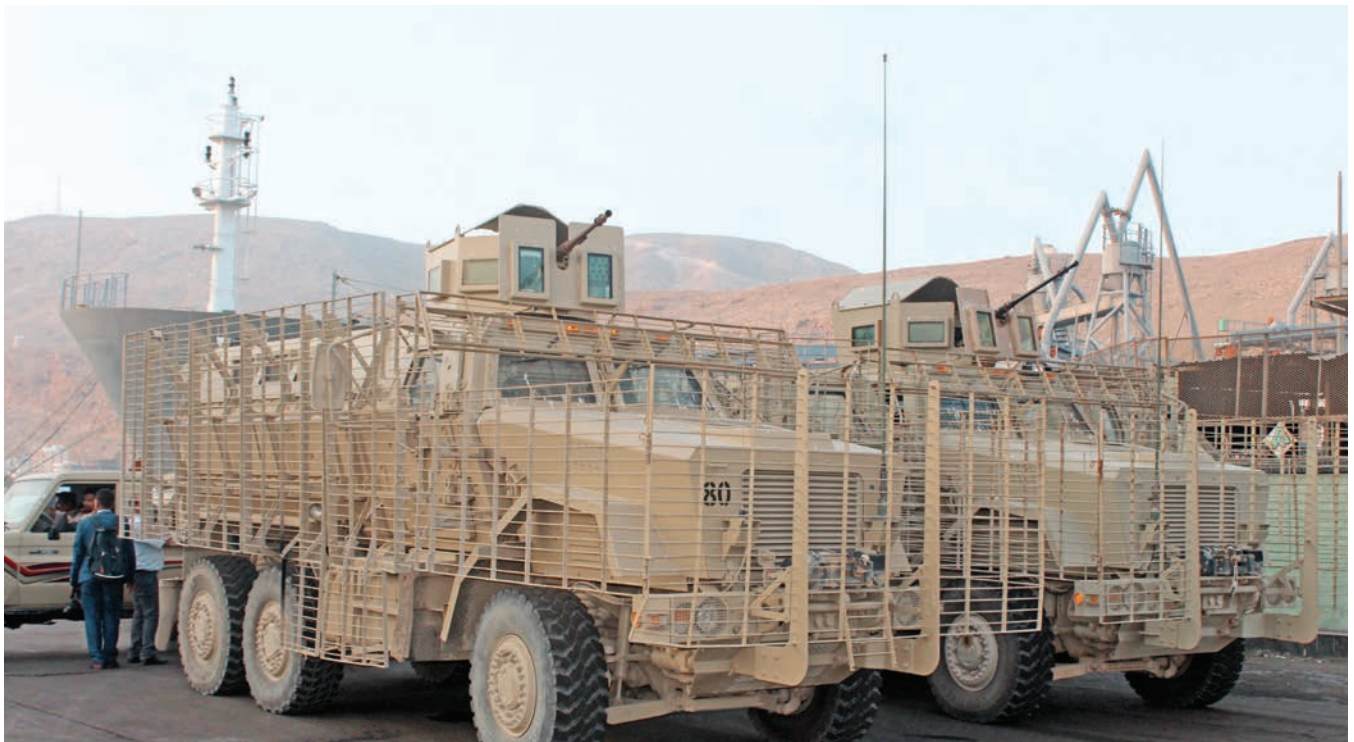
موتورهای زرهی که قوای طرفدار دولت یمن سرنشینان آن هستند، امنیت بندر مکارا را تأمین می‌کنند.

تروریست‌ها بیشتر اوقات در مکالمات خود از دستگاه‌های مدرن استفاده نمی‌کنند و در پی پرهیز از استراق سمع و شناسایی شدن متعاقب آن هستند. آنها به دور از چشم مقامات در بین جمعیت ناپدید می‌شوند و مقر یا فرقه خاصی ندارند. آنها در بین ما زندگی می‌کنند، و در عرصه عمومی نیز فعالیت‌هایی غیرنظامی که همه ما انجام می‌دهیم را انجام می‌دهند.