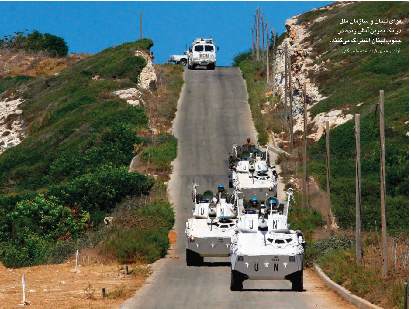
قوای لبنان و سازمان ملل در یک تمرین آتش زنده در جنوب لبنان اشتراک می‌کنند.

عساکر لبنانی از لواهای 5 و 7 پیاده نظام برای انجام این تمرین در نواحی صور و مرجعیون مستقر شدند، در حالی که غند 5 مداخله در منطقه لیطانی جنوبی موضع گرفت. عساکر ایتالیایی، اسپانیایی و فرانسوی نیز در بخش‌های دیگر پراکنده شدند. قومندان UNIFIL تورن جنرال استفانو دل کول و قومندان