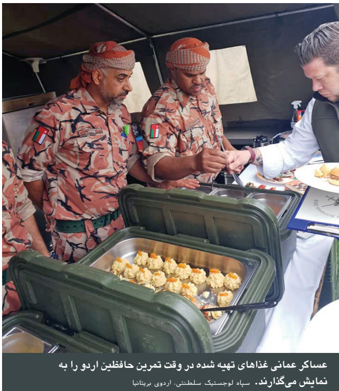
عساکر عمانی غذاهای تهیه شده در وقت تمرین حافظین اردو را به نمایش می‌گذارند. سپاه لجستیک سلطنتی، اردوی بریتانیا

اردوی سلطنتی عمان به قهرمانی در قسمت تهیه وعده‌های غذایی برای عساکر دست پیدا کرد. آشپزهای اردوی عمان در یک مسابقه سالانه با عنوان "تمرین حافظین اردو" که در می 2019 در انگلستان برگزار شد، اشتراک کردند. تیم عمان با استفاده از اچاق گازهای اردو در شرایط سخت در فضای باز، نان‌های لواش پُر شده از سبزیجات، گوشت، دسر و دیگر غذاها را تهیه کردند که داوران آنها را در خیمه‌های نظامی چشیدند.