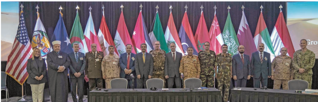
مقامات دفاعی در کنفرانس مدیران استخبارات نظامی خاورمیانه قومندانی مرکزی ایالات متحده در سال 2019 اشتراک می‌کنند. قومندانی مرکزی ایالات متحده

ما ضمن کار معلوماتی خستگی‌ناپذیر که به نظر ما در مقایسه با فداکاری‌های مردمان ناچیز است، می‌کوشیم امنیت کشور را احیا کنیم و اردوی نیرومند را بازسازی نماییم. ما همواره کاملاً آماده همکاری با دیگر سازمان‌های امنیتی هستیم تا با خنثی کردن نقشه‌های دشمن و قوای شرور و تروریستی، بتوانیم تمام کوشش خود را برای خدمت به کشورمان انجام دهیم.