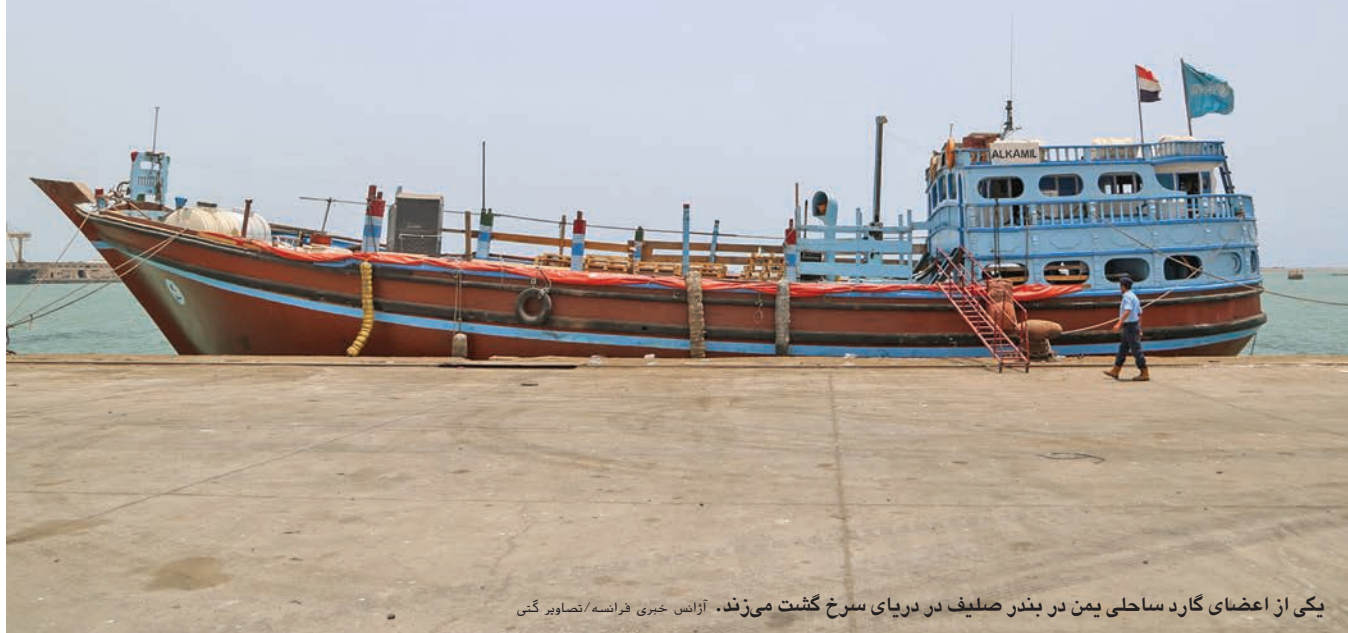
یکی از اعضای گارد ساحلی یمن در بندر صلیف در دریای سرخ گشت می‌زند.

ما امیدوار هستیم که بتوانیم یک قوای بحری حرفوی و ملی وفادار به خداوند و کشور ایجاد کنیم که بتواند از 2 هزار کیلومتر خط ساحلی کشور محافظت کرده و مانع از صید بیش از حد ماهی در آبهای ما شود.