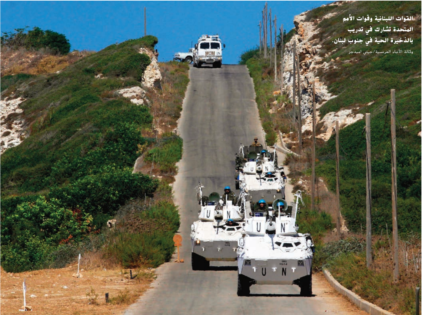
القوات اللبنانية وقوات الأمم المتحدة تشارك في تدريب بالذخيرة الحية في جنوب لبنان.

أجرت القوات المسلحة اللبنانية وشركاؤها الإيطاليون والفرنسيون والإسبان تدريبات لمكافحة الإرهاب باستخدام المدفعية الميدانية والمدافع الرشاشة والبطاريات المضادة للطائرات في أيلول/سبتمبر 2019. وجرت المناورة العسكرية المسماة العاصفة الفولاذية في منطقة رأس الناقورة بجنوب لبنان وشاركت فيها قوات أوروبية مع قوة الأمم المتحدة المؤقتة في لبنان. وقام منظمو التدريبات بمحاكاة هجمات إرهابية تطلبت نيران المدفعية والرشاشات لصدّها. وانتشرت قوات لبنانية من لوائي المشاة الخامس والسابع في منطقتي صور ومرجعيون لأغراض التدريب، في حين تمركزت كتيبة التدخل الخامسة في منطقة جنوب الليطاني. وانتشرت القوات الإيطالية والإسبانية والفرنسية في قطاعات أخرى. وتولى قائد قوة الأمم المتحدة المؤقتة في لبنان اللواء ستيفانو ديل كول