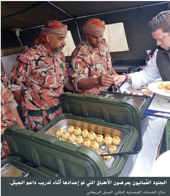
الجنود العُمانيون يعرضون الأطباق التي تم إعدادها أثناء تدريب داعم الجيش.

وكانت هذه هي المرة الأولى التي تتنافس فيها سلطنة عُمان في مسابقة "داعم الجيش"، وقد قضى الطهاة بعض الوقت قبل المنافسة يتدربون مع الشركاء البريطانيين. وقد أثمر التدريب بفوز الجنود العمانيين على المنافسين في إعداد وجبات الطعام للقوات أثناء الحركة.