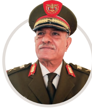
اللواء الركن محمد زيد ابراهيم

الدولة المدنية حيث نقبل الآخر المختلف معنا ونحترم رأيه.