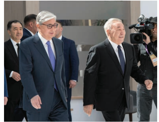
قاسم جومارت توكاييف، رئيس كازاخستان، إلى اليسار، والرئيس السابق نور سلطان نزارباييف يحضران قمة دولية في عاصمة دولتهما في أيار/ مايو 2019.

المصادر : Zakon.kz ,Zonakz.net ,Inform.kz