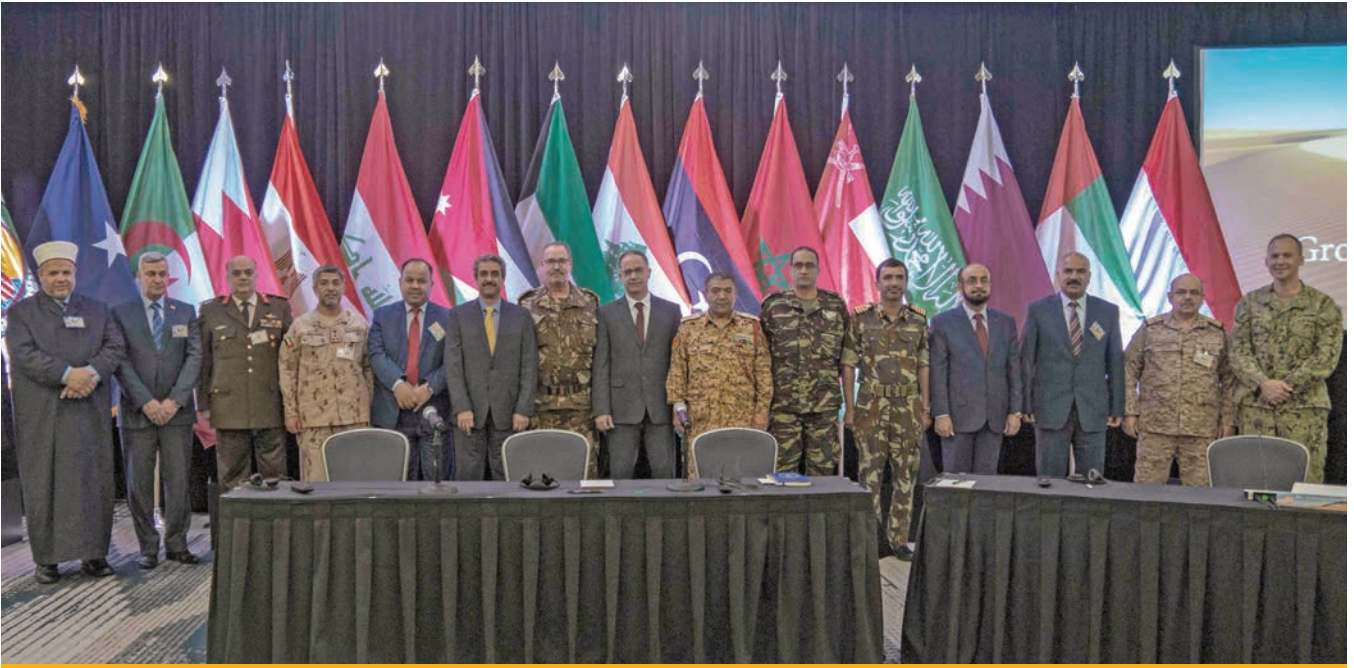
مسؤولون عسكريون يحضرون مؤتمر مدراء الاستخبارات العسكرية للشرق الأوسط الذي استضافته القيادة المركزية الأمريكية عام 2019. القيادة المركزية الأمريكية

وبناء جيش قوي، فنحن دائماً على استعداد تام للتعاون مع كل الأجهزة الأمنية الأخرى بكل ما نستطيع لخدمة بلادنا من خلال احباط مخططات العدو وقوى الشر والإرهاب، إذ شاركت هيئة الاستخبارات والاستطلاع بإعداد الخطط الأمنية والبحث والتحري والمشاركة في مواجهة تنظيمي القاعدة وداعش، اللذين زادا من نشاطهما في فترة ما بعد التحرير في العام 2016م، وساهمنا مساهمة فعالة في القضاء على، أو طرد الكثير من مقاتلي المنظمين الإرهابيين.