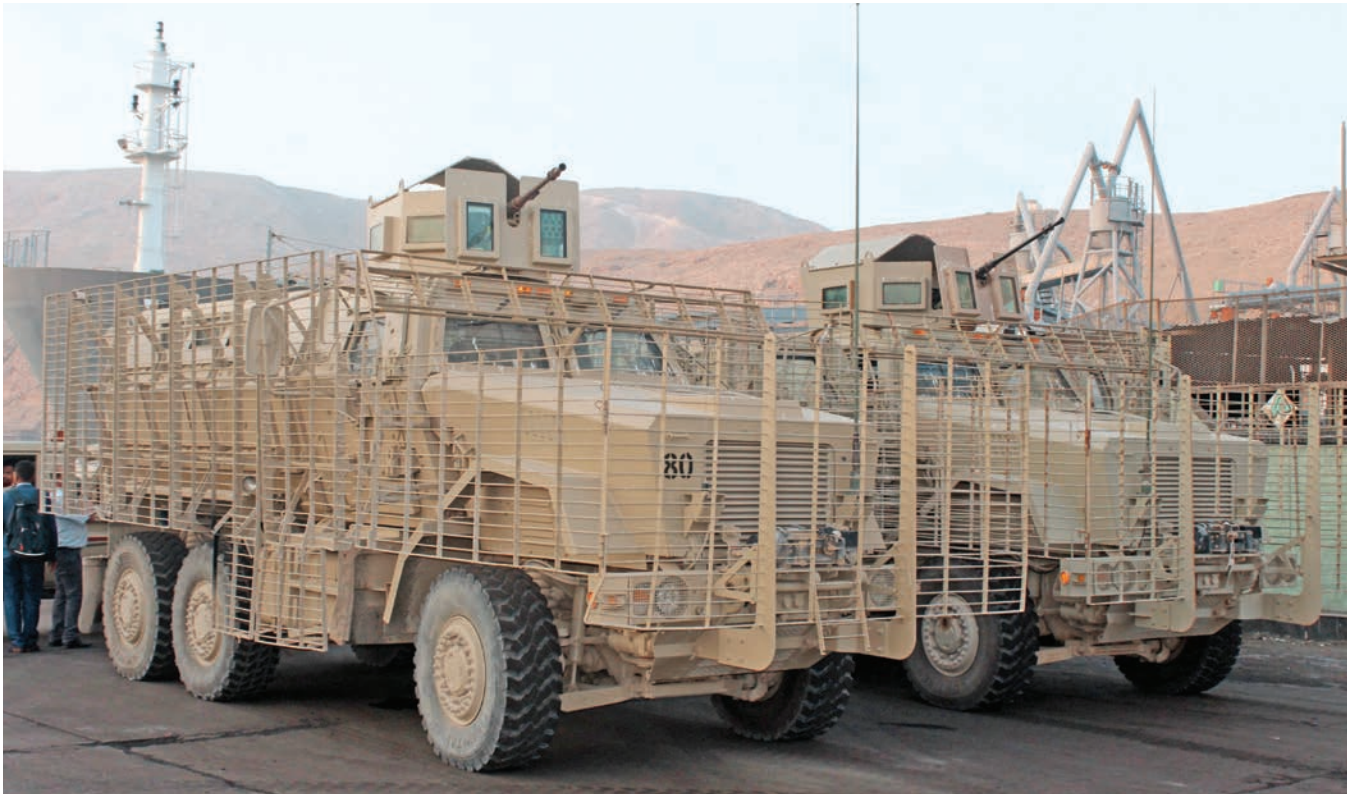
عجلات مدرعة للقوات الحكومية تؤمن ميناء المكلا.

تشكلت هيئة الاستخبارات والاستطلاع اليمنية بعد قرار هيكله الجيش، والتي أقرها فخامة المشير الركن/ عبد ربه منصور هادي القائد الأعلى للقوات المسلحة رئيس الجمهورية بعد توليه السلطة في عام 2012م، حيث تم اعتماد هيئة الاستخبارات والاستطلاع بدوائرها الاستخباراتية الثلاث، وثم مديريتين تخصصية (بحرية وجوية) وذلك في العام 2014م في العاصمة صنعاء. ونتيجة لما تعرضت له المؤسسات العسكرية والمدنية من دمار في 2015م،