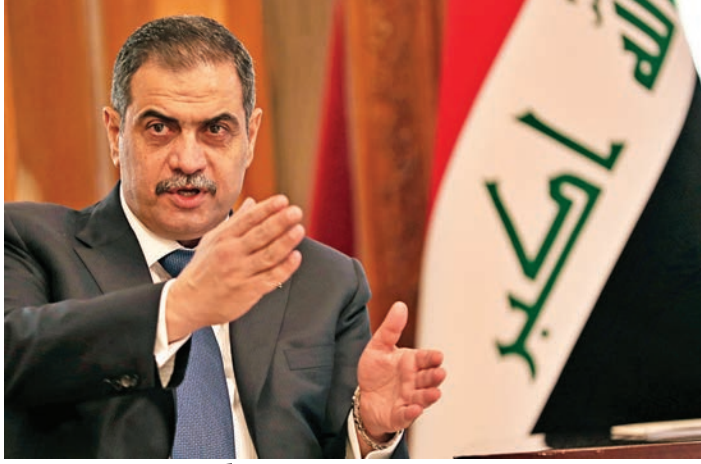
وكالة أسوشيتد برس