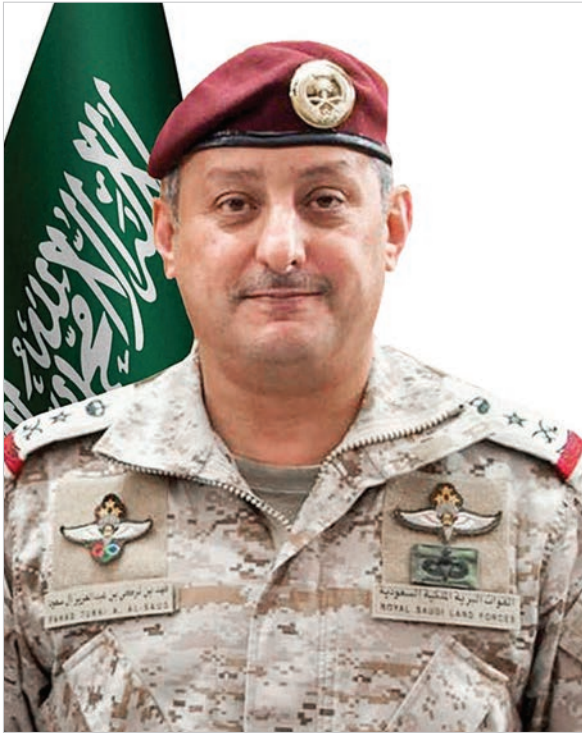
صاحب السمو الملكي الفريق الركن الأمير فهد بن تركي بن عبد العزيز آل سعود

العقيد فرحان مساعد النومسي، رئيس خلية العمليات النفسية بالقوات المشتركة في المملكة العربية السعودية