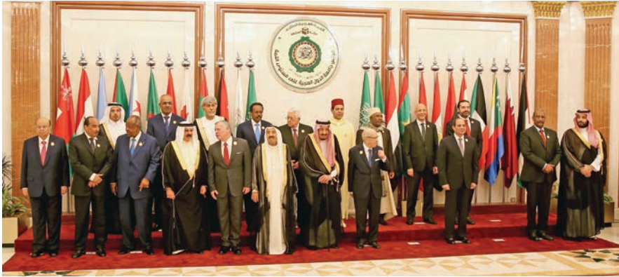
قادة الجامعة العربية يجتمعون في مكة بالمملكة العربية السعودية في 31 أيار/مايو 2019.